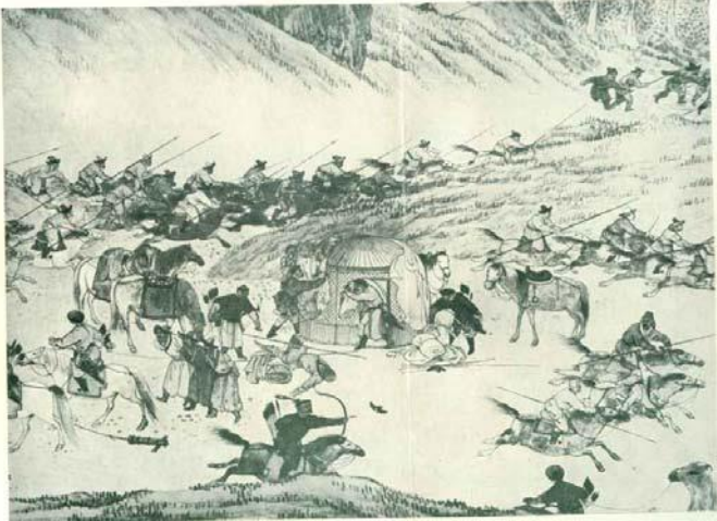
Mancurların (Çin) Oyrat-Cungarlara saldırısı. Çin minyatürü. 18. yy.