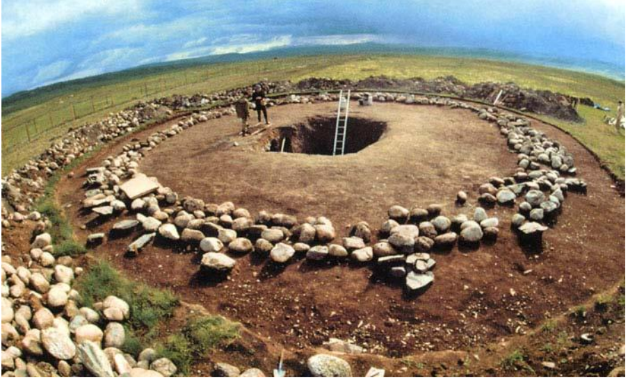
Tabın-Bogdo-Ola. Üköklü kraliçe bulunan kurganlık. Altay. Burada Moğolistan, Rusya ve Kazakistan'ın sınırları buluşur

Tarihi yazılı kaynaklarında Oyratlar “Olöt” (ögeled) denilen ikinci adı ile de belli olmuşlar. Oyratların tarihi ile ilgili esas tarihi kaynak olan “İlethel Şastirde” olöt (ögeled) terimi “Oyrat” özel ismi ile eşanlam olarak gösteriliyor (Sançirov 1990:49-50). Elbette, araştırmacılar (V.Uspenskiy) “olöt” – oyrot adının bozulmuş şekli diyorlarsa, ikincileri (P.Pallasv.b.) “olötler” Oyratların içindeki küçük boyun adı, son dönemlerde İdildeki Kalmuklara yayılan isim olarak bakıyorlar (Sançirov 1990:50-52). Fakat bu özel isim 17. yüzyıldan sonra Moğol dilli kaynaklarda bulunmaya başladığını belirtmek lazım.