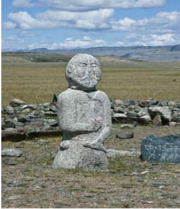
Eski Türk balbalı. Moğol Altayı.