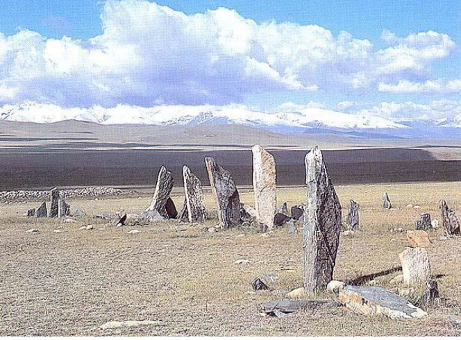
Tsaagan-Astag nehrinin vadisindeki eski Kırgız anıtları. Batı Moğolistan