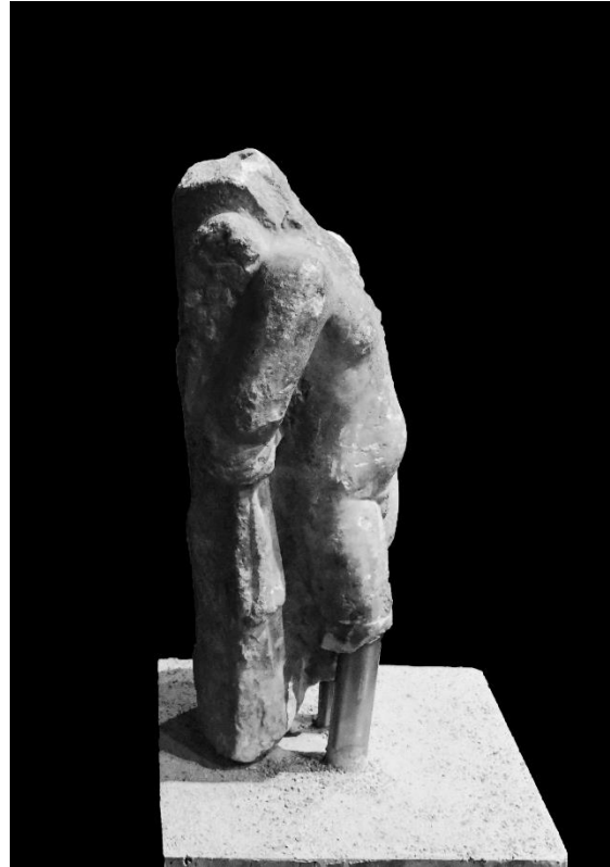
Resim 2. Sağ Profilden Görünüm. (M. Dinç)