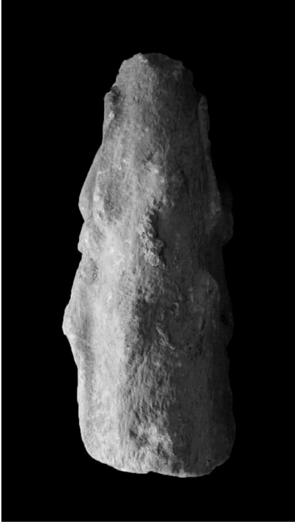
Resim 3. Arkadan Görünüm. (M. Dinç)