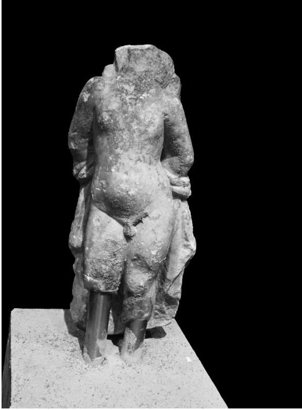
Resim 1. Eros, Ön Cepheden Görünüm. (M. Dinç)

Vorster, C. (2004). Römische Skulpturen des späten Hellenismus und der Kaiserzeit 2: Werke nach Vorlagen und Bildformeln hellenistischer Zeit sowie die Skulpturen in den Magazinen. (Vatikanische Museen. Museo Gregoriano Profano ex Lateranense. Katalog Der Skulpturen, II.) Wiesbaden: Reichert Yayınevi.