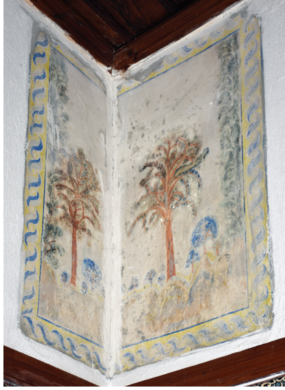
G. 11: Harim Güney Duvarı Pano 6-Doğu Duvarı Pano 1 (A. Aydın, 2020)