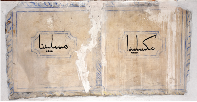
G. 15: Harim Doğu Duvarı Pano 4

Kadınlar mahfilinin olduğu alanın ahşap kemerlerinin köşeliklerinde aşağı sarkan çiçek motifleri yer alır (G. 16). Mahfil katının doğu ve batı duvarında ikişer adet dik-dörtgen boş pano vardır. Harimin kuzey duvarında ise doğudan batı yöne doğru ilk pano kareye yakın dörtgen formda olup içindeki madalyonun alt yarısında yer alan süsleme programı belli belirsiz görülebilmektedir. Madalyonun üst bölümünde özgün olup olmadığı tam olarak anlayışlamayan penç motifleri vardır. Madalyon içinde ise gövdesi dama desenli gösterişli bir kalyon tasviri yer alır (G. 17). Batı yöne doğru enine dörtgen panonun sadece çerçevesinin bir kısmı günümüze ulaşmıştır.