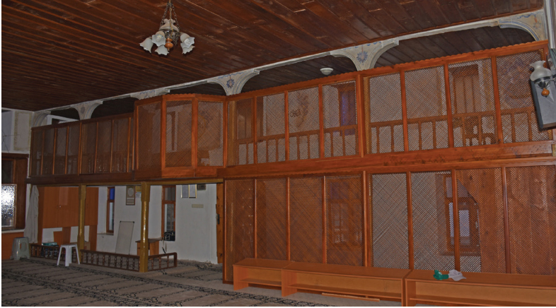
G. 16: Harim Kuzey Duvarı (A. Aydın, 2020)

Kadınlar mahfilinin olduğu alanın ahşap kemerlerinin köşeliklerinde aşağı sarkan çiçek motifleri yer alır (G. 16). Mahfil katının doğu ve batı duvarında ikişer adet dik-dörtgen boş pano vardır. Harimin kuzey duvarında ise doğudan batı yöne doğru ilk pano kareye yakın dörtgen formda olup içindeki madalyonun alt yarısında yer alan süsleme programı belli belirsiz görülebilmektedir. Madalyonun üst bölümünde özgün olup olmadığı tam olarak anlayışlamayan penç motifleri vardır. Madalyon içinde ise gövdesi dama desenli gösterişli bir kalyon tasviri yer alır (G. 17). Batı yöne doğru enine dörtgen panonun sadece çerçevesinin bir kısmı günümüze ulaşmıştır.