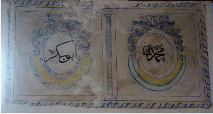
G. 8: Harim Güney Duvarı Pano 3 (A. Aydın, 2020)

Güney duvarındaki cami tasvirli panonun doğusunda yer alan enine dörtgen pano sütunla iki bölüme ayrılmıştır. Oluşan kare bölümlerdeki madalyonların alt yarısındaki süsleme bozulmuş, üst yarısındaki süslemeden soldakininki bazı yerlerinde bozulma olmasına rağmen özgün kalabilmiş, diğerinin ise onarımlarda üzerinden geçilmiştir. Sağdaki madalyonun içinde “Muhammed”, soldakinin içinde “Ebu Bekir” yazılıdır (G. 8).