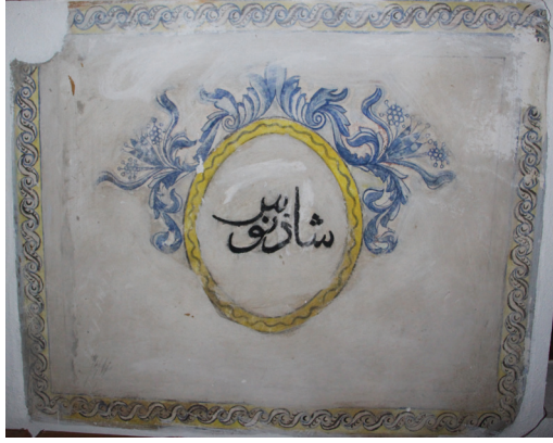
G. 19: Harim Kuzey Duvarı Pano 6

Enine dörtgen diğer panonun büyük bölümü yok olmuş sadece çerçevenin bir kısmı bugüne ulaşmıştır. Badana altından içindeki madalyonun dış hatları görülebilmektedir ve içinde “Kefeştetayuş” yazılıdır (G. 20). Duvarın batıdaki son noktasında yer alan panonun çerçevesinin büyük bölümü tahrip olmuştur. İçindeki madalyonun alt yarısındaki süsleme programı badana altında kalmış, üst yarısı yer yer bozulmalar da olsa sağlam olarak günümüze ulaşmıştır. Madalyonun içinde yelkenli bir gemi tasviri bulunmaktadır (G. 21).