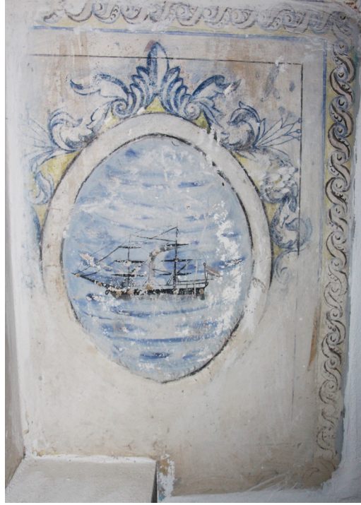
G. 21: Harim Kuzey Duvarı Pano 8 (A. Aydın, 2020)