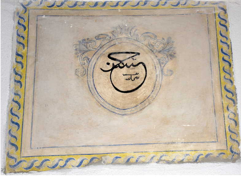
G. 13: Harim Doğu Duvarı Pano 2 (A. Aydın, 2020)

Kareye yakın dörtgen diğer pano içinde yer alan madalyonun alt yarısındaki süsleme tamamen yok olmuş, üst yarısındaki ise korunabilmiştir ve içinde “Hasan” yazılıdır (G. 13).