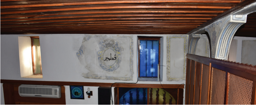
G. 3: Harim Batı Duvarında Pano 1-2 (A. Aydın, 2020)

Diğer pano alanı tamamen yok olmuştur. Duvarın güneyindeki kareye yakın panonun çerçevesinin ve içindeki madalyonun büyük bir bölümü badanalı yüzeyin altında kalmıştır (G. 4). Madalyonun üst bölümündeki bezeme kısmen de olsa görülebilmektedir. İçinde “Kim Allah için bir mescid inşa ederse Allah ona cennette köşk bina eder” hadis-i şerifi yer almaktadır. Duvardaki son pano oldukça dar dikdörtgen formudur ve içi boştur.