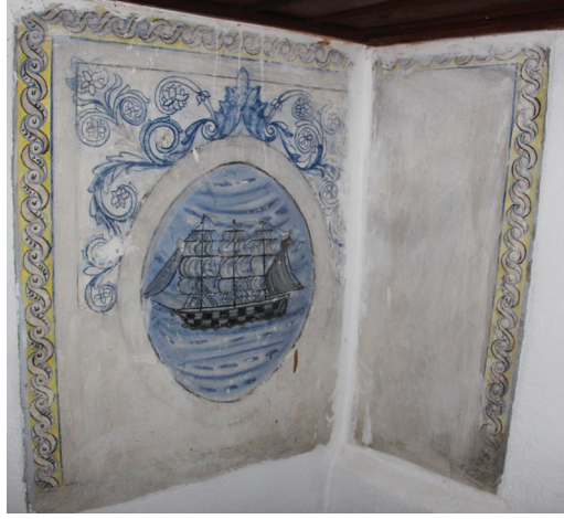
G. 17: Harim Kuzey Duvarı Pano 2-3

Kareye yakın formdaki diğer panonun çerçevesinin büyük bir bölümü badana altında kalmıştır. İçindeki madalyonun üst yarısındaki bezemenin bir kısmı iyice sikkileşmiştir, diğer bölümünün ise boya ile üzerinden geçilmiştir. Madalyonun içinde “Debernuş” yazılıdır (G. 18).