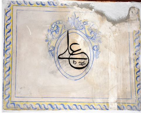
G. 10: Harim Güney Duvarı Pano 5 (A. Aydın, 2020)

Kareye yakın diğer panonun çerçevesinde badana nedeniyle bozulmalar olmuş, madalyonun üst yarısındaki süsleme yenilenmiştir, içinde “Osman” yazılıdır (G. 10).