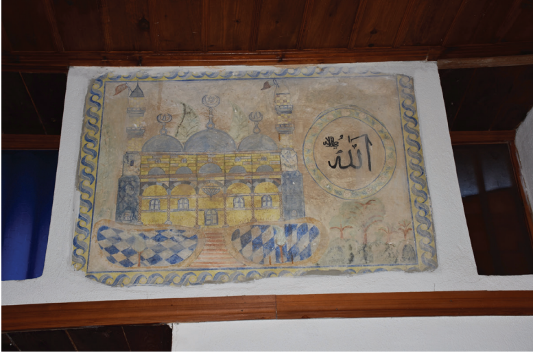
G. 7: Harim Güney Duvarı Pano 2 (A. Aydın, 2020)