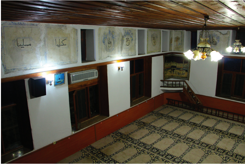
G. 12: Harim Doğu Duvarı (A. Aydın, 2020)