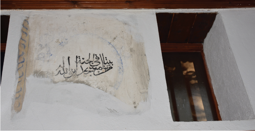
G. 4: Harim Batı Duvarında Pano 3

Diğer pano alanı tamamen yok olmuştur. Duvarın güneyindeki kareye yakın panonun çerçevesinin ve içindeki madalyonun büyük bir bölümü badanalı yüzeyin altında kalmıştır (G. 4). Madalyonun üst bölümündeki bezeme kısmen de olsa görülebilmektedir. İçinde “Kim Allah için bir mescid inşa ederse Allah ona cennette köşk bina eder” hadis-i şerifi yer almaktadır. Duvardaki son pano oldukça dar dikdörtgen formudur ve içi boştur.