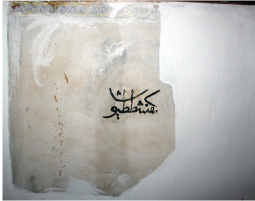
G. 20: Harim Kuzey Duvarı Pano 7 (A. Aydın, 2020)

Enine dörtgen diğer panonun büyük bölümü yok olmuş sadece çerçevenin bir kısmı bugüne ulaşmıştır. Badana altından içindeki madalyonun dış hatları görülebilmektedir ve içinde “Kefeştetayuş” yazılıdır (G. 20). Duvarın batıdaki son noktasında yer alan panonun çerçevesinin büyük bölümü tahrip olmuştur. İçindeki madalyonun alt yarısındaki süsleme programı badana altında kalmış, üst yarısı yer yer bozulmalar da olsa sağlam olarak günümüze ulaşmıştır. Madalyonun içinde yelkenli bir gemi tasviri bulunmaktadır (G. 21).