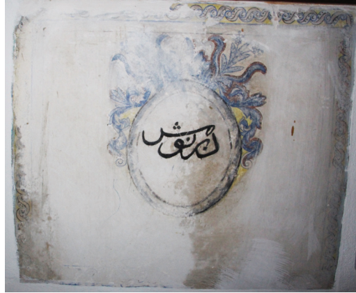
G. 18: Harim Kuzey Duvarı Pano 5 (A. Aydın, 2020)

Kareye yakın formdaki diğer panonun çerçevesinin büyük bir bölümü badana altında kalmıştır. İçindeki madalyonun üst yarısındaki bezemenin bir kısmı iyice sikkileşmiştir, diğer bölümünün ise boya ile üzerinden geçilmiştir. Madalyonun içinde “Debernuş” yazılıdır (G. 18).