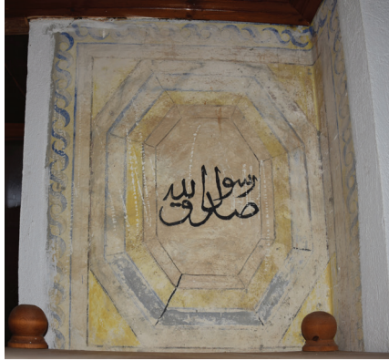
G. 6: Harim Güney Duvarı Pano 1

Diğer pano cami, selvi ve hurma ağaçlarıyla yapılmış bir kompozisyona sahiptir (G. 7). Cami tasvirinin sağ tarafında çerçeve bordürü çiçek ve yaprak motifli bir madalyon yer alır, içinde “Allah (Lafza-i Celal)” yazılıdır. Madalyonun üstündeki alanda badana altında kalmış madalyon bordüründekine benzer çiçek ve yaprak motifleri görülebilmekte, hemen altında ise farklı boyutlardaki tepelerin arasında ve üzerinde yine farklı boyutlarda dört adet hurma ağacı bulunmaktadır. Ağaçlardan soldan ikinci diğerlerine kıyasla daha büyüktür. Panodaki cami tasvirinin hemen önünde camiye ulaşan dokuz basamaklı bir merdiven kuruluşu, bunun iki yanında ise yapının yan sınırlarını da taştan kahve-sarı renkte çerçeveli beyaz ve mavi renkli baklava dilimi desene sahip avlu döşemesi yer alır. Merdivenin sağ ve solundaki döşemenin içinde üst bölümleri doğu yönüne eğilmiş birer adet selvi ağacı bulunmaktadır.