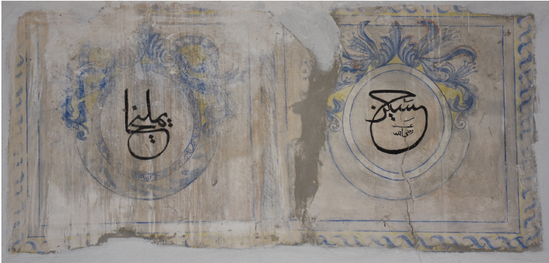
G. 14: Harim Doğu Duvarı Pano 3 (A. Aydın, 2020)

Enine dörtgen ortadaki sütunla iki bölüme ayrılan diğer panonun çerçevesi ve madalyonları yer yer bozulmakla beraber madalyonların alt ve özellikle üst yarısındaki bezeme programı görülebilmektedir. Sağdaki madalyonun içinde “Hüseyn” soldakinde ise “Yemliha” yazılıdır (G. 14).