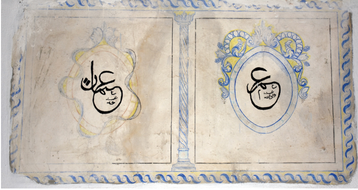
G. 9: Harim güney duvarı pano 4 (A. Aydın, 2020)

Kareye yakın diğer panonun çerçevesinde badana nedeniyle bozulmalar olmuş, madalyonun üst yarısındaki süsleme yenilenmiştir, içinde “Osman” yazılıdır (G. 10).