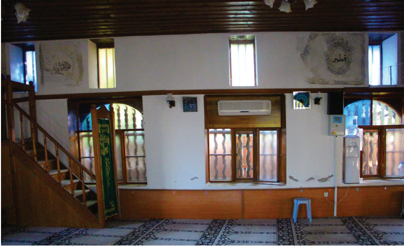
G. 2: Harim Batı Duvarı (A. Aydın, 2020)

Enine dörtgen panolar da ortak şemaya sahiptir. Her bir pano ortadan sütunla iki eşit bölüme ayrılmıştır. Kaidesi, spiral gövdesi ve korint tipi başlığıyla sütun mavi renktedir. Kareye yakın dörtgen ve enine dörtgen panoların içinde yer alan oval formlu madalyonların alt yarısındaki perde motifi hepsinde ortak bir özelliktir. Özgünde sarı zemin üzerine mavi eğimli çizgilerle yapılmıştır ancak çoğu madalyonda bu bölüm tahrip olmuştur. Madalyonların üst yarısındaki süsleme programı ise iki ana gruba ayrılır: Bunlardan birinci ana grupta madalyonun tepe noktasındaki büyük bir akant motifi ortaktır. Bu grubun ilk alt grubunda akant motifinden iki yana gelişen C ve S kıvrımlı dolamadallar arasında tomurcuklar yer alır. Bu özellikteki madalyonlar batı duvarı pano 3, doğu duvarı pano 2-3, güney duvarı pano 4, kuzey duvarı pano 3.5-8'de bulunmaktadır. İkinci alt grupta madalyonun tepe noktasındaki büyük akantın iki yanında içi yuvarlak şekillerle dolgulı yarım daire formulu motif ile C ve S kıvrımlı dolamadallar arasında tomurcuklar vardır. Bu özellikteki madalyonlar ise doğu duvarı pano 3, güney duvarı pano 4-5'tedir. İkinci ana grupta madalyonun tepe noktasında volütlerden oluşan taç benzeri bir motif bulunur. Bu motiften iki yana gelişen C ve S kıvrımlı dolamadallar arasında tomurcuklar vardır. Bu grubun örnekleri batı duvarı pano 2 (sağdaki madalyon) ve güney duvarı pano 3'te görülmektedir.