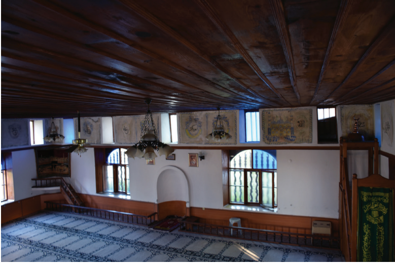
G. 5: Harim Güney Duvarı (A. Aydın, 2020)