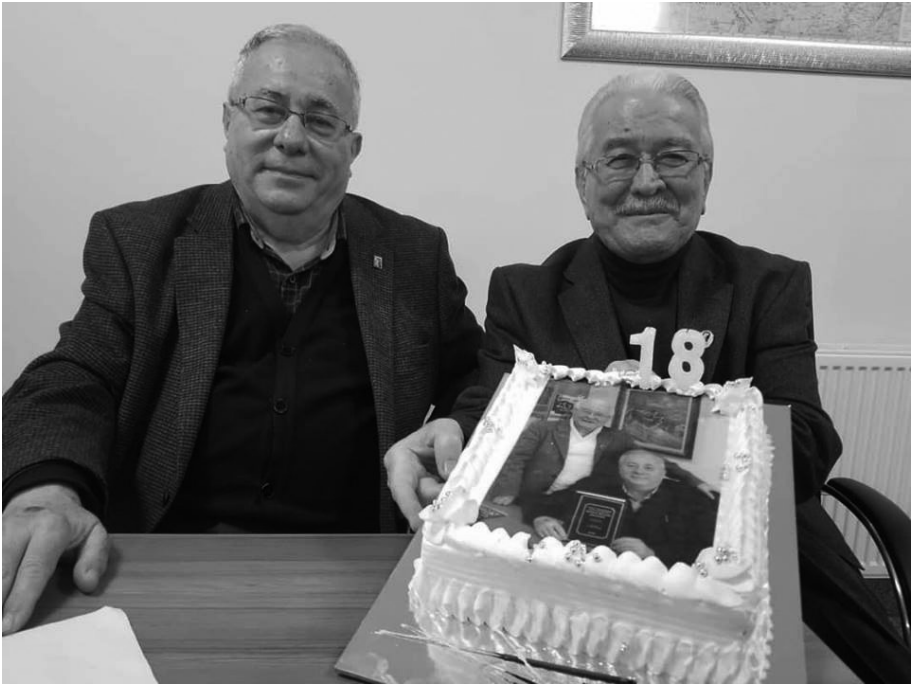
80 Bitti 18 Oldum.... (30 Ocak 2019)