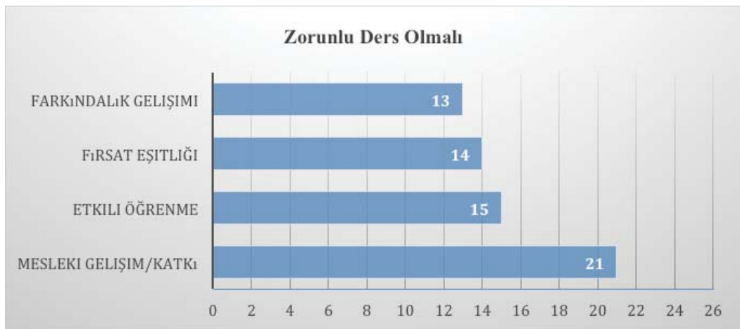
Şekil 3. Zorunlu Ders Olmasını İsteyen Katılımcıların Frekansları

Dersin programda zorunlu olarak yer alması gerektiği görüşünü dile getiren katılımcıların(23K:%92) ise bu gerekçelerinin dört ana başlık halinde toplanabileceği düşünülmektedir. Bu başlıklar frekans sırasına(sıklığı çok olandan az olana)göre mesleki gelişim/katkı, etkili öğrenme, fırsat eşitliği, farkındalık gelişimi şeklindedir(Şekil 3).