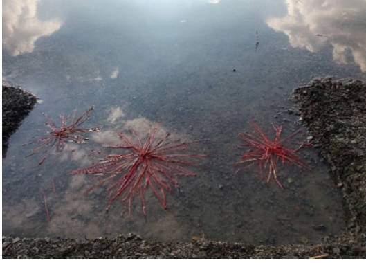
Görsel 10. "Saklı Yaşam", yaprak sapları, yaklaşık 100x150 cm.

Amerikan çevre hareketinin kurucusu olan Rachel Carson'un 'Sessiz Bahar' adlı kitabını anımsatır: "...kitabına duygulara hitap eden ölüm tasavvuruyla başlar: kuşların ölümü, kuş ötüşleri olmayan sessiz bahar" (Radkau, 2017, s.462). Arka planda yükselen beton binaların silüetleri ve ön planda kuş formunu çağrıştıran imgenin masalimsi etkisiyle yaratılan çarpıcı gerilim, doğal hayatın insan eliyle yok edilmesine ilişkin çelişki; sosyoekonomik, sosyopolitik, sosyopsikolojik, eko-estetik ve ruh sağlığı gibi düşünceleri çağrıştıran farklı okumalara neden olmakta ve çok katmanlı çağrışım zenginliği çalışmanın etkisini ve amaca uygunluğunu güçlendirmektedir.