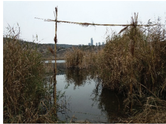
Görsel 16. "Davetsiz Misafir", 200x150 cm

Görsel 16'da göl kenarında kendiliğinden var olan sazlıktan faydalanılmıştır. Sazların kurumuş olanlarından seçilen iki parçası yaklaşık bir buçuk metre aralıkla suya saplanmış ve üzerine yatay bir kamış eklenerek kapı ya da pencereyi andıran bir biçim yapılmıştır. Köşeler birbirine ayrıık otları bir araya getirilerek tutturulmuştur. Katılımcı bu çalışması ile Eymir Göl'ünün 'kendi doğallığında kalması gerektiğini ve dışarıdan müdahaleler olmasın diyebilmeyi amaçladığını' belirtmiştir. "Davetsiz Misafir" adı ile 'unutulmuş değerlerin ve sade zevklerin yeniden yaratımında' en temel kaynak olan 'doğanın ve doğalın düşüncesine karşı endüstriyel yapaylığın neden olduğu bozulmaya bir serzeniş' olarak değerlendirilmesini istemiştir.