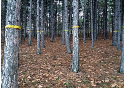
Görsel 12. Yapraklarla işaretlenmiş ağaçlar.