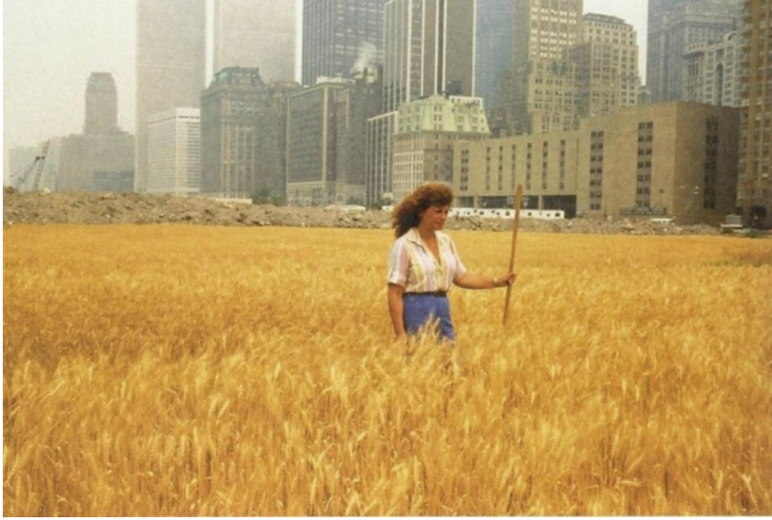
Görsel 4. Agnes Denes, 'Buğday Tarlası- Bir Yüzleşme' Manhattan, 1982