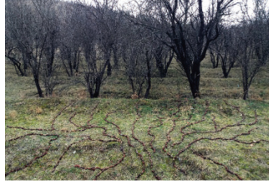
Görsel 20. "Yaşama Tutkusu", çam kozalakları

Görsel 18'de göl kıyısında doğal olarak bulunan sazlıktaki kurumuş sazların parçaları eşit uzunlukta kesilerek sonsuzluk işareti yapılmıştır. İnsan ile doğanın ilişkisinin sonlu-sonsuz oluşunu sorgulatmaktadır. Doğa sonsuz mudur? İnsanın doğa üzerindeki egemenliği sonsuza kadar sürdürülebilir mi? İnsan doğa ile olan savaşında gelinen noktada kentleşme ile ilişkisinin sonuçlarıyla baş edilebilecek midir? Sonsuzluk işaretinin bu sorular ve sorunlar üzerine düşünceleri harekete geçirerek çoğaltan bir etkisi vardır. İnsanın doğa ile ilişkisi sürekli bir arayış, bir keşif yolculuğu gibidir. Görsel 19 bu arayışı ve keşfetme arzusunu simgeleyen bir çalışma olarak değerlendirilebilir. Kurumuş yaprakların bulunduğu toprak zeminin açığa çıkarılarak geniş ve koyu bir çizgi gibi ormanın