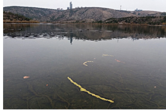
Görsel 9. "Ölü Kuşlar Anısına", Sararmış ağaç yaprakları

Çalışmalar sırasında öğrencilerin kendileriyle baş başa kalarak doğayı faydacı yaklaşımdan uzaklaşarak görmeleri sıklıkla belirtilmiş olup doğayla doğrudan temasın önemi vurgulanmıştır. Kullanacakları doğal nesnelere yapacakları işlerin hem konusu hem de gereci olarak bakmaları sağlanmaya çalışılmıştır.