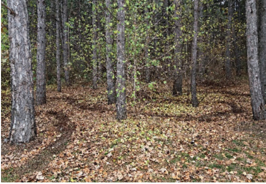
Görsel 19. "Arayış...", 7-8 m.