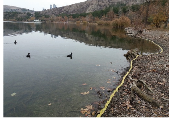
Görsel 11. "Yaprak Ve Suyun Dansı", Yapraklar, Uzunluk 5-6 metre.

Sararmış yaprakların birbirine eklenmesiyle oluşturulan ve yaklaşık 5-6 metre uzunluğundaki