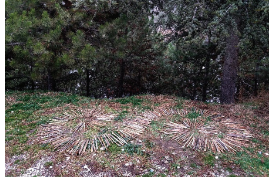
Görsel 18. "Yaşam Sarmalı", 150x80 cm.