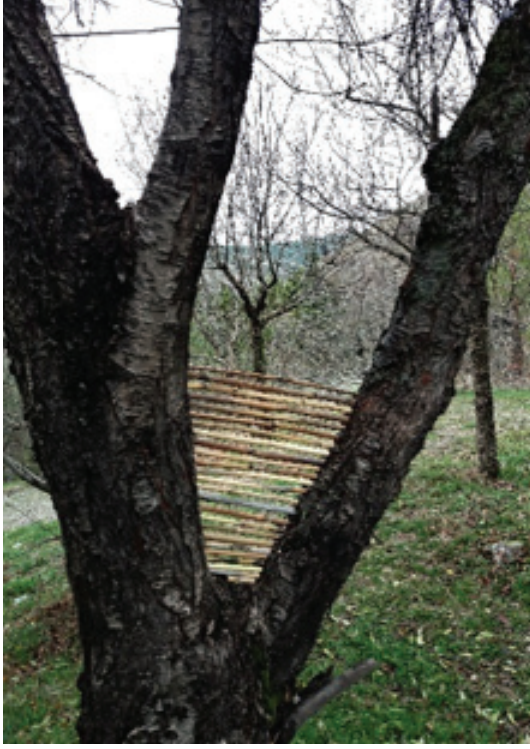
Görsel 21. "Sessiz Ritim..."

Görsel 21, doğanın ritmi, uyumu, dengesi üzerine gözlemlerden esinlenerek yapılmış bir çalışmadır. Göl kıyısında bulunan kurumuş sazlık dalları kısıdan uzuna doğru yaklaşık 1-2 santimetre aralıklarla üst üste sıralanarak bir ağacın gövdesinden ikiye ayrılan dalların arasına özenle yerleştirilmiştir. Doğanın düzeni ile sanatın düzeni arasındaki ilişkiden yararlanılarak gerçekleştirilmiş görsel etkisi güçlü çalışmalardan biridir.