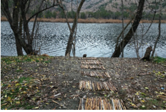
Görsel 17. "Geçit", 300x50 cm.