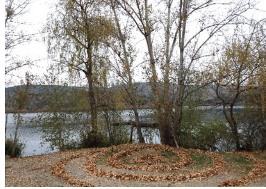
Görsel 15. "Döngü", Kurumuş yapraklar, Çap 300 cm.

Görsel 15, iki katılımcının birlikte oluşturduğu bir çalışmadır. Ağaçlar, göl ve arka plandaki tepelerin görülebildiği bir alanda düzenlenmiş olması çalışmanın amacını ve etkisini dikkat çekici hale getirmiştir. Kurumuş yaprakların içten dışa genişleyen spiral şekilde düzenlenmesiyle doğanın döngüsüne işaret ettiği söylenebilir.