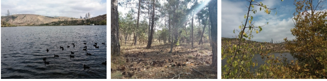
Görsel 5. 6. 7. Eymir Gölü, Keşif Gezisinden, 2018

sanat ve toplum ilişkileri konularında bilgi paylaşımları yapılmıştır. Sanat yapıtları aracılığı ile kent yaşamı-çevre-teknoloji-doğa ve sanat üzerine sorgulamalarla çevre bilinci uyarılmaya çalışılmıştır.