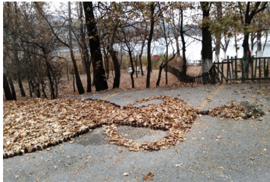
Görsel 14. "Doğa Ana", Yaprak, Kozalak

"...bitmek bilmeyen, insanı tüketen trafikten başka bir şey yoktur ortada (sırf insanlar kapitalist özgürlük içinde bir şey yapabilsinler diye depolanmış haldeki muazzam miktardaki güneş ışığı atıl momentuma dönüştürülür).