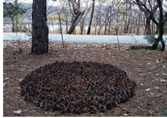
Görsel 13. "Şölen", Çam kozalakları, Çap 200 cm.

oluşturulan kuşakların ağacın gövdelerine yerleştirildiği görülmektedir. Ormancıların kesilecek ağaçları işaretlemelerini andıran bu çalışma, görsel etkisinin yanı sıra böyle bir işaretlemeyle 'ağaçlar ölürse insanlar ölür' sözünü çağrıştırmaya da ağaçların, ormanın doğal yaşam türlerinin de tehlike altında olduğuna bir gönderme olarak okunabilir. Görsel 13 ise çam kozalaklarının içten dışa doğru arka arkaya bir düzen içinde aralıksız sıralanmasıyla oluşturulmuştur. Kuru çam kozalaklarının toprak üzerindeki etkisi; yağmurun, rüzgarın aşındırmasıyla değişerek kahverenginin çok sayıda tonuna dönüşen zenginliği ile çevresinin oluşturduğu plastik ilişki gözde hoş bir renk tonlaması etkisi bırakmaktadır.