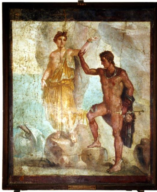
G.2 Napoli Milli Müze'de saklanan Pompei buluntusu Andromeda ve Perseus resmi

Nikias, Praksiteles'in çağdaşı olup, onun bazı heykellerinin de resmini yapmıştır. Plinius, Nikias'tan söz ederken ışık ve gölge oyunlarına özel bir titizlik gösterdiğini ve figürleri resim yüzeyinden dışarı taşar gibi yaptığını anlatarak övmektedir 39 . Hellen büyük resimlerinin bazılarını -heykel sanatında olduğu gibi- Roma dönemi kopyalarından tanımaktayız. Onlardan bir tanesi Napoli Milli Müzesi'nde saklanan Pompei buluntusu Andromeda ve Perseus resmi (G.2) olasılıkla Nikias'tan kopya edilmiştir 40 . Resimde Perseus deniz canavarını öldürmüş ve Andromeda'yı kayalıklara bağlandığı zincirden kurtarmak üzeridir. Andromeda'nın hala zincirli olan sol kolu yukarıdadır. Perseus ise sağ elini Andromeda'ya uzatmıştır. Sağ elinde tuttuğu kılıcına Medusa'nın yılan saçları dolanmış durumdadır.