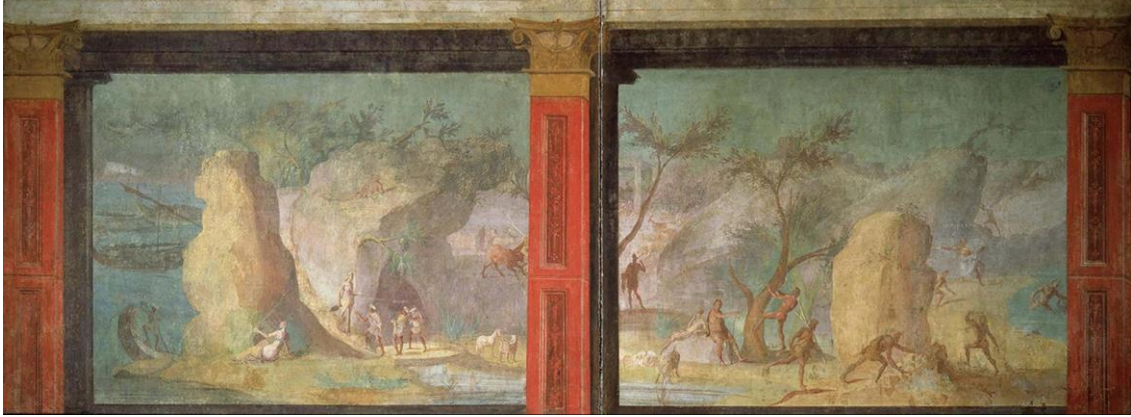
G.4 Vatikan Müzesi'nde korunan Odysseus resimleri.

( http://m.museivaticani.va/content/museivaticani-mobile/en/collezioni/musei/sala-delle-nozze-aldobrandine/ciclo-con-scene-dell-odissea-da-via-graziosa.html#&gid=1&pid=1 )