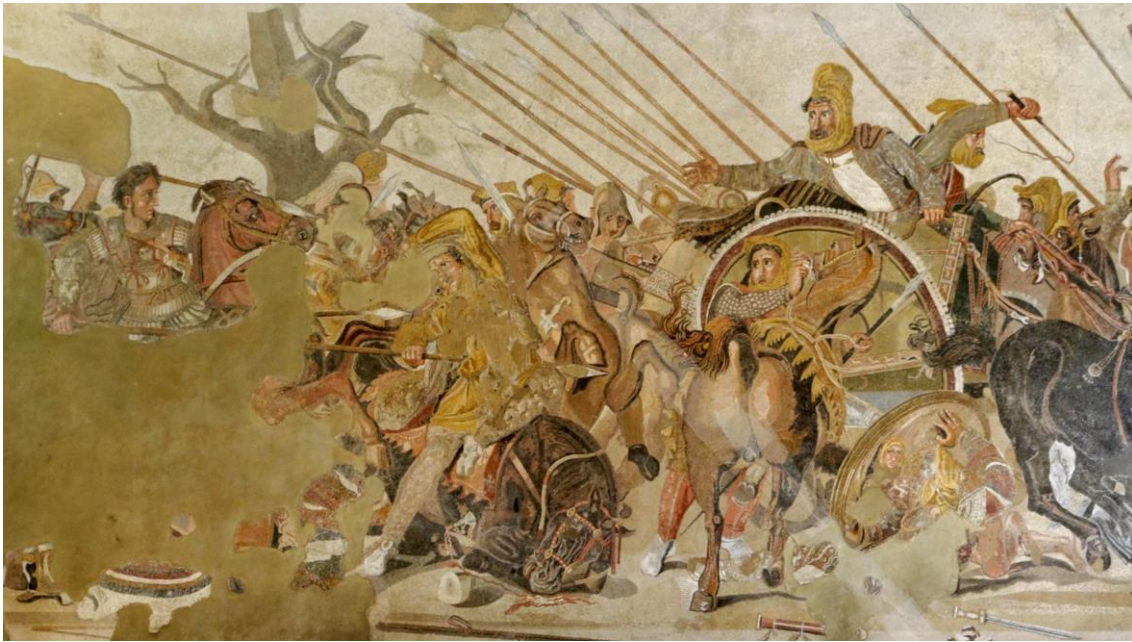
G.3 Napoli Milli Müze’de sergilenen, Büyük İskender ile Darius’un İssos savaşını tasvir eden Pompei buluntusu İskender Mozaïği.

Yine Napoli Milli Müze’de sergilenen ve Büyük İskender ile Dareios’un İssos savaşını tasvir eden İskender Mozaïği de Eretreialı Philoksenos’a ait bir resim örnek alınarak yapılmıştır 41 (G.3). M.Ö. 2. Yüzyıla tarihlenen mozaïğin orijinal resmi Makedonia Kralı Kassandros tarafından M.Ö. 317/316’da yaptırılmıştır. 42 Resmin solunda Büyük İskender atının üzerinde Persli düşmanlarına karşı saldırır durumdadır. Pers ordusu yenilgiye uğramış sahnenin sol tarafında Dareios arabası içinde savaş alanından hızla uzaklaşmaktadır. Yüzünde yenilmiş olmanın verdiği korku ve endişe belirgin bir şekilde görülmektedir.