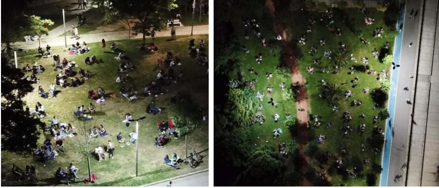
Şekil 2 Sokağa Çıkma Kısıtlamasının Olmadığı 14 Haziran Haftasonu Kamusal Alan Olarak Kullanılan Maçka Parkı ve Caddebostan Sahili

Yapılan görüşmelerde aktif kullanılan alanlar, Maçka Parkı, Maltepe Sahil, Caddebostan Sahil, Florya Sahili ve Moda olarak ortaya çıkmıştır İstanbul içerisinde kamusal mekân olarak bellekte yer eden yerlerin hep aynı alanlar olması, yalnızca mekân kısıtlılığı ile ilişkili değildir. Aynı zamanda, bu alanların kullanıcıları tarafından tercih edildiğini, benimsendiğini kanıtlar niteliktedir.