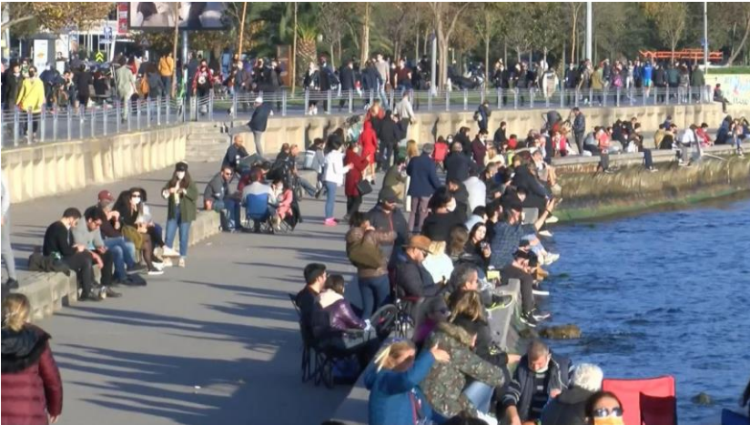
Şekil 2 Sokağa Çıkma Kısıtlamasının Olmadığı 28 Kasım 2020 Tarihinde Kamusal Alan Olarak Kullanılan Caddebostan Sahili (Cumhuriyet Gazetesi, 2020)

Kamusal mekânların hem sayıca az, hem de imkânlarının kısıtlı olması mahalle arası açık alanların kalabalık ve iç içe olmasına sebep olmuştur. Pandemi süreci öncesinde kalabalık mekânlarda bulunmak cazip olarak nitelendiriliyorken yaşanan küresel salgın ile birlikte kısıtlamaların olmadığı zaman aralığında vakit geçirmek için en sakin yerler tercih edilmektedir. Tüm görüşmeciler tarafından ortak olarak kalabalık mekânların daha az tercih edildiği, daha çok 'kimsenin olmadığı' alanlar bulmaya çalışıldığı belirtilmiştir. Ancak İstanbul gibi bir kentte hem sakin hem merkezi olan alanların sayısının yetersiz olması, sakin olduğu için tercih edilen zaman içerisinde kalabalık alanlara dönüşmesine sebep olmuştur.