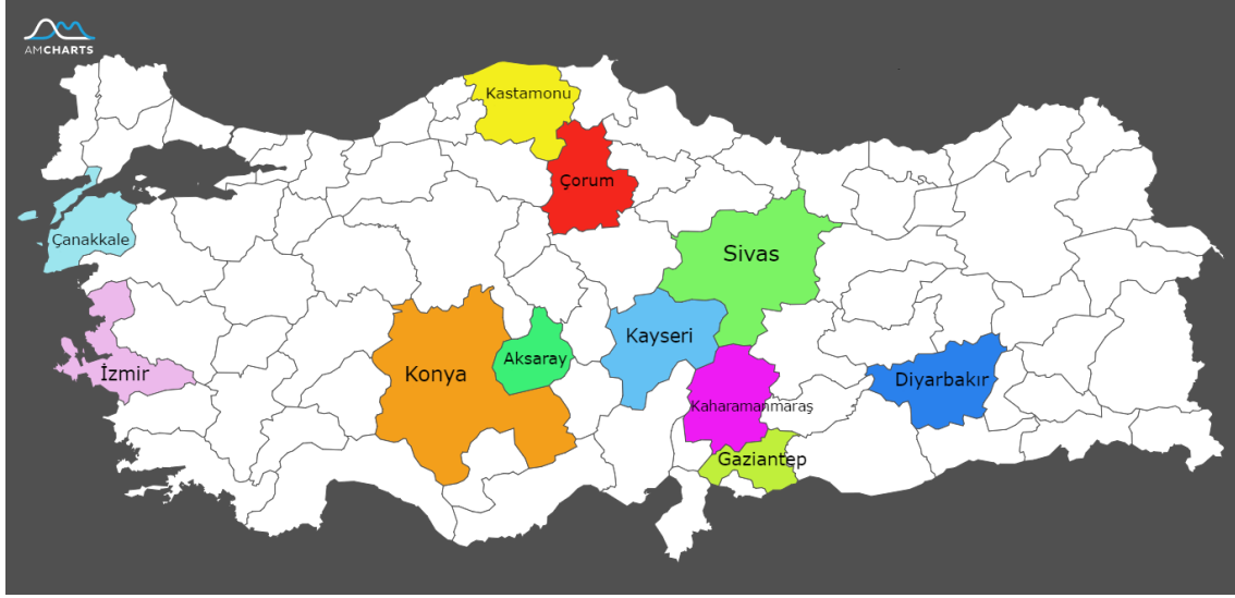
Harita 169 : Çivi Yazılı ve Hiyeroglifli Madeni Eserlerin Bulunduğu İller