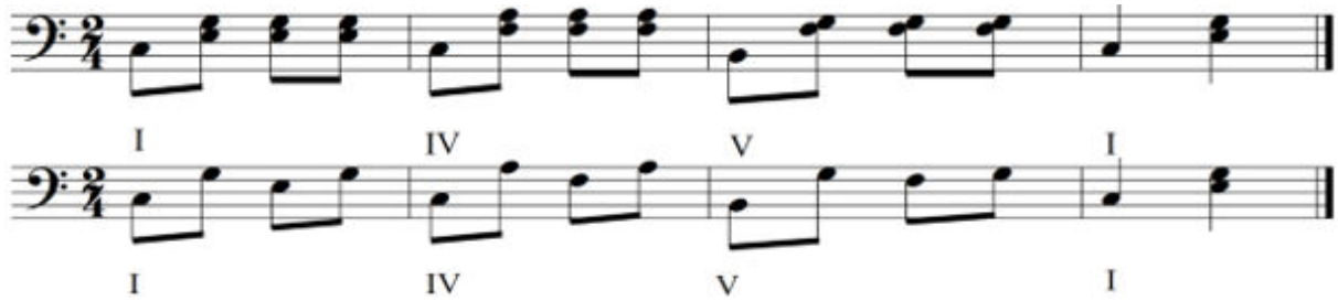
2/4'lük Yapı Örnekleri