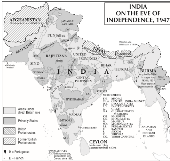
Harita 1: Bölünme Öncesi Hindistan 24

İngilizlerin alt kıtadan çekilme kuralları Britanya Hindistanı'nın son genel valisi olan Louis Mountbatten tarafından 3 Haziran 1947'de yayınlamıştır. Mountbatten Planı olarak bilinen kurallar uyarınca Hint Alt Kıtası 15 Ağustos 1947'de bağımsız olmuştur. Ancak 1947 Hindistan Bağımsızlık Yasası Britanya Hindistanı'nı Hindistan ve Pakistan olmak üzere iki bağımsız ülkeye bölmüştür. Bununla beraber Punjab ile Bengal bölgeleri de Doğu ve Batı olmak üzere ikiye bölünmüştür. Ayrıca Bağımsızlık Yasası'nın hükümlerince Britanya Hindistanı'nın dolaylı yönetiminde bulunan diğer prens devletlerin yöneticilerine Hindistan'a veya Pakistan'a katılma seçeneği verilmekle birlikte bu devletler kendi haline bırakılmış, diğer deyişle bağımsız kalmışlardır. 21 Bu devletlerin Hindistan veya Pakistan'a katılmaları durumunda Mountbatten Planı'nda bazı yol gösterici ilkeler önerilmiş ve yöneticilere devletlerinin coğrafi konumunu ve halkın isteklerini göz önünde bulundurarak katılım kararını vermeleri tavsiye edilmiştir. 22 Alt Kıta'daki bölünme ve coğrafi sınırlar din temelinde çizilmiş; Sind, Belucistan ve Kuzey Batı Sınır bölgelerinin yanı sıra Punjab ve Bengal'in Müslüman çoğunluklu toprakları Pakistan'da, Britanya Hindistanı'nın geri kalan bölümleri ise Hindistan'da kalmıştır. 23