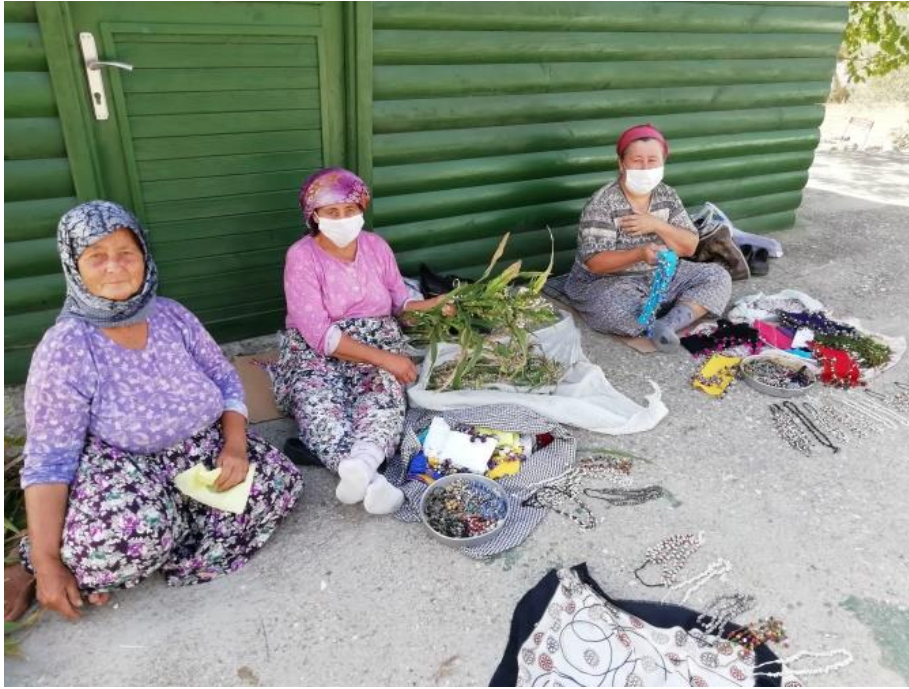
Fotoğraf 2: Kapıkırı Köyü Kadınlarının Üzerlik Otu Tohumundan Yaptıkları El İş Ürünler

Bafa Gölü kıyısında yer alan Kapıkırı köyü Milâs ilçesinin kırsal turizm kapsamında ele alınabilecek diğer bir köyünü teşkil etmektedir. Köy, ilçe merkezine 39, il merkezine 108 km mesafede Herakleia antik kenti üzerine kurulmuştur. Bir yanda gölün oluşturduğu doğal ortam, diğer taraftan iç içe olduğu Herakleia antik kenti kalıntıları köyün önemli turizm unsurları olarak belirlemektedir. Herakleia antik kenti yapıları arasında yer alan Athena tapınağı, kaya mezarları, agora ve şehir surları ile gölün içinde bulunan adalarda yer alan ve Bizans döneminden kalma bir manastıra ait olan harabeler turistlerin ilgi gösterdikleri turizm çekicilikleri niteliğindedir. Köyü ziyaret edenler tekne turuyla Bafa Gölü üzerindeki bu adaları daha yakından görebilmekte, göl kenarında ve dağlık kesimlerde doğa yürüyüşü yapabilmekte, köyde yaşayan kadınların yaptıkları el işlerinden satın alabilmektedir (Öksüz, 2017). Gelen ziyaretçilere konaklama imkânı da sunan köyde yedi adet köy pansiyonu bulunmakta, ayrıca yeme içme ihtiyaçlarını karşılamaya yönelik göl kıyısında kafe ve restoranlar yer almaktadır. Köy kadınları üzerlik otu tohumundan yaptıkları kolye ve bilekliklerin yanı sıra işledikleri eşarp ve çeşitli el işi ürünlerini ziyaretçilere satarak ev ekonomilerine katkı sağlamaktadırlar (Fotoğraf 2). Özellikle yaz sezonunda büyük ölçekte turist ziyaretine sahne olan köyde aşırı bir yoğunluk yaşanmaktadır.