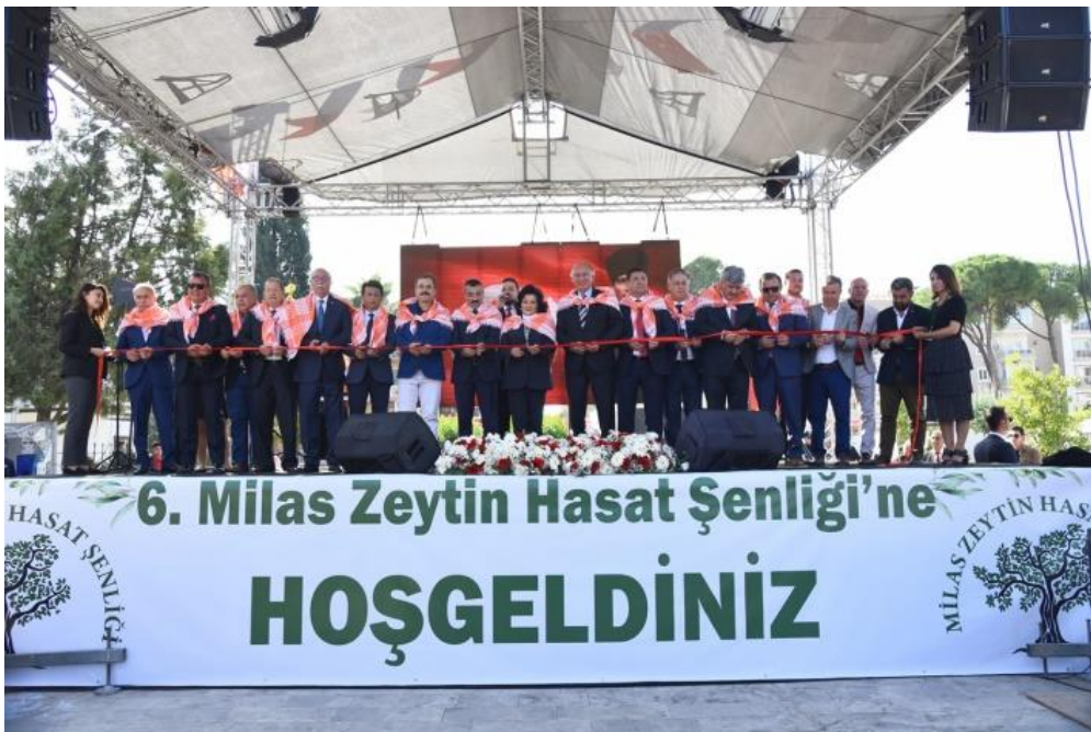
Fotoğraf 1: 2019 Yılında Gerçekleştirilen 6. Milas Zeytin Şenliği Açılış Töreni (Muğla Eko Haber, 2019)

Hasat şenliği, Milas zeytininin ve zeytinyağının ulusal ve uluslararası düzeyde tanıtılmasına imkân sağlamakta, bu sayede tüketiciler kaliteli ve soğuk sıkım zeytinyağının önemi, çiftçiler de doğru hasat yapma yöntemleri, makineli hasat, organik zeytincilik, doğru taşıma kapları ve iyi tarım uygulamaları konularında bilinçlenmekte ve bilgilendirilmektedir. Ayrıca, şenlik kapsamında gerçekleştirilen yemek yarışmaları, kültürel değerlerin korunmasına ve gelecek nesillere aktarılmasına katkı sağlamaktadır (Çukur ve Kızılaslan, 2018). Milas zeytinyağının, 23 Aralık 2020 tarihinde Avrupa Birliği'nden coğrafi işaret alan ilk ve tek Türk zeytinyağı olması onu ayrıcalıklı kılan bir özellik olmuştur.