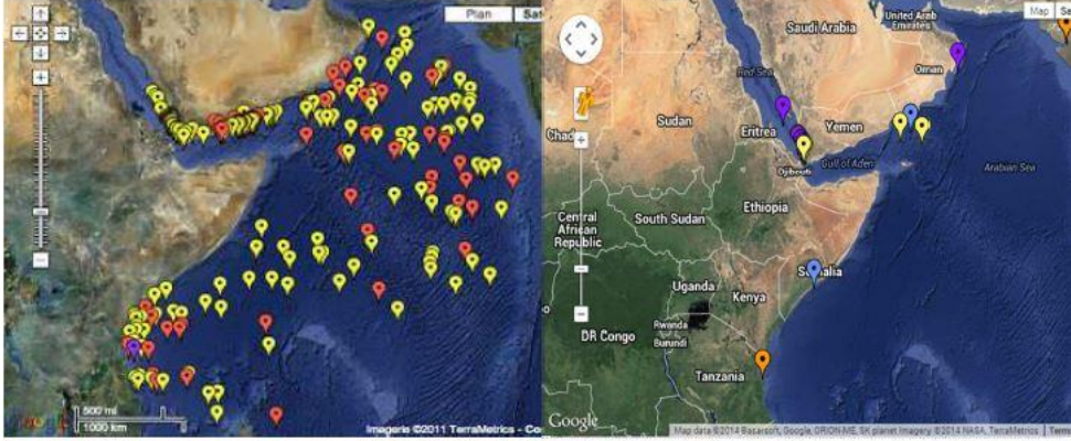
Şekil 2: 2010 ve 2014 Yılları Aden Körfezi ve Çevresindeki Korsan Faaliyetleri Karşılaştırması