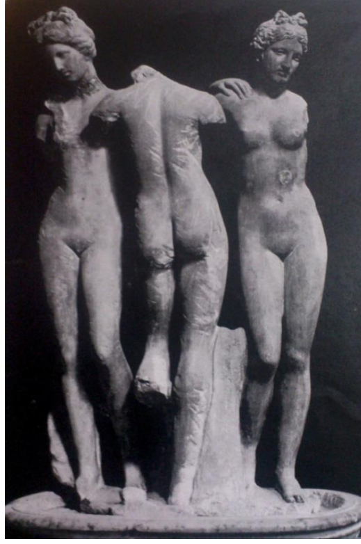
Resim 1 Siena Kharitleri (Schwarzenberg 1966: Tafel 8).