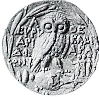
Resim 7 : Atina Tetradrahmisi (MÖ 154/3) (E. B. Harrison 1986a: Pl. 153 Charis 26).