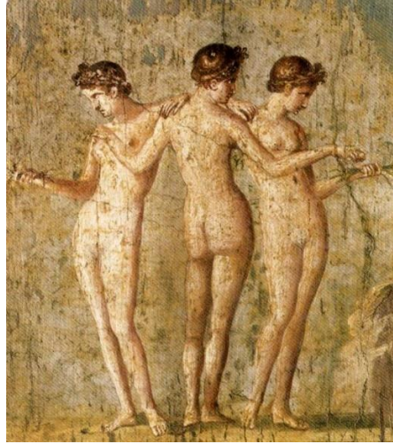
Resim 2 : Pompeii'deki Casa di Titus Dentatus Panthera'daki Üç Güzeller (İşman 2014: Fig. 6).