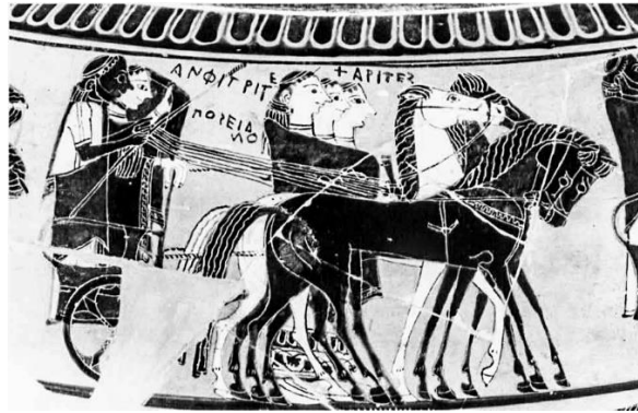
Resim 4 : Sophilos'un Dinosu ve Kharitler (MÖ 580 civarı), Londra British Müzesi (Williams 1983: Fig. 30).