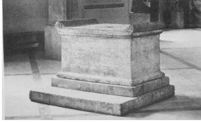
Resim 6 : Aphrodite Hegemone, Demos ve Kharitler Sunağı (Travlos 1980: 81, Fig.4).