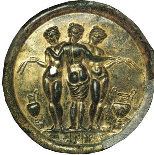
Resim 8 : Bronz Ayna (MS 2. yüzyıl). New York Metropolitan Sanat Müzesi (Milleker 1986: 6,7 .Fig. 1).