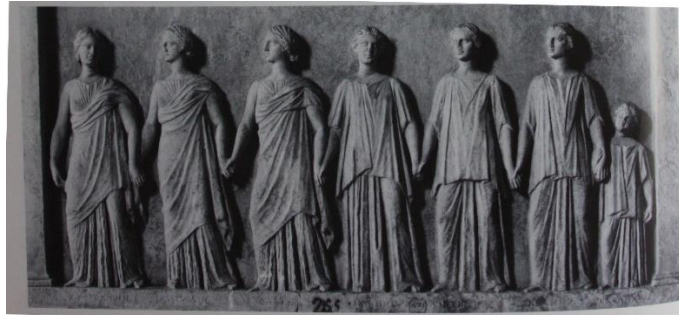
Resim 5 : Nympheler ve Kharitler Kabartması ( MÖ 3. yüzyıl) (E. B. Harrison 1986b: Pl. 156 Charis 41).