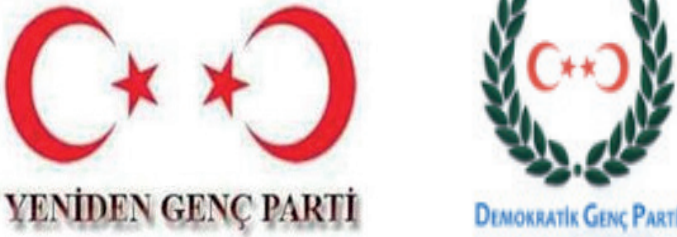
Şekil-2: Yeniden Genç Parti ve Demokratik Genç Parti Amblemleri 59