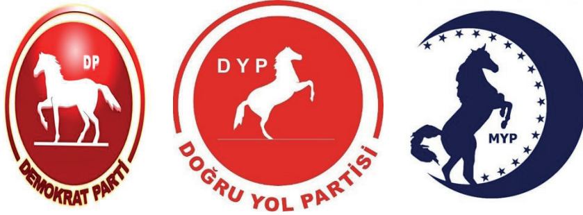
Şekil-4: Anayasa Mahkemesi kararından önce Demokrat Parti, Doğruyol Partisi ve Muhafazakar Yükseliş Partisi Amblemleri 65

Demokrat Parti daha önceden Doğru Yol Partisi'nin amblemi ile ilgili Yargıtay Cumhuriyet Başsavcılığı'na başvurmasına ve Ankara 23. Asliye Hukuk Mahkemesi nezdinde elatmanın önlenmesi davası açmasına rağmen 66 “kırat” motifinin aynı olmasının iltibas teşkil etmediği gerekçesiyle başvuru ve dava reddedilmiştir.