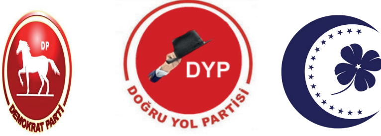
Şekil-5: Anayasa Mahkemesi'nin terkin kararından sonra Demokrat Parti, Doğru Yol Partisi ve Muhafazakar Yükseliş Partisi Amblemleri 67

siyasi parti özgürlüğünün özü ile çeliştiğine işaret etmelerine rağmen, çoğunluk görüşü aksi yönde olmuştur. Anayasa Mahkemesi bu kararıyla simgesel önemi olan motif ve figürlerin özünü kullanma hakkının sadece siyasi parti siciline daha önce kayıtlı olan siyasi partiye ait olduğunu içtihat etmiştir.