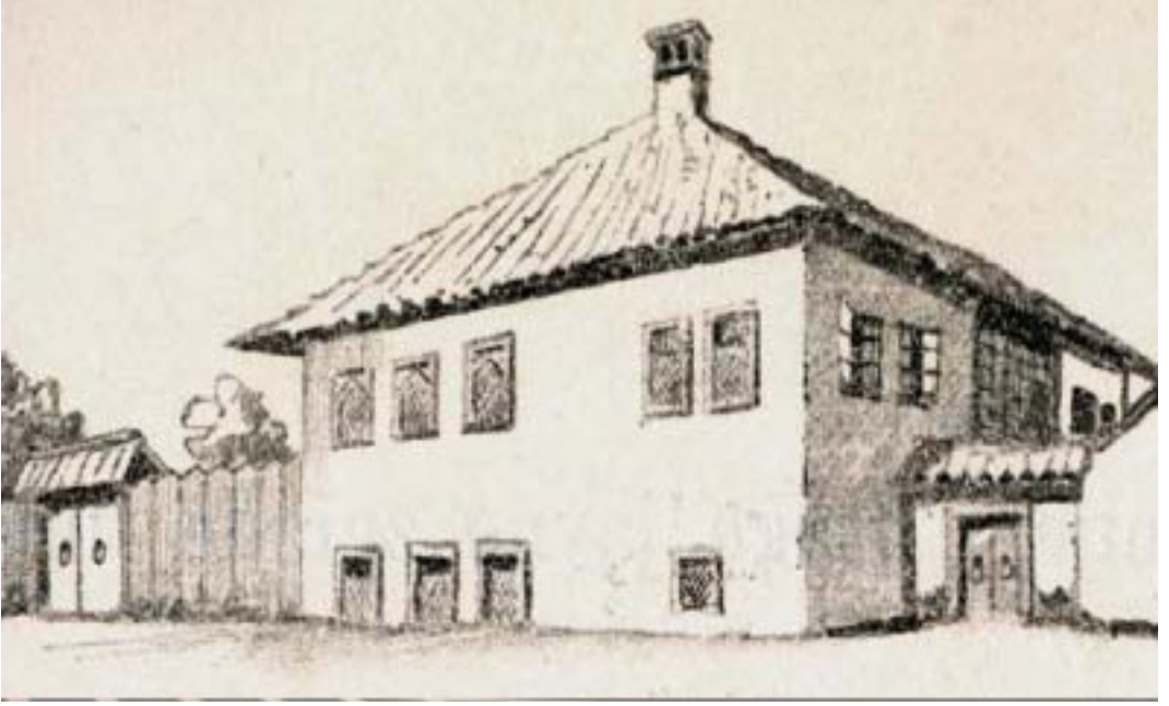
Resim 1. İskender Paşa Tekkesi