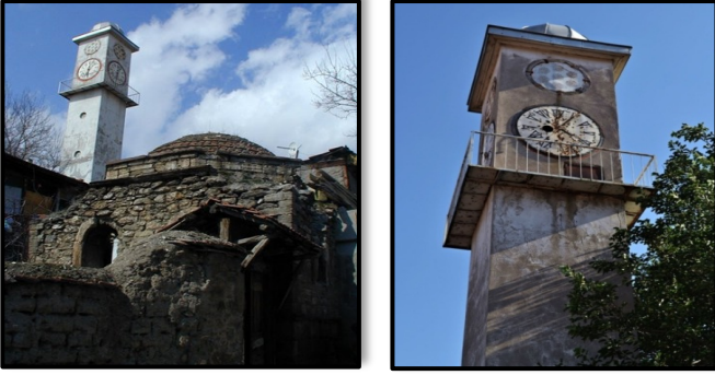
Şekil 6. Saat Kulesi (Çankırı İl Kültür ve Turizm Müdürlüğü, 2019c)