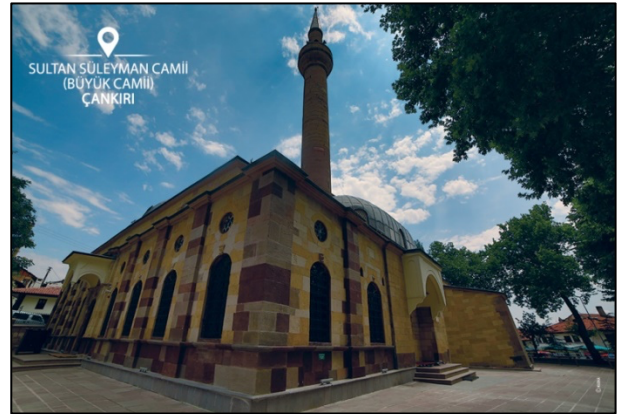
Şekil 5. Sultan Süleyman Camii (Türkiye Kültür Portalı, 2021c)

Osmanlı Sultanı Kanuni Sultan Süleyman'ın emriyle Mimar Sinan'ın yetiştirdiği Sadık Kalfa tarafından yapılan cami, 1558 yılında ibadete açılmıştır. Merkez ilçede bulunan ve kare planlı olan Cami'nin üzerinde, ortada büyük tam kubbe ile bu kubbenin dört tarafında yarım kubbeler bulunmaktadır. Duvarları ve minaresi kesme taş, kubbe üstleri kurşun kaplıdır (Çankırı Valiliği, 2019b) (Şekil 5).