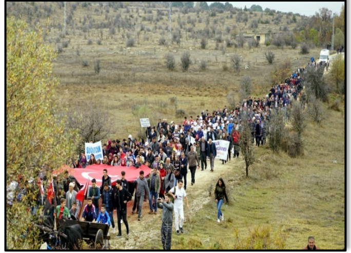
Şekil 12. İstiklal yolu yürüyüşü (İstiklal Yolu Derneği, 2019b)

Mustafa Kemal, "Gözüm Sakarya'da, Dumlupınar'da; Kulağım İnebolu'da" şeklinde bahsetmiştir (İstiklal Yolu Derneği, 2019a).