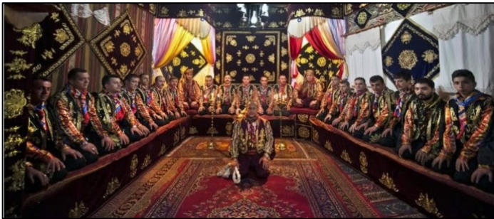
Şekil 14. Yaran Meclisi (Anonim, 2014)

Yaran; Türk örf, adet ve gelenekleri ile İslam, ahlak ve faziletinin bütünleşmesi sonucu meydana gelen ve ahilğin temel prensipleri olan kaliteli üretim, hilesiz satış felsefesi bağlamında esnaf yetiştiren ve Oğuzlardan günümüze kadar yaşatılan milli kültür mirasıdır. Kış döneminde yakılan ocaklarla varlığını sürdüren Yaran geleneği gönüllülük esasına dayanmaktadır. Kendine özgü olarak örgütlenmiş, üyelerinin kendi dilekleri ile katıldığı sürekli bir topluluktur. Yüz yüze, kendi ihtiyaçlarını giderici, geleneğin yaşatılması için çabalayan yaran elemanları ilgi birliği, toplumsallaşma ve inançların pekiştirilmesi özelliklerinin gelişmesine katkıda bulunmaktadır (Çankırı Valiliği, 2019h) (Şekil 14).