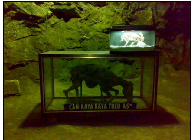
Şekil 13. Çankırı Tuz mağarasından bir görüntü (Orijinal, 2013)

Merkez ilçeye 19 km. mesafede bulunan ve Hititler Döneminden beri işletildiği tahmin edilen tuz yatakları Türkiye'nin en büyük kaya tuzu rezervine sahiptir (Anonim, 2019b). Tuz elde etmek için açılan oyuklardan oluşan ve içerisinde kamyonların dolaştığı mağara oldukça görkemlidir. Bazı bölümlerinde tuz sarkıt ve diktlerinin bulunduğu mağarada üretilen kaya tuzu Çankırı'da bulunan tuz fabrikalarında işlenmekte ve ülke genelinde sofrta ve sanayi tuzu olarak pazarlanmaktadır. Bugün hala özel sektör tarafından mağaradan tuz üretimi yapılmaktadır. Üretim faaliyeti tamamlanmış galerilerin turizme kazandırılması amacıyla galerilerin bir bölümü Çankırı Valiliğine devredilmiştir ve "Çankırı Kaya Tuzu Mağarasının Turizme Kazandırılması Projesi" hazırlanmıştır. Proje kapsamında mağarada heykel ve rölyeflerin yer alacağı galeriler, yaran kültürü tanıtım galerisi, restoran, kafeterya, çok fonksiyonlu toplantı salonu, çocuk oyun alanı, fosil müzesi, mescit, mağara içi ışık sistemleri, dekoratif tuz havuzu, spor aktivite alanı ile astım, bronşit gibi akciğer rahatsızlıklarının tedavisine yönelik tuz terapi odalarının hazırlanması planlanmıştır. Böylece mağara sağlık turizmi açısından da önem taşıyacak bir alan haline gelecektir (Çankırı Valiliği, 2019g) (Şekil 13).