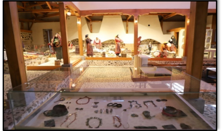
Şekil 9.Tarihi çamaşırhane müzesi (Çankırı Belediyesi, 2021c)

Cumhuriyet Mahallesi'nde halkın ortak çamaşır yıkama yeri olması amacıyla yapılmış bir çamaşırhanedir. Çankırı Belediyesi tarafından restorasyonu yapılmış ve dönemin kültürünün yaşatıldığı bir müze haline getirilmiştir.. Aslına uygun şekilde düzenlenen çamaşırhanede; çamaşır yıkanan bölümler, çeşmeler, kazanlarda suların kaynatıldığı ocaklar, çamaşır dövülen taş sekiler, oluk, suların atıldığı açık kanallar, araç gereçler, heykeller, müze malzemelerinin sergilendiği vitrinler, hediyeelik eşya satış birimi ve sunum panoları ile eski zaman çamaşırhane adetleri yaşatılmaktadır. Müze müzikle uğraşan gençlerin de uğrak yeridir. Çankırı Belediyesi Çivitçioğlu Medresesi Sanat Merkezi bünyesinde devam eden ney kursu öğrencileri ve def, bağlama ve saksafon çalan müzisyenler müzede bir araya gelmektedir (Çankırı Belediyesi, 2019b) (Şekil 9).