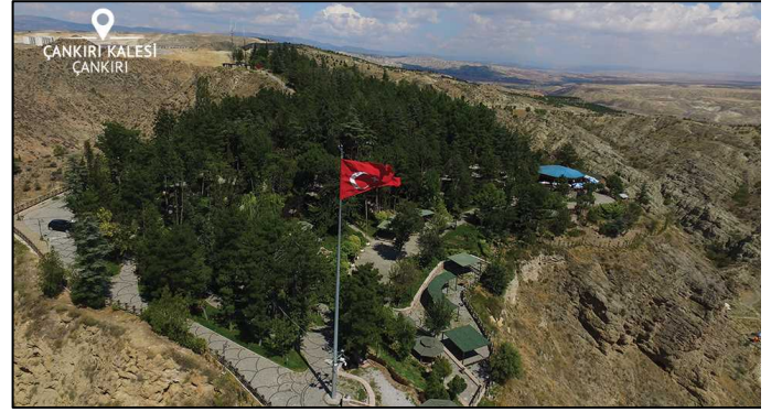
Şekil 4. Çankırı kalesi (Türkiye Kültür Portalı, 2021b)

Romalılar, Bizanslılar, Danişmentliler, Selçuklular ve Osmanlılar dönemlerinde sağlamlığıyla ünlü yapıdan günümüze birkaç sur kalıntısı kalmıştır. Dörtgen planlı olan kalenin surları moloz taş ve tuğla karışımıdır. Yüksekliği 150 m. kadardır. Kale içinde Roma Dönemi'nden kalma kaya mezarı, iskan kalıntıları ve pişmiş toprak kap parçaları bulunmaktadır. Kalede Çankırı Fatih Emir Karatekin Bey'in türbesi de bulunmaktadır. Kale bugün, ziyaretgâh ve mesire yeri olarak kullanılmaktadır (Türkiye Kültür Portalı, 2019) (Şekil 4).