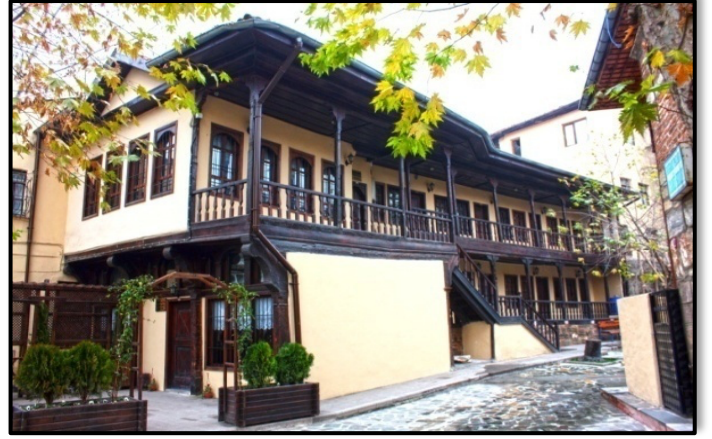
Şekil 8. Buğday pazarı medresesi