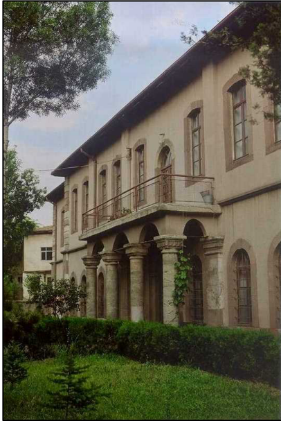
Şekil 11. Taş mektep (Türkiye Kültür Portalı, 2021d)

Yapımına 1886 yılında başlanmış olan Taş mektep, 1893 yılında İdadi Mektebi adıyla açılmıştır. Merkez ilçede bulunan bina iki katlıdır ve kesme taştır. Bugün hala Güzel Sanatlar Lisesi olarak kullanılmaktadır. Yapının başka bir özelliği ise Atatürk'ün, 31 Ağustos 1925 gecesi Şapka İnkılabı nedeniyle çıktığı yurt gezisi sırasında bu binadaki bir dershanede ağırlandığıdır. İnkânlar doğrultusunda tefriş edilen dersane, günümüzde "Atatürk Odası" olarak dönüştürülmüştür (Çankırı Valiliği, 2019f) (Şekil 11).