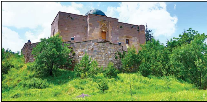
Şekil 3. Taşmescitten birgörünüştür(Türkiye Kültür Portalı, 2021a)

Anadolu Selçuklu Hükümdarı I. Alâeddin Keykubat zamanında Çankırı Atabeyi (Valisi) Cemalettin Ferruh tarafından 1235 yılında yaptırılmıştır. Cemalettin Ferruh şifahaneye ilave olarak 1242 yılında bir Dâr-ül Hâdis inşa ettirmiştir. Anadolu'daki ilk Dâr-ül Hâdis olan eser halk tarafından Taş Mescit olarak isimlendirilmektedir. Mimari özelliğinin yanı sıra yapıya önem kazandıran diğer konu iki plastik sanat eseridir. Biri yapı üzerinde, diğeri heykel görünümünde olan iki adet figürlü taş eserden birbirine dolanmış iki yılanın tasvir edildiği ve günümüzde "Tıp Sembolü" olarak kullanılan birinci parça yapı üzerinde bulunmaktadır. Çankırı Müzesinde sergilenen ikinci parçada ise günümüzde "Eczacılık Sembolü" olarak kullanılan kupaya dolanmış yılan figürü bulunmaktadır. Aynı zamanda bir anıt mezar olan eserde iki adet mezar odası da yer almaktadır. Kuzey cephede yer alan mezar odasında bir sanduka yer almakta, doğu cephesinden girilen iki bölümlü mezar odasında ise beş sanduka bulunmaktadır. Kaditler olarak anılan cesetlerin döneminde mumyalandığı tahmin edilmektedir. Bu mezar odasında ortada yer alan tabutun, eserin banisi Cemalettin Ferruh'a ait olduğu düşünülmekte sandukası mezar odasının üstünde ana mekanda yer almaktadır (Çankırı Valiliği, 2019a) (Şekil 3).