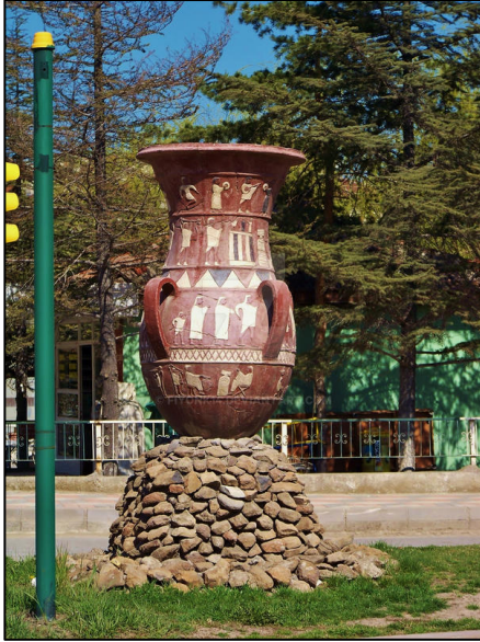
Şekil 10. İnandık vazosu (Anonim, 2009)