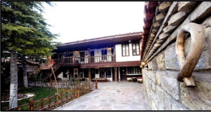
Şekil 7.Çivitçioğlu medresesinden görünüş (Çankırı Belediyesi, 2021b)

Çankırı'nın en önemli tarihi mekânlarından olan Çivitçioğlu Medresesi Çankırı Belediyesinin yaptığı tadilat ve tefriş düzenlemeleri sonunda kültür merkezi olarak hizmet vermektedir. Ebru kursları, hat ve rölyef kursları verilen medresenin özgün atmosferinde ney dinlemek de mümkündür (Çankırı Valiliği, 2019d) (Şekil 7).