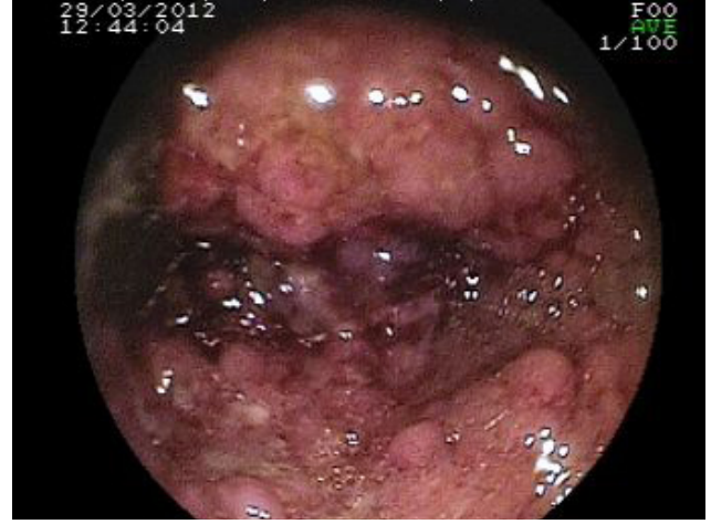
Şekil II: Kolonoskopide diffüz mukozal eritem ve yaygın ülserler.

yaygın purpurik basmakla solmayan palpabl makül ve papüller izlendi ( Şekil I ). Hastanın sorulmasında başvuru sabahı başlayan hafif ka-