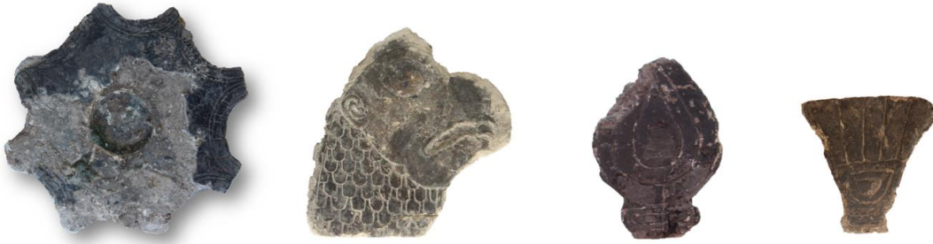
Görsel 4: Bezemeli Kireç Taşı Buluntulardan Örnekler.