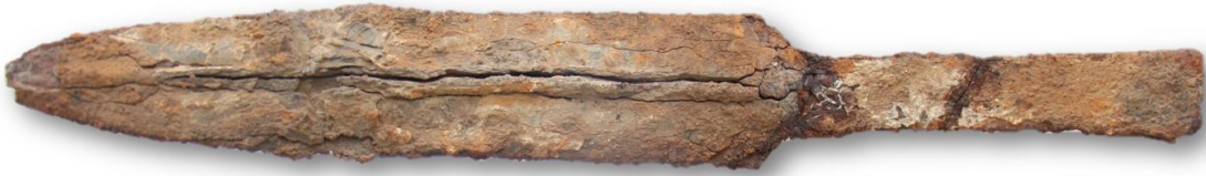
Görsel 11: Demir Buluntu Örneği.