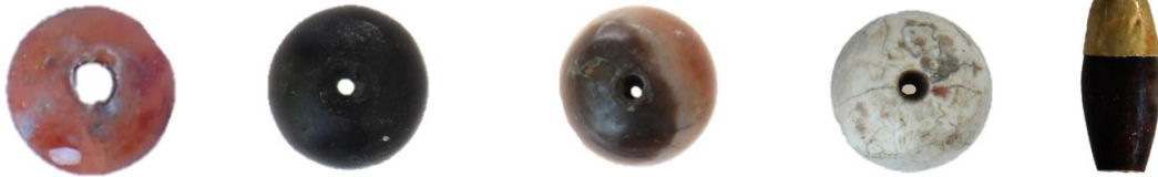
Görsel 8: Boncuk Buluntulardan Örnekleler.