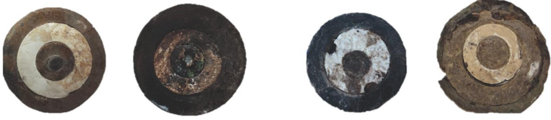
Görsel 6: Kakma Tař Halka Buluntulardan Örnekleler.