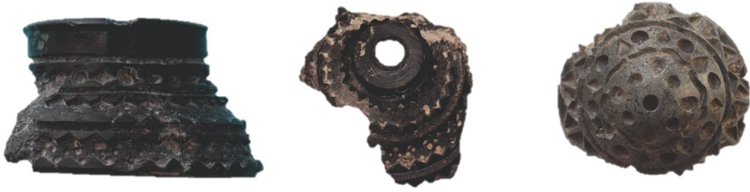
Görsel 7: Tař Kap Buluntulardan Örnekleler.