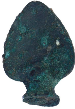
Görsel 10: Bronz Buluntu Örneği.