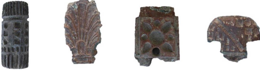
Görsel 3: Taht Parçası Olarak Düşünülen Buluntulardan Örnekler.