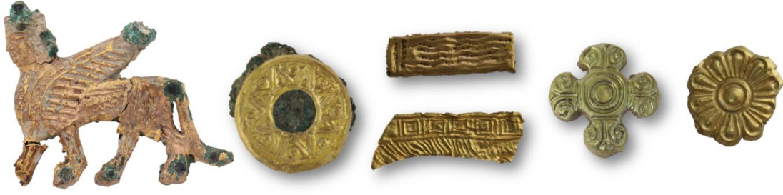
Görsel 9: Altın Buluntulardan Örnekler.