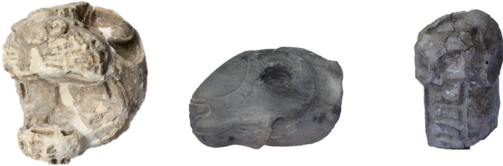
Görsel 5: Aslan, Koç ve İnsan Başlı Buluntular.