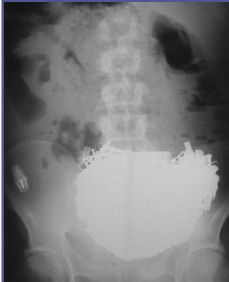
Resim 1. Direkt batın grafisinde pelvisde lokalize radyoopak yabancı cisimler

41 yaşında, şizofreni tanısı almış, yakınması olmayan erkek hastanın; kontrol fizik muaynesinde pelvisde sert, ağrısız, üzeri düzensiz, küresel kitle saptandı. Direkt batın grafisinde radyoopak, konturu düzensiz, pelvisde yabancı cisimler görüldü (Resim 1). Gastroskopide mide lümenini kaplayan, distale geçişi izin vermeyen, yer yer mide mukozasına penetre, pek çok farklı şekil ve büyüklükte metal cisimler görüldü (Resim 2 a-b). Yabancı cisimlerin mide duvarına penetrasyonundan, çok sayıda ve farklı boyutlarda olmasından dolayı endoskopik çıkarım ve laparoskopik cerrahi düşünülmüdü. Semptomsuz hasta elektif şartlarda opere edildi (Resim 3).