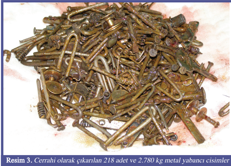
Resim 3. Cerrahi olarak çıkarılan 218 adet ve 2.780 kg metal yabancı cisimler

Aliye SOYLU 1 , Mustafa KALAYCI 2 , Kemal DOLAY 2 , Aydın ÇILTAŞ 3 , Erşan AYGÜN 2