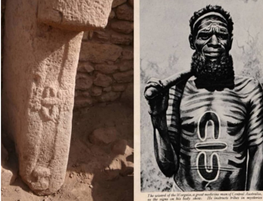
Resim 2. Göbeklitepe'de Çıkarılan Sembol ve Avustralyalı Aborjinlerle Kıyaslayan Haber