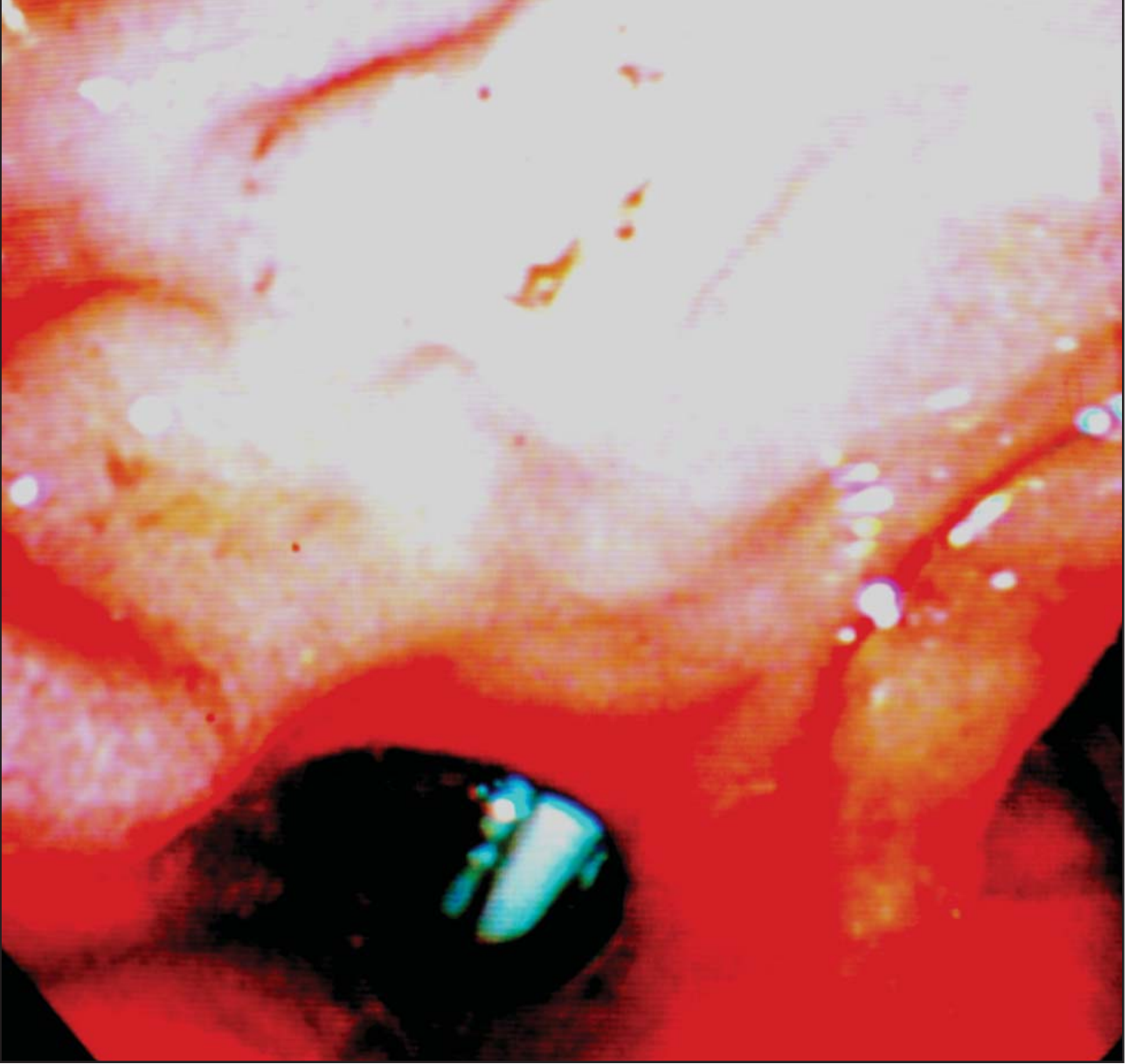
Resim 1. Bu görüntü size neyi hatırlatmaktadır?