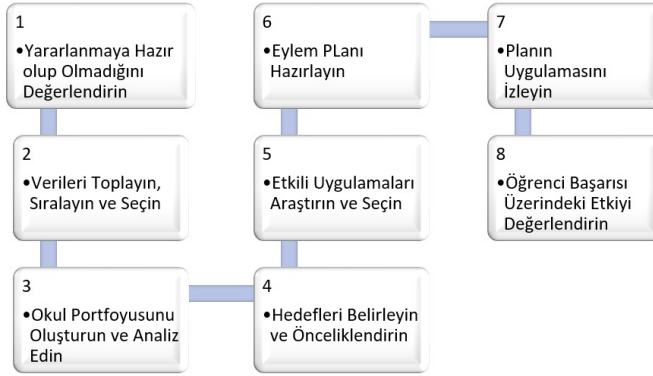
Şekil 3: Okul İyileştirme Planlama Süreci Basamakları (MacGregor, 2005).