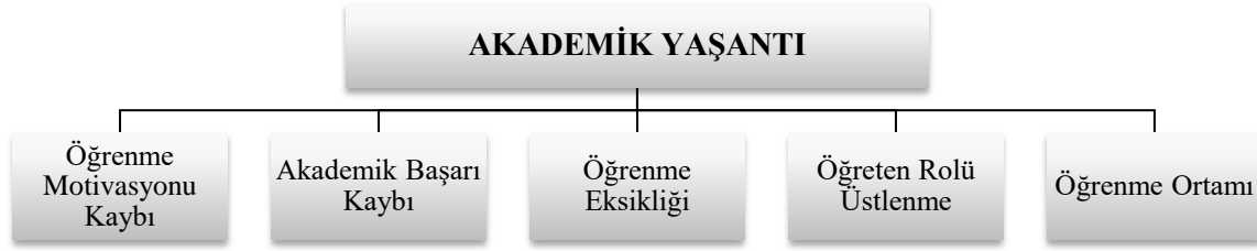
Şema 3. Akademik yaşantı temasına ilişkin kodlar

Veliler okulların AUÖ’e geçmesiyle birlikte bu süreçte çocuklarının öğrenme motivasyonlarının azaldığını, kitap okumak ve ödev yapmak istemediklerini, hatta derse zorla katıldıklarını belirtmişlerdir. Bu konuda V4 “ ama kitap okuyun diyorum kitap da zor okuyorlar, tercih etmiyorlar ” şeklinde, V8 de “ Büyükler bir şekilde oyalanacak bir şeyler buluyorlar kendilerine ama çocuklar için daha da zor daha sıkıntılı bir süreç, motive etmek çok zor. ” şeklinde düşüncelerini ifade etmişlerdir. V12 ise bu konuda görüşlerini şu şekilde ifade etmiştir;