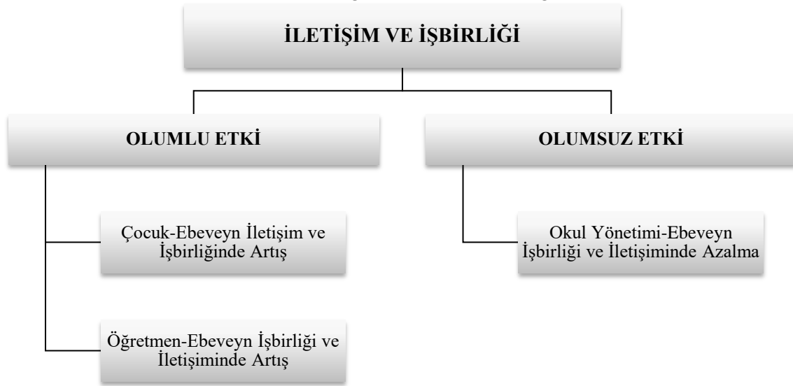
Şema 4. İletişim ve işbirliği temasına ilişkin kategori ve kodlar

Veliler bu sürecin, özellikle çocuk-ebeveyn iş birliği ve iletişiminde artış göstermesi ile olumlu etkilerinin de olduğunu ifade etmiştir. Bu süreçte iş hayatındaki kısıtlamalar nedeniyle sürekli işte olan babaların da evde olması ile ailece birlikte vakit geçirebildiklerini, babaların annelere iş ve çocuk bakımı konusunda yardımcı olduklarını ifade ettikleri görülmektedir. V11 bu konuda görüşlerini şu şekilde ifade etmiştir;