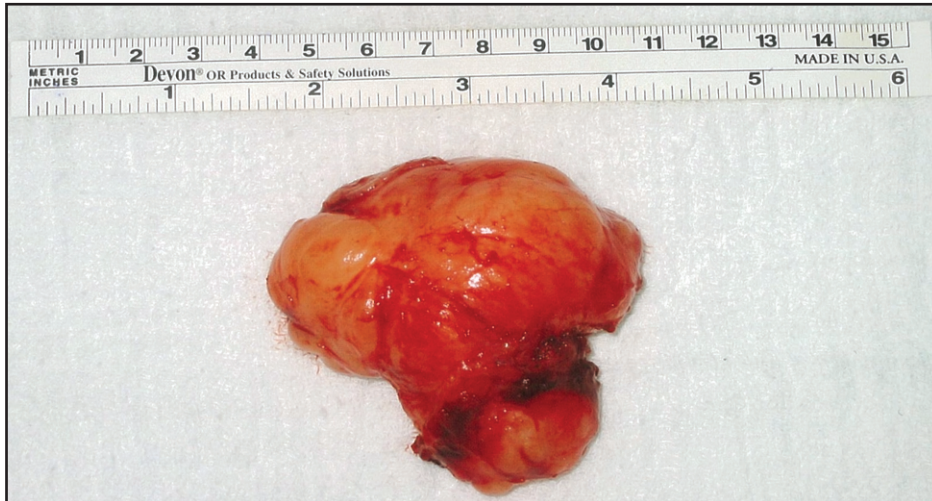
Resim 4. Eksize kitlenin (Schwannoma) görüntüsü