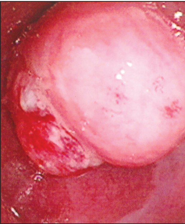
Resim 1. 62 yaşında yutma güçlüğü ve kilo kaybı şikayetleri ile başvuran kadın hastanın endoskopisinde 28-35 cm.'lerde yer alan lümeni daraltan kitle görüntüsü

Dr. Lütfi Kırdar Kartal Eğitim ve Araştırma Hastanesi Aile Hekimliği 1 , Gastroenteroloji 2 , Genel Cerrahi 3 , Patoloji 4 , Onkoloji 5 Bölümleri, İstanbul