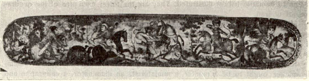
Gorgan ormanlarında Türkmenlerin eski kıyafetleriyle yaban domuzu ve pelenk avı Abbasi Şirazi işi kalemdan (1860)