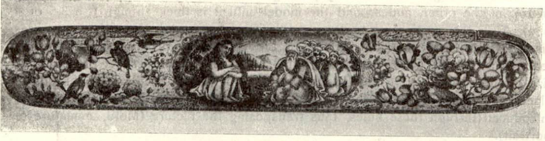
Ağa Mehemet Mustafam (Amid Mustafa) işi (siyah kalem) kalemdanın üst kapığı. (üzerinde muta- savviflerin resimleri bulunan bu cins kalemdanlara (Mecalisi Urefa Kalemdan) derler. Bu resimde Mevlâna ile Şems-i Tebrizi'nin telâkileri görülmektedir. Amid Mustafanın şaheseridir.) 1889