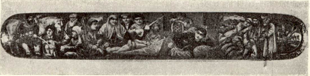
Türkmenler (Ağa Mehemet İbrahim (Amid İbrahim) tarafından zamanın vezirlerinden Mecdül- mülk için yapılmıştır.) 1860