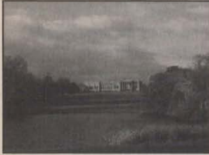
Resim-2 Stowe Garden, 2007. (9)

Topografya oluşumları ve iklim koşulları kır peyzajının tasarımını için son derece uygundu. Yuvarlak, yumuşak formlu tepeleri, küçük ormanları ve bunlara kontrast oluşturan ilgi çekici tekstür ve renklerdeki meralar ile planlama alanının bütünü, bahçe ve mevsimler içindeki sonsuz değişimleri ve dumanlı ışıkları ile iklim, kompozisyona ilgi çekicilik ve gizemli bir anlam kazandırıyor. İklim ve topografya bakımından avantajlara ek olarak aristokrat arazi sahipleri de böyle bir düzenlemenin gelişmesine yardımcı durumda idiler. (7).