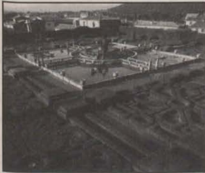
Resim-5 İtalyan bahçesi örneği 2 (Villa Lante, 2007) (19)

Bitki materyali kullanışı bakımından bütün Rönesans bahçelerinde benzerlik göstermektedir. Herdem yeşil bitkilere fazlasıyla yer verilmiştir. Servi ve fıstık çamlarının koyu yeşil rengi ile çok güzel bir tezat oluşturan gümüş renkli zeytin ağaçlarının meydana getirdiği bitki örtüsü,