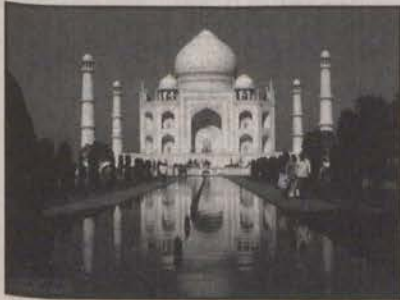
Resim-3 Taj Mahal, 2007 (13).

Bitkilere topiari uygulanması, yollara servi dikilmesi, çinilerle bezenmiş banklar, möbleler karakteristlik özelliklerdendir. Özellikle Timur devrinde her büyük kentin ve her sarayın, bazen halka da açık geniş ve gösterişli bahçeleri olması gelenek haline gelmiştir. Timur'un en güzel bahçelerinden biri olan Gülbağ birbirini dik kesen yolları, ritmik şekilde sıralanmış kare şekilli havuzları ve bunları birbirine bağlayan kanalları ile formal ve simetrik bir planlama özelliği göstermekteydi. Diğer bir anıt bahçe de 1631 yılında Agra şehrinde Şah Cihan'ın ölen karısı için yaptırdığı Taç mahal'dir.