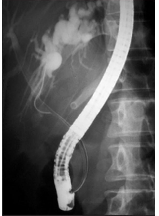
Resim 2. Bu resimde sfinkterotom gerildiğinde kılavuz telin sol dala rahatça bulunduğu izleniyor