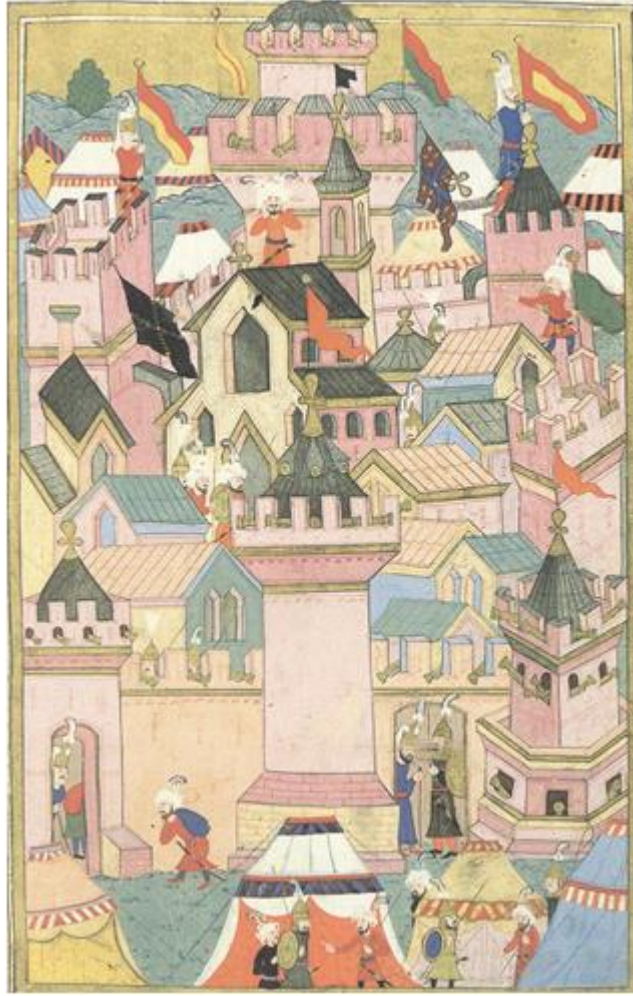
Şekil 3. Çalışma Kâğıdında Yer Alan Minyatür (Mahir, 2012)