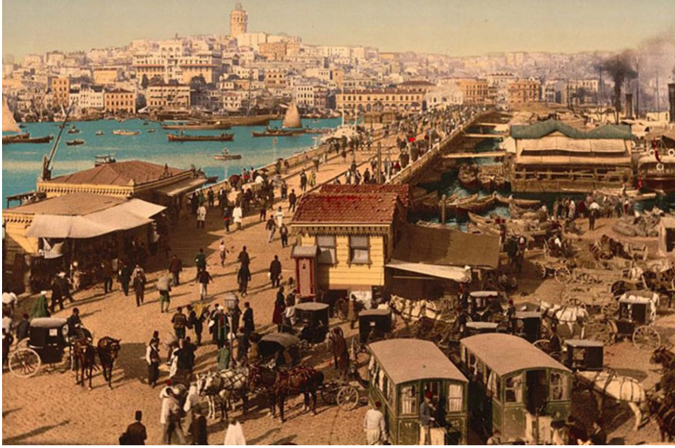
Şekil 1. Çalışma Kâğıdında Yer Alan Galata Köprüsünün 1920'li ve 2000'li Yıllara Ait Aynı Açıda Çekilmiş Fotoğrafları (Web-1; Web-2)

Görsel Analiz Düzeyi çalışma kâğıdında üç ayrı formatta görsel kullanılmıştır. Çalışma kâğıdında ilk olarak Galata Köprüsünün 1920'li ve 2000'li yıllara ait aynı açıdan çekilmiş iki adet fotoğraf kullanılmıştır (Bkz. Şekil 1).