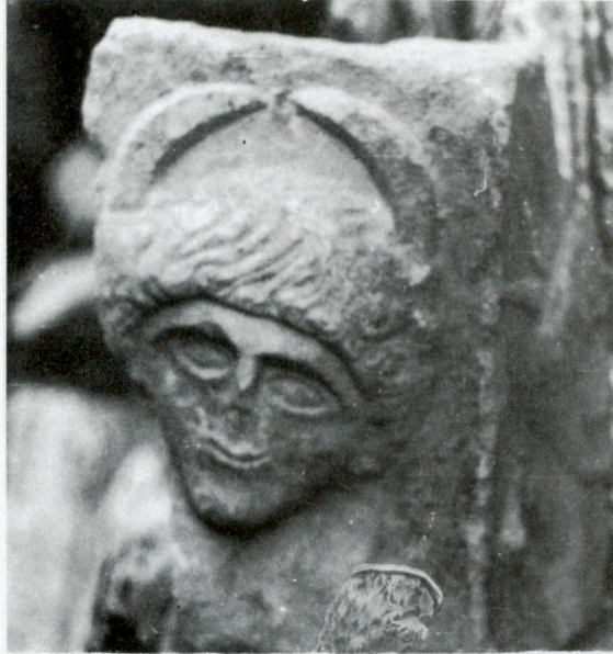
Res. 4 - İznik Müzesi (Yakup Çelebi Zaviyesi)'nde bulunan mermer kabın köşe parçası.