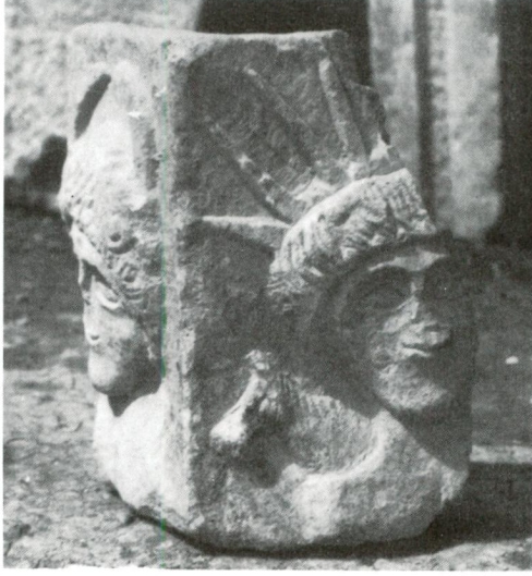
Res. 5 - İznik Müzesi (Yakup Çelebi Zaviyesi)'nde bulunan mermer kabın köşe parçası.