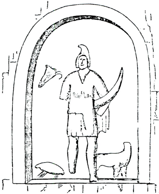
[Figure of Lunus on rocks at Homonli.]