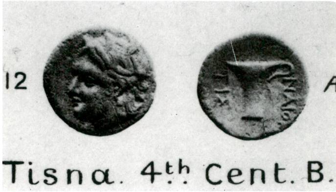
Res. 1 - M.Ö. IV. yüzyılda darbettirilmiş olan Tisna Sikkesi.