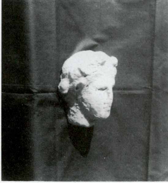
Res. 3 - Tire Müzesi'ndeki 39 Env. No'lu mermer erkek başı.