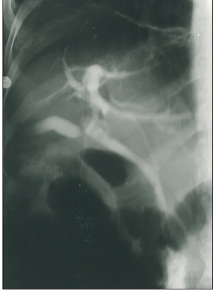
Resim 4. Bu seansta koledokta kalan taşlar balon ve basketle temizlendi.