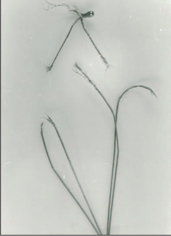
Resim 3. Kırılan basket telleri izleniyor.