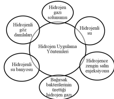
Şekil 1. Sağlık alanında hidrojen uygulama yöntemleri

Hidrojen Banyosu ve Hidrojenli Göz Damlası: Hidrojenin yukarıda bahsedilen uygulamalarının yanı sıra, hidrojen banyosu ve hidrojenli göz damlası uygulamaları da bulunmaktadır. Çözünmüş \text{H}_2 ile ılık su banyosu uygulamasında \text{H}_2 , kan akışı yoluyla ciltte kolayca nüfuz etmekte ve yayılmaktadır [4, 12]. \text{H}_2 'li göz damlası uygulamasında, \text{H}_2 'nin salin içinde çözülmesi ve doğrudan oküler yüzeye uygulanmasıyla %70 oranında iyileşme kaydedildiği bildirilmiştir [13].