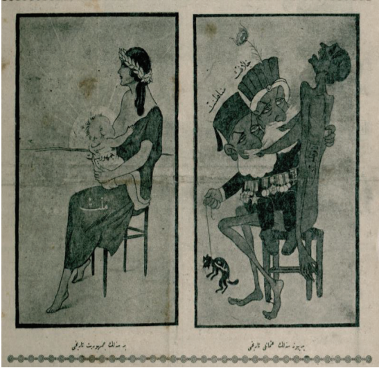
Resim 10: Bir senelik Cumhuriyet tarihi Yediyüz senelik Osmanlı tarihi

Karikatürde (Resim 10), Osmanlı tarihi ve Cumhuriyet tarihi mukayesesi üzerinden toplumsal değişim incelenmiştir. Sağ taraftaki karikatürde başının üzerinde hilafet ve saltanat yazan iki sakallı kişi üzerinde anavatan yazan bir kadını eme eme sıksa ve çelimsiz bir hale sokmuştur. Ayrıca kafasının üzerinde saltanat yazan kişinin elinde boynundan sıkı sıkı bağlanmış bir kedi bulunmaktadır ve kedinin üzerinde millet yazmaktadır. Sol taraftaki karikatürde güzel ve dinç bir hanımefendi vardır bu hanımefendinin üzerinde millet yazmaktadır. Hanımefendinin emzirdiği şirin ve tatlı çocuğun üzerinde cumhuriyet yazmaktadır ve arka fonda güneş her tarafı aydınlatmaktadır. Karikatürde hilafet ve saltanat müesseselerinin sömürdüğü vatan ve bu müesseselerin kuklası olan bir millettten, milletin sinisinden kopan ve milletinden başka bir güvencesi olmayan aydınlık cumhuriyete doğru yaşanan toplumsal değişim çarpıcı bir vaziyette resmedilmiştir.