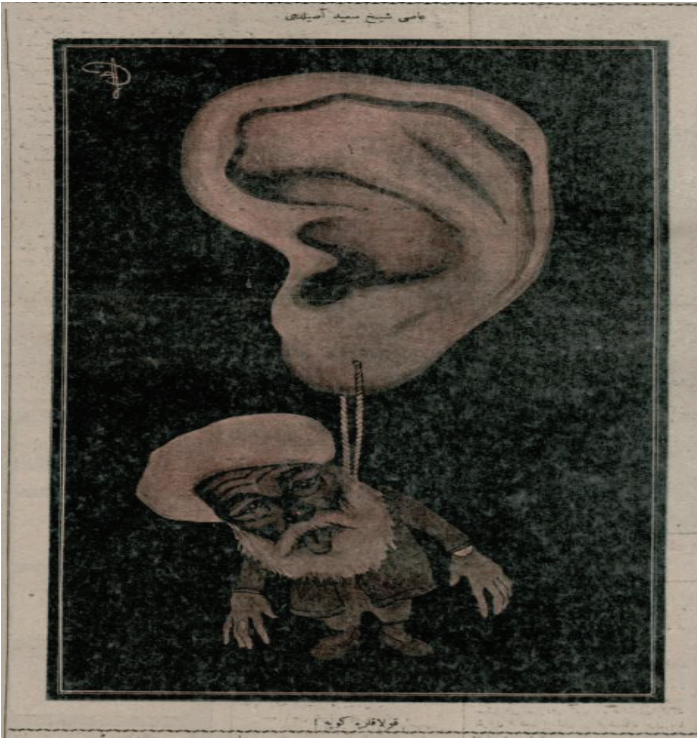
Resim 3: Asi Şeyh Said asıldı,

onların giyim tarzlarının değişmez enstrümanları olan sarık, cübbe, şalvar, sarık, sakal gibi motifler yaşanan toplumsal ve siyasi dönüşümle birlikte ciddi bir irtifa kaybı yaşamıştır. Türk- İslam geleneğinin başlangıcından bu yana belkide dini liderler ve din eksenli giyim tarzına karşı hiç oluşmamış bir toplumsal algı oluşmuş ve bu algıyla zikredilen grup ve giyim tarzına karşı olumsuz bir bakış açısı ekseninde şekillenen bir toplumsal değişim gerçekleşmiştir.