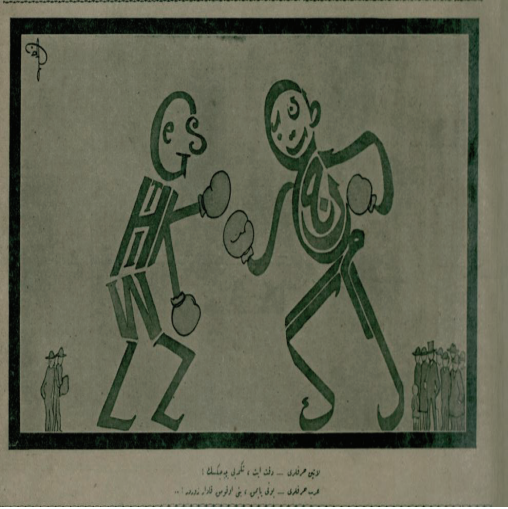
Resim 13: Latin harfleri: Dikkat et, tekme yiyeceksin Arap harfleri: Bunu yapmak, beni okumak kadar zordur!..

Karikatürde (Resim 13) eski ve yeninin aynı karede resmedilmesiyle toplumda var olan değişimin gösterilmesi amaç edinilmiştir. Bir yandan eskinin harfleri olan Arap harfleri diğer taraftan yeninin sembolü olan Latin harfleri. Harf sistemi konusunda yaşanan değişim toplumların tarihinde pek sık rastlanılan bir değişim değildir; zira bu değişimin tesir sahası diğer tüm değişimlerden daha geniştir. Türk toplumsal hayatı bu değişimi yaşayan nadide yapılarıdır. Karikatür’de Arap harflerinden müteşekkil olan eski Türkçenin okunma zorluğuna vurgu yapılmıştır. Bu durum, büyük bir ihtimalle harf inkılabına zemin hazırlayan temel sebeplerden biridir.