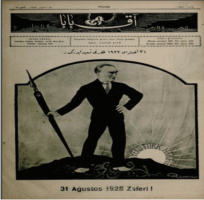
Resim 14: 31 Ağustos 1922 zaferini tesit ederken...

Bu karikatür (Resim 14) değişimin keskin bir resmini oluşturmaktadır. Modern Türkiye Cumhuriyeti'nin Kurucu Babası Halaskar Mustafa Kemal Atatürk üzerinde ay yıldız olan bir kalem elinde tutmaktadır. Ayaklarının altında ise karanlıklar içerisinde Arap harfleri bulunmaktadır. Arka fonda yeni Türk harfleri bir güneş gibi parlamaktadır.