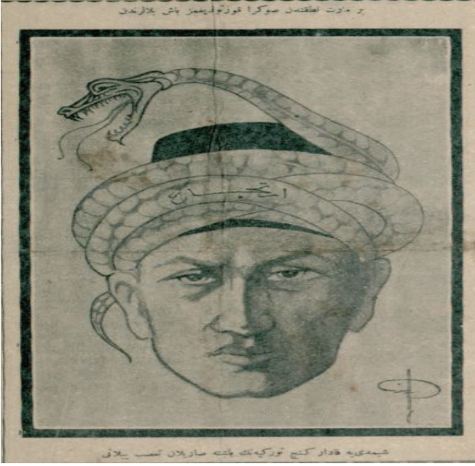
Resim 5: Bir Mart nutkundan sonra kurtulduğumuz baş belalarından.

Şimdiye kadar genç Türkiyenin başına sarılan taassup yılına