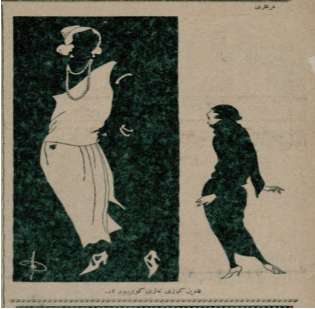
Resim15: Kadın gözü neleri görüyor ?

Karikatürde (Resim 15) bir tarafta kapalı, diğer tarafta ise açık giyim tarzını benimsemiş iki kadın yer almaktadır. Kapalı giyinen kadın, açık giyim tarzını benimsemiş kadına hayranlıkla bakmakta ve karikatürün altında “Kadın gözü neleri görüyor?” yazısı yazılmıştır. Bu karikatür toplumsal yaşamda kadının kılık kıyafetinde yaşanan değişimi karşılaştırmalı bir şekilde resmetmiştir. Bir yanda eskinin giyim tarzı diğer yanda ise toplumun yaşadığı değişim sonucunda oluşan yeni giyim tarzı karikatürize edilmiştir.