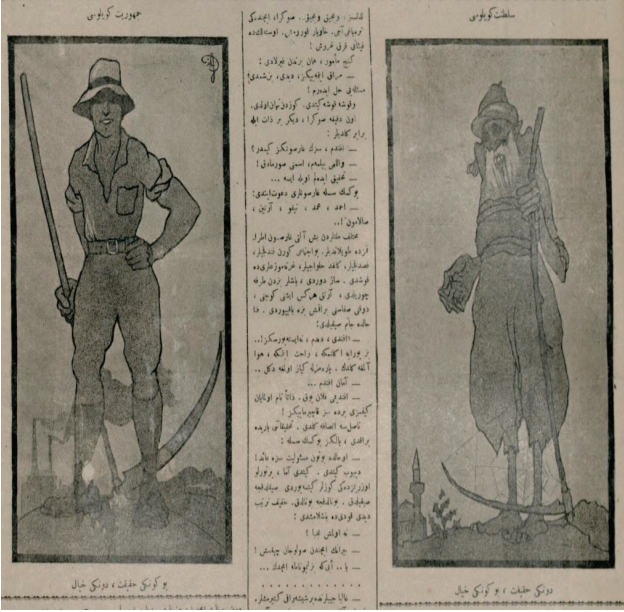
Resim 11: Cumhuriyet köylüsü Saltanat köylüsü Bugünkü hakikat, dünkü hayal Dünkü hakikat, bugünkü hayal

Karikatürde (Resim 11) Saltanat köylüsü ve Cumhuriyet köylüsü üzerinden yaşanan toplumsal değişim resmedilmiştir. Sağ tarafta sakallı, sarıklı ve şalvarlı yaşlı bir amcannın elinde örümcek ağıları bağlamış bir orak bulunmaktadır. Resmin arka fonunda ise bir camii bulunmaktadır. Sol tarafta ise kafasında fötr şapka olan güçlü ve genç bir delikanlının elinde daha büyük ve işlevsel bir orak vardır. Arka fonda ise bir fabrika bulunmaktadır.