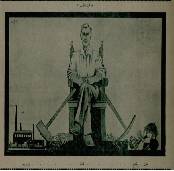
Resim 12: “Hakimiyet milletindir!”

ekonomi sonucunda cumhuriyet köylüsünün orağı sürekli çalışmaktadır. Saltanat köylüsünün bulunduğu yerin belirgin mekanı camii iken yaşanan toplumsal ve siyasi değişim sebebiyle cumhuriyet köylüsünün bulunduğu yerin belirgin mekanı fabrikadır.