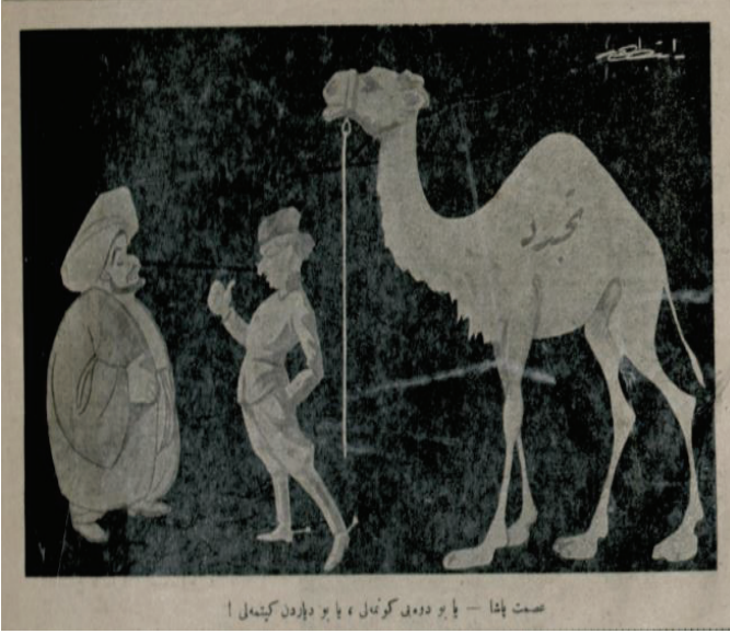
Resim 2: İsmet Paşa; Ya bu deveyi gütmeli, ya bu diyardan gitmeli !

Kaynak: Akbaba, 9 Mart 1341, Sayı:236, s.2.