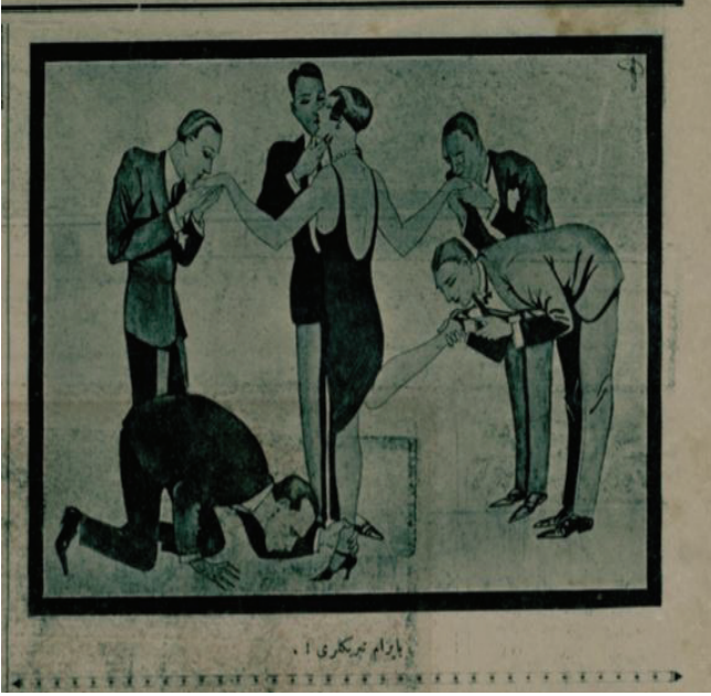
Resim 16: Bayram tebrikleri

toplumsal ve siyasal değişimle birlikte bir erkeğin tek eşi olma hakkını kazanmış buna ek olarak o bahtiyar eş olmak isteyen beş kişiyi adeta etrafında pervaneye çevirmiştir. Bu karikatür toplumsal hayatta kadının yerinin daha farklı bir konuma geldiğini, kadının değişen fonksiyon ve önemini bu şekilde resmetmiştir. Ayrıca karikatür ataerkil eksenli Türk toplumun yapısında yaşanan değişim sonucunda oluşan farklılaşmayı da ortaya koymaktadır.