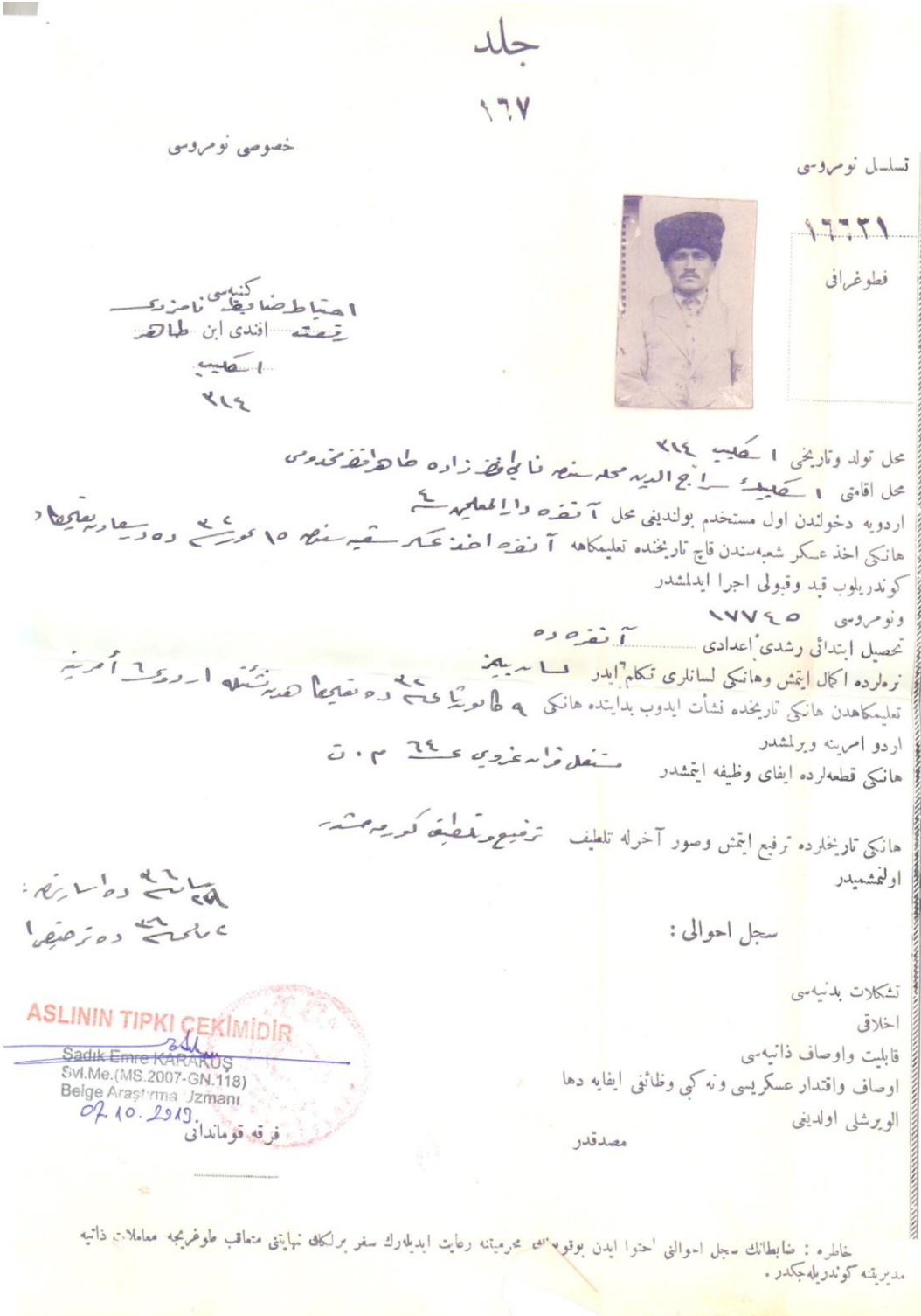
Ek 2: Birinci Dünya Savaşı Dönemine Ait Askerlik Belgesi.