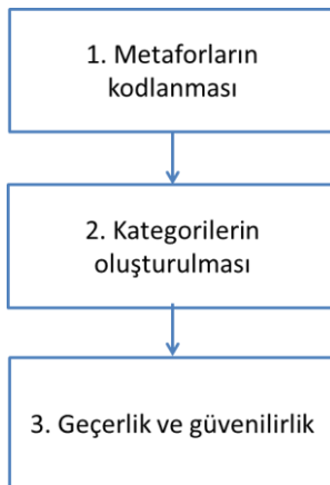
Şekil 1. Verilerin analizi ile ilgili gerçekleştirilen aşamalar

Araştırmada verilerin analizi ile ilgili gerçekleştirilen aşamalar Şekil 1'de gösterilmektedir.