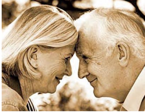
Şekil 4. Ada Matbaacılık Ders Kitabı Yaşlılık Görseli 2

Ders kitabında yaşlılıkta sosyalleşme ve uyum süreci aşağıdaki gibi ifade edilmektedir: