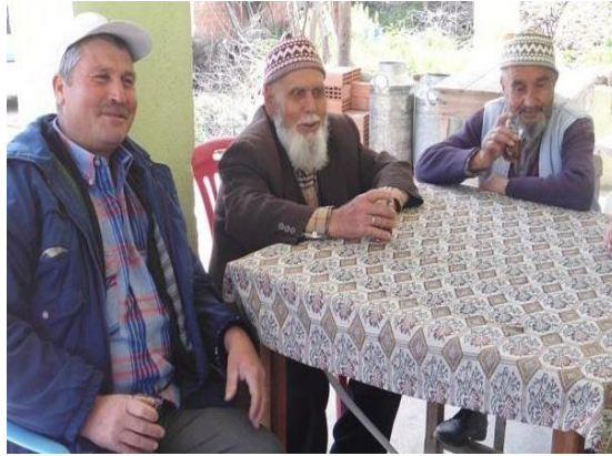
Şekil 6. Tuna Matbaacılık Ders Kitabı Yaşlılık Görseli 2

Öğrencilere bu bağlamda “Çevrenizdeki yaşlılık döneminde bulunan bireylerin sosyal yaşama katılmalarını kolaylaştırmak amacıyla neler yapılabileceğine yönelik öneriler geliştiriniz.” sorusu yöneltilmektedir.