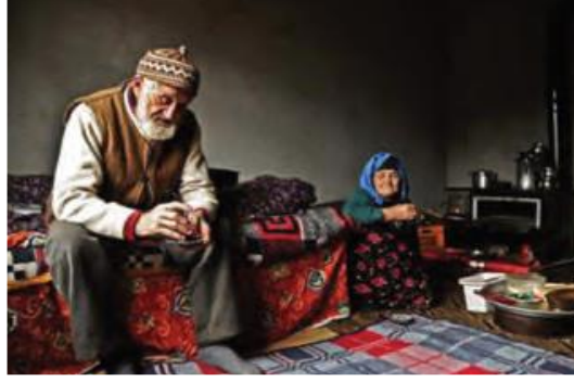
Şekil 3. Ada Matbaacılık Ders Kitabı Yaşlılık Görseli 1