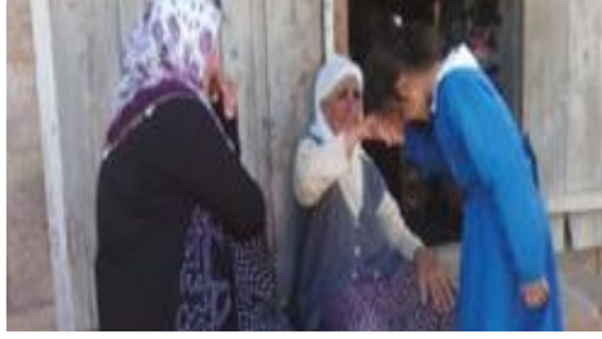
Şekil 7. Tuna Matbaacılık Ders Kitabı Yaşlılık Görseli 3

Ders kitabının 4. ünitesinde “Toplumsal Gelişme ve Kültür” başlığı altında yer alan kültürel gecikme kavramı ile yaşlılık kavramı ilişkilendirilmiştir. Aşağıdaki görsel kitapta “Teknoloji toplumsal değerlerden daha hızlı değişir.” (Yurtseven, 2019, s. 83) açıklaması ile yer almış olup, görselde yaşlılar değerleri, teknoloji ise değişimi simgelemektedir.