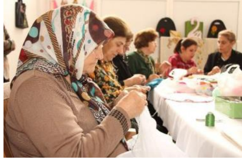
Şekil 2. Devlet Ders Kitabı Yaşlılık Görseli 2

İş yaşamı dışında itilmiş emekliler olarak yaşlıların toplumda temsili yalnızca sosyalleşme problemi çerçevesinde ele alınmamalıdır. Kitapta yer verilen soru, yaşlıların sosyalleşme sürecinde yaşadıkları sorunların çözümüne odaklıdır: “Modern toplumlarda yaşlıların yaşadığı sosyal dışlanma sorunu hakkında ne düşünüyorsunuz? Gençler olarak bu sorun karşısında neler yapabilirsiniz?” sorusu yer almaktadır. İlgili sorunun cevaplarının yazılması için boş bırakılan yerin karşısında ise aşağıdaki görsel yer almaktadır (Özer, 2017, s. 34):