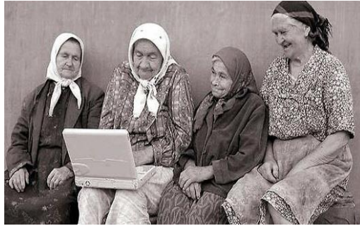
Şekil 8. Tuna Matbaacılık Ders Kitabı Yaşlılık Görseli 4

Ders kitabının 4. ünitesinde “Toplumsal Gelişme ve Kültür” başlığı altında yer alan kültürel gecikme kavramı ile yaşlılık kavramı ilişkilendirilmiştir. Aşağıdaki görsel kitapta “Teknoloji toplumsal değerlerden daha hızlı değişir.” (Yurtseven, 2019, s. 83) açıklaması ile yer almış olup, görselde yaşlılar değerleri, teknoloji ise değişimi simgelemektedir.