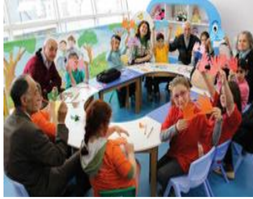
Şekil 5. Tuna Matbaacılık Ders Kitabı Yaşlılık Görseli 1

Yaşlılık tanımında yaşlıların sağlıklı yaşlanabilmeleri için aktivitelerini sürdürmelerine vurgu yapılması, yaşlılık teorilerinden aktivite teorisini desteklemektedir. Yaşlılıkta sosyal etkileşimi sürdürmenin önemli olduđu ise aşığıdaki görselle temsil edilmektedir (Yurtseven, 2019, s. 32, 39):