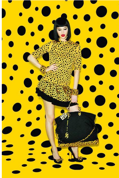
Resim 11: Yayoi Kusama-Louis Vuitton Koleksiyonu, 2012.

2012 yılında sanatçı, Louis Vuitton'un en büyüleyici koleksiyonlarından birini tasarladı. Japon efsanesinin, saplantı ve ciddiyet mesajları yansıtan giysi ve aksesuar koleksiyonu sunulmadan önce dünya çapındaki tüm mağazalar ikonik bir dönüşüm geçirdi ( https://www.dazeddigital.com/fashion/article/35567/1/louis-vuitton-art-collaborations-yayoi-kusama-richard-prince-cindy-sherman ).