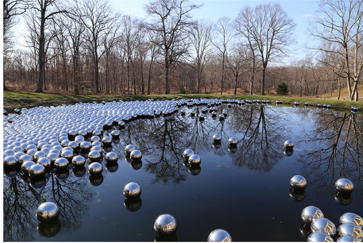
Resim 5: Yayoi Kusama, “Nergis Bahçeleri” (Narcissus Garden), 1966, Yerleştirme, Glass House, Connecticut, US.

Yayoi, Tanrısal sonsuzluk hissini benekli çalışmalarında gösterir. Büyüsünün girdabına takılan bir duyguyu yansıtarak 1966’da yaptığı 1500 adet yansımali gümüş kürelerle “Nergis Bahçeleri” isimli eserini meydana getirmiştir. Yunan mitolojisinde Narcissus’un su yüzeyinde kendi yansımasına duyduğu aşkla suda boğulmasına vurgu yaparak, su üstünde düzenlediği enstalasyonla izleyicinin kendi yansımasıyla yüzleşmesini gerçekleştirmiştir (Orhan, 2019:26).