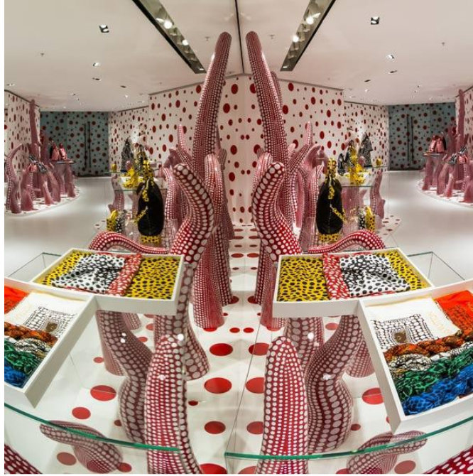
Resim 10: Yayoi Kusama, Louis Vuitton Vitrin Tasarımı, London 2012.