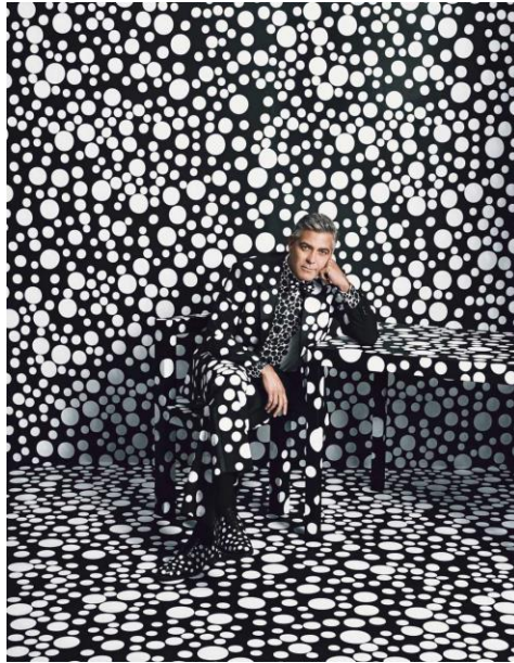
Resim 13: Sanatçı Yayoi Kusama ve Tasarımcı Giorgio Armani Ortak Çalışması, 2014.

Erkek giyiminde sofistike ama sade bir tarzı yansıtan Giorgio Armani markası ve Yayoi Kusama iş birliği ile aktör George Clooney, ikonik siyah beyaz puantiyeler ile giydirilmiş ve magazin dergilerine kapak olarak, marka kimliğine vurgu yapılmıştır.