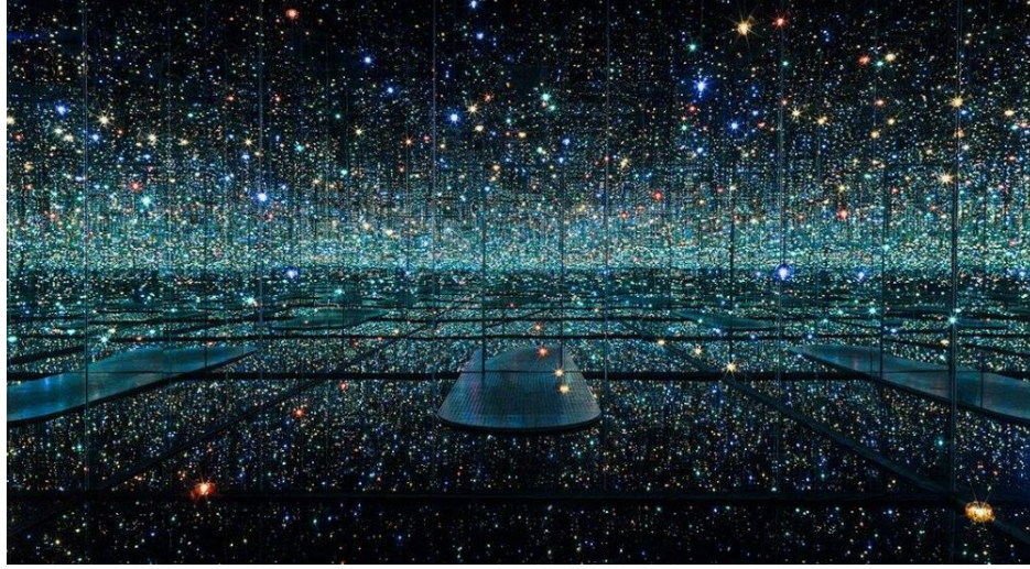
Resim 3: Yayoi Kusama, Sonsuzluk Odası ( Infinity Mirrored Room ).

Sonsuz sonsuzluklar evrenin ne kadar ötesine gidebiliyordu? Bu soruları sorarken aynı zamanda tek bir noktaya bakıyordum, kendi hayatıma. Tek bir polka noktası, milyarlarcasının arasında tek bir nokta...” diyor ( http://www.gazetefestivaltv.com/beneklerden-bir-dunya-yayoi-kusama/ ).