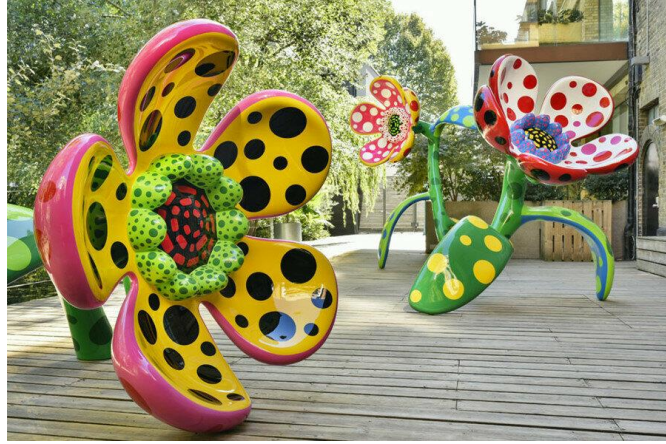
Resim 1: Yayoi Kusama, “Kalbimi Verdiğim Her Şey Hakkında Konuşan Çiçekler” (2018).