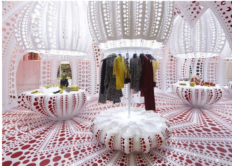
Resim 9: Yayoi Kusama, Louis Vuitton Vitrin Tasarımı, London 2012.