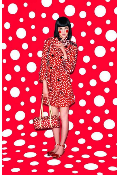
Resim 12: Yayoi Kusama-Louis Vuitton Koleksiyonu, 2012.