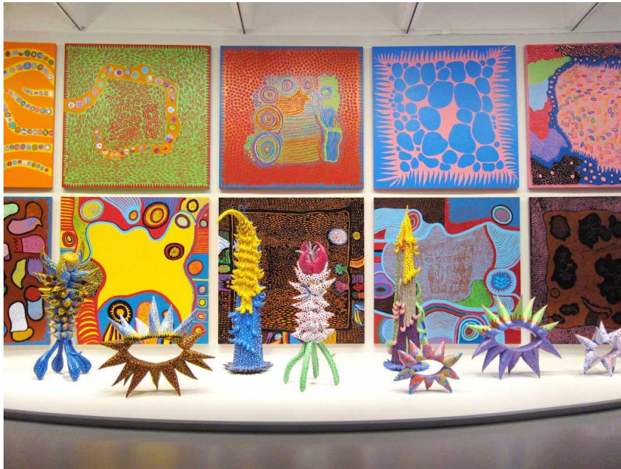
Resim 7: Yayoi Kusama, Ebedi Ruhum (My Eternal Soul), 2009.