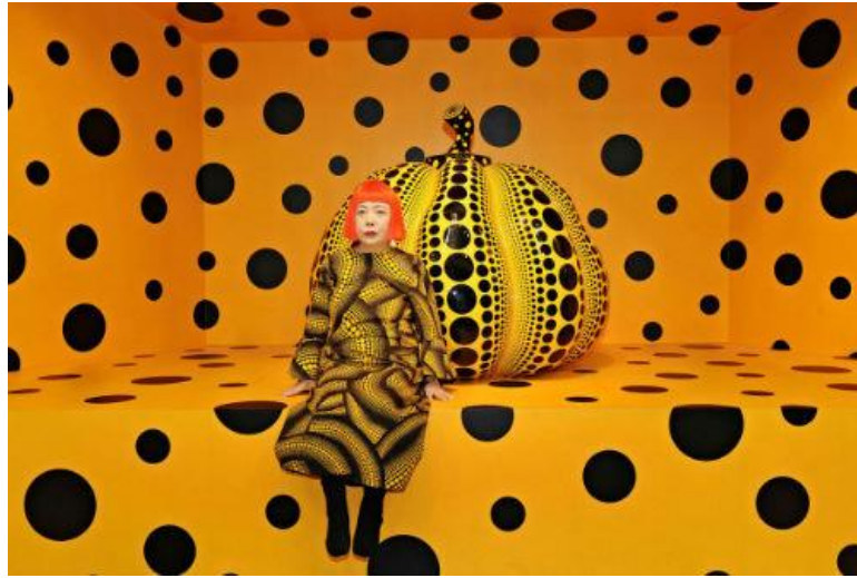
Resim 2: Yayoi Kusama, Pumpkin (Balkabağı), 2010.

Yayoi Kusama, çalışmalarında balkabağı formunu sık sık kullanmıştır. Resimde görülen “Pumpkin” adlı eseri hakkında şunları söylemiştir; “ Balkabakları mizahi figürler. Formları beni büyütüyor ve son derece iddiasız halleri de bana çok çekici geliyor ” (Artam, 2019:54).