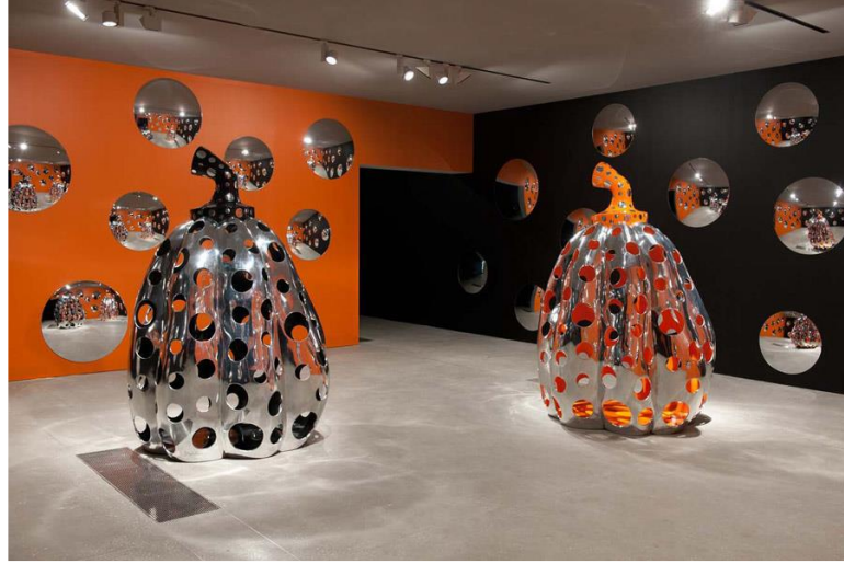
Resim 8: Balkabağı Heykeli (Pumpkin Sculpture), 1993.

Kaynak: https://repositorij.ttf.unizg.hr/islandora/object/ttf%3A126/datastream/PDF/view