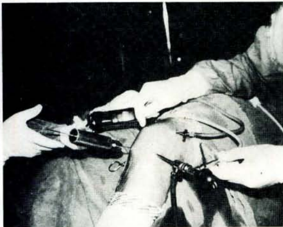
Resim 3- Operasyon sahası görünümü