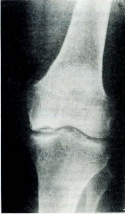
Resim 1- Pre-operatif sol diz A.P grafisi