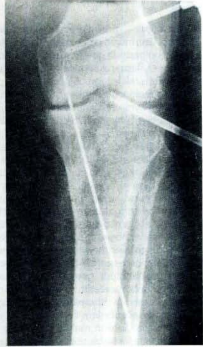
Resim 4- İntra-operatif sol diz A.P grafisi