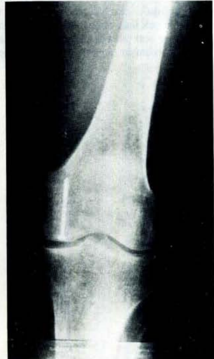
Resim 5- Post-operatif beşinci ayda sol diz A.P grafisi