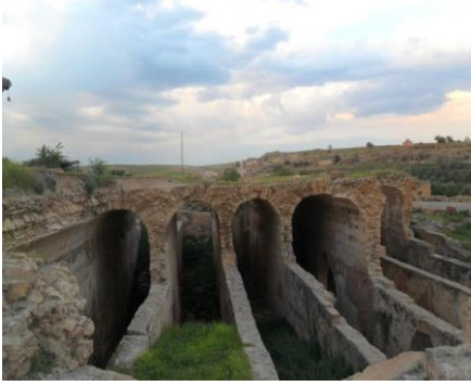
Resim 1: Dara Su Sarıncıları (Mayıs-2011)

ve özellikle de mezarları incelemiş ve kalıntılarla ilgili gözlemlerini aktarmıştır. Son olarak O. Parry, Dara kalıntılarıyla ilgili olarak Bütün bu kalıntılar o kadar dayanıklıdır ki bugün bile mükemmel çalışma tarzındadır 57 .