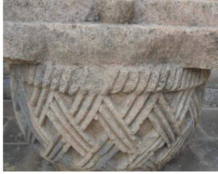
Resim 2: Dara Sütun Başlıkları (Mardin Müzesi, Mayıs-2011)