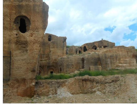
Resim 5: Dara Duvar Kalıntıları (Mayıs-2011) Resim 6: Dara Kaya Mezarları (Mayıs-2011)

Hem klasik arkeolojinin odak noktalarından olmaması, hem de bölgenin iklim koşulları Dara Sit alanının bilimsel incelemesini 1986 yılına kadar ertelemiştir. 1986 yılından beri T.C. Kültür Bakanlığı Dara Sit alanını bilimsel çalışmalara açmıştır. Bu şekilde Dara’da ilk kapsamlı çalışmalar başlatılmıştır 60 . Metin Ahunbay başkanlığında yürütülen arkeolojik çalışmalar neticesinde kent ve çevresinde 29 istihkâm duvarı ve diğer mimari unsurlar yanında çok değerli Roma-Bizans dönemi bulgularına da tesadüf edilmiştir 61 .