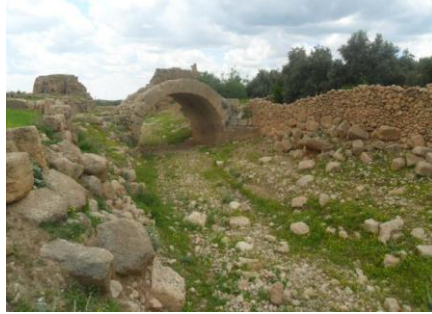
Resim 4: Dara Köprü Kalıntıları (Mayıs-2011)

Son günlerde Dara ismi, VI. yüzyıl kalelerini içeren dağınık küçük bir köy (Oğuz Köyü) tarafından korunur 58 . Bugün yaklaşık 2 bin nüfuslu olan bu