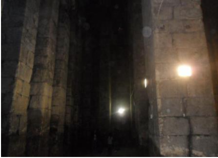
Resim 3: Dara Antrepo (Depo-Silo-Zindan) (Mayıs-2011)