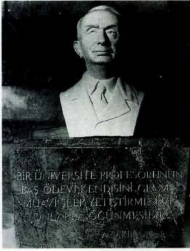
Resim 3 b