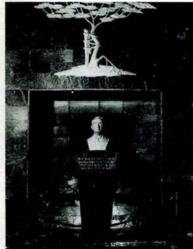
Resim 3 a