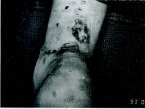
Şekil 1: 3x3.5 cm'lik cild defekti ve nekroze tendon bölgesi