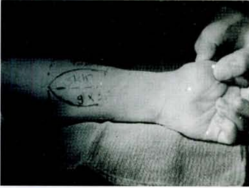
Şekil 3: 9x4.5 cm boyutlarında cilt ve daha geniş fasia ve brachioradialis tendonu içeren radial önkol flebinin çizimlenmesi