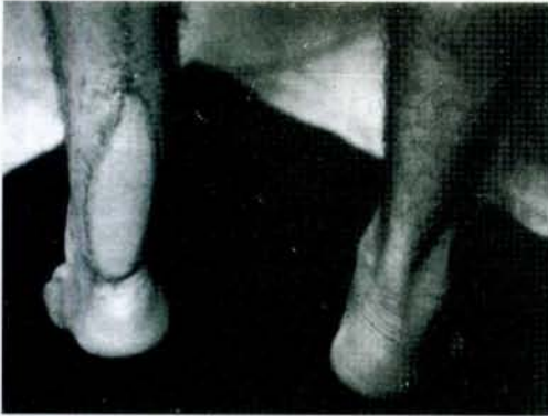
Şekil 5: Postoperatif 9. ayda parmak ucu duruşu