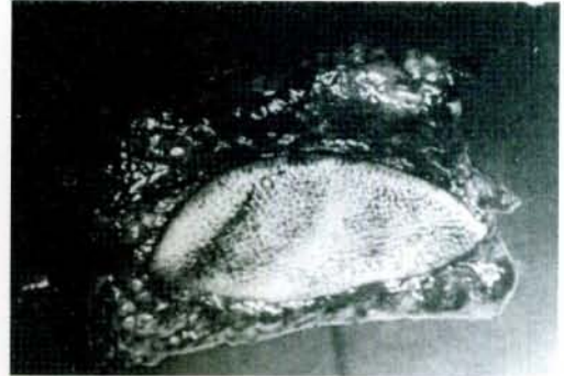
Şekil 4: Flebin kaldırıldıktan sonraki görünümü