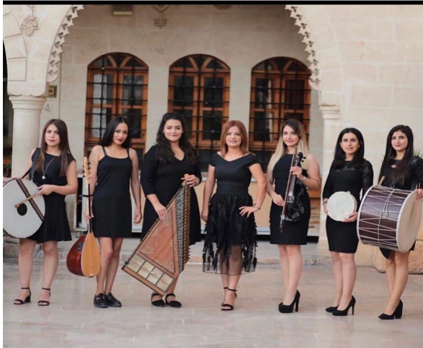
Fotoğraf 2: 2018 yılı Songül Kadın Orkestrasının Günümüzdeki Durumu (Taştan, 2020)