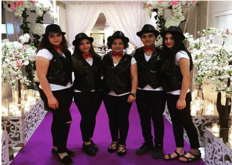
Fotoğraf 4: 2017 yılı Geleneksel kıyafetler dışında farklı kostümlerle yapılan eğlenceler (Taştan, 2020)

Gaziantep'teki kadın eğlencelerinde önemli rol oynayan ve günümüzde yaygın durumda talep edilen kadın dans gruplarının da organizasyon şirketleri vardır. Gaziantep il merkezinde kurulan ilk kadın dans organizasyon şirketi "Rengahenk Dans Organizasyon" şirkettir. Rengahenk organizasyon şirketi, 2015 yılında kurulmuştur. 2008 yılında bu kurum özel olarak çalışmıştır. O dönemde düğün dansı ve halk oyunları üzerine çalışan organizasyon şirketi, 2014 yılında kına gecelerinde de yer almaya başlamıştır. 2015'te de resmi şekilde organizasyon şirketi olarak kurumsallaşmışlardır.