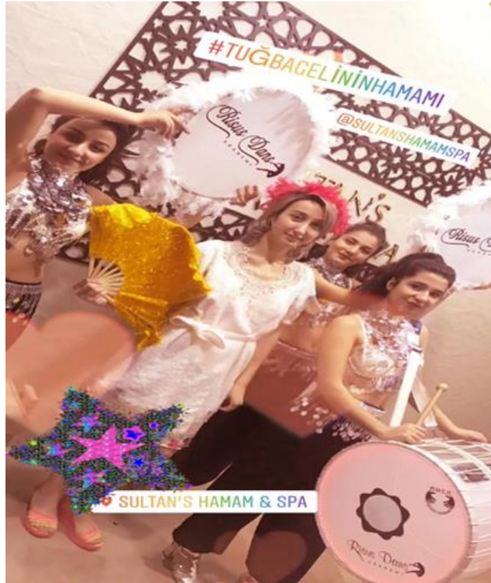
Fotoğraf 15: Risas dans akademisinin 2020 yılında gittiği hamam eğlencesini sosyal medyada paylaşımı