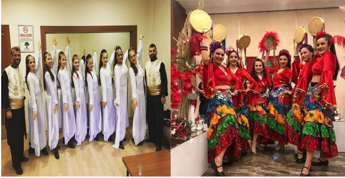
Fotoğraf 10: Rengahenk dans organizasyonunun 2019 yılındaki durumu