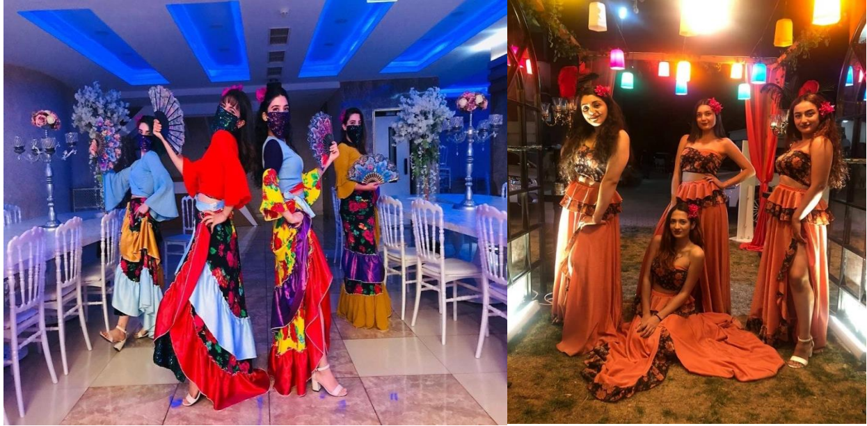
Fotoğraf 13: Mişa dans organizasyonunun 2020 yılındaki durumu Fotoğraf 14: Ares dans org. 2020 yılındaki durumu