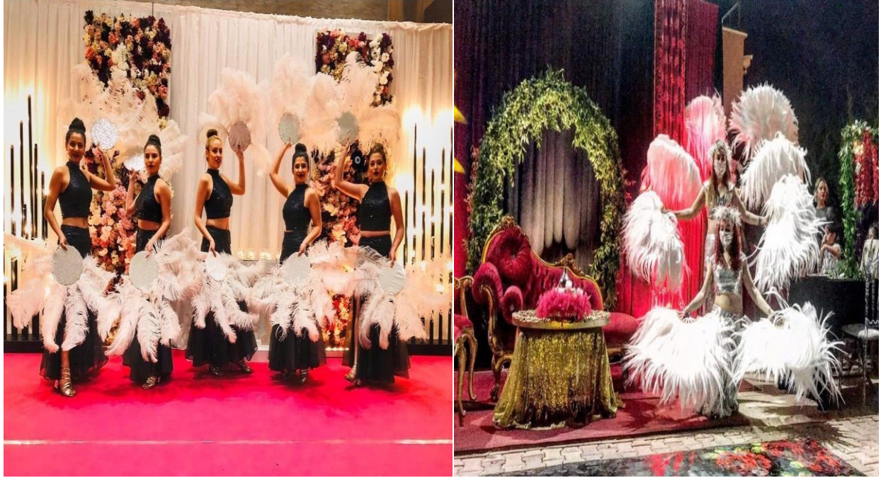
Fotoğraf 11: Nil Dans Organizasyonunun 2020 yılındaki durumu Fotoğraf 12: Risus dans akademisinin 2020 yılındaki durumu