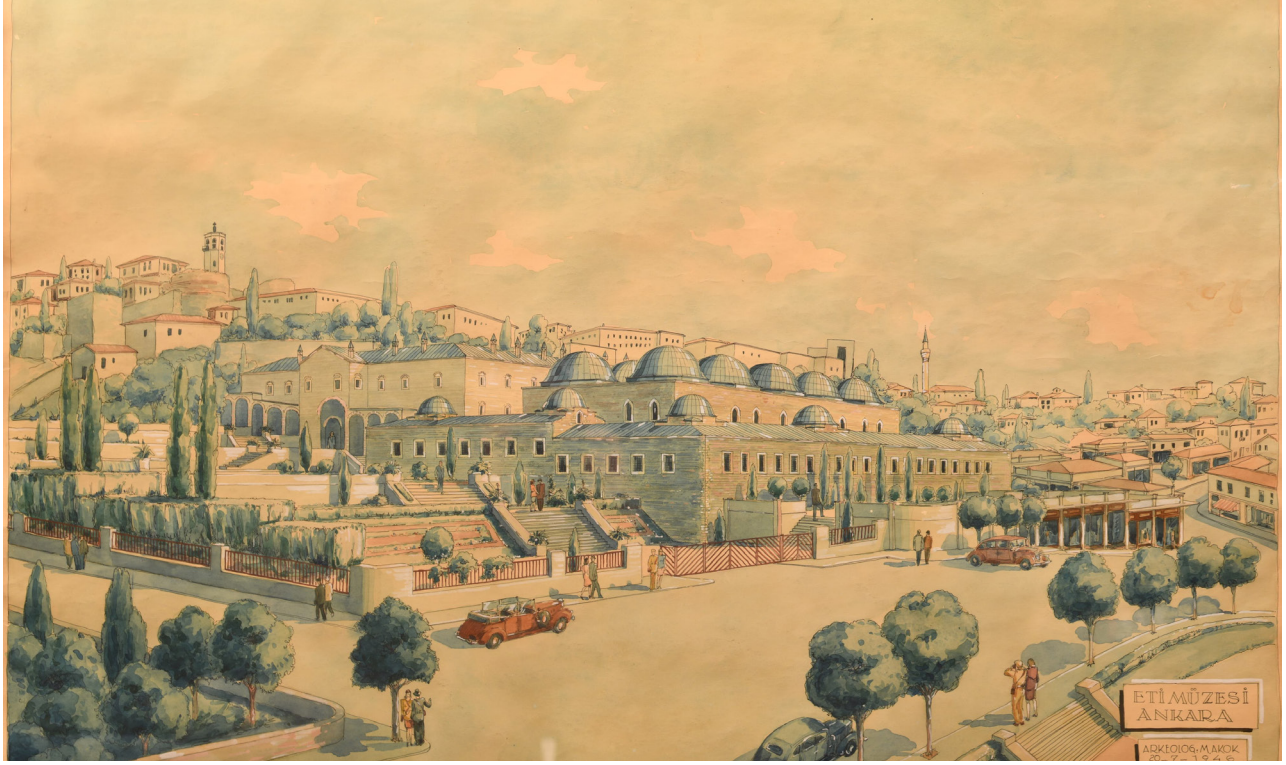
Resim 1- Anadolu Medeniyetleri Müzesi (Çizim Mahmut Akok )