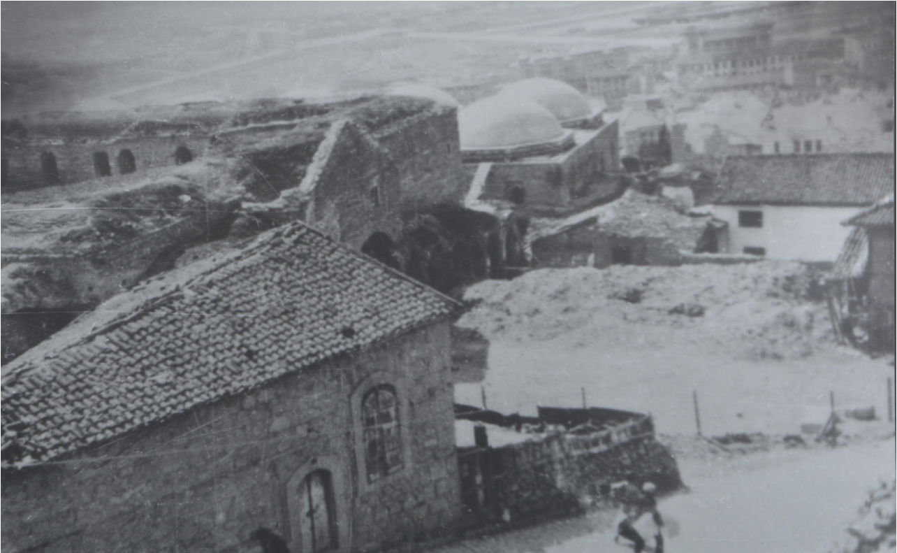
Resim 4- Mahmutpaşa Bedesteni