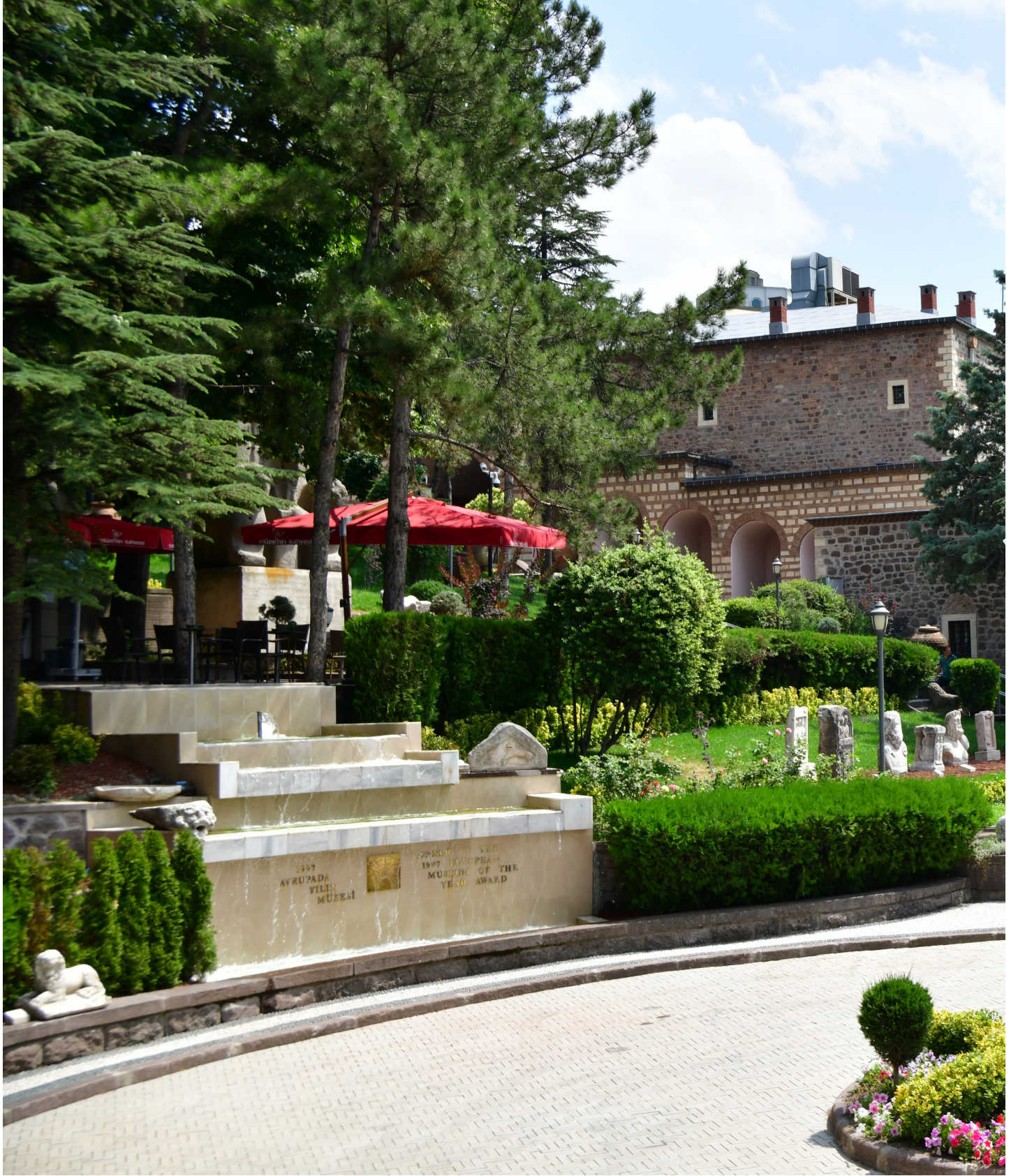
Resim 5- Güncel Durum (Anadolu Medeniyetleri Müzesi, 2021)