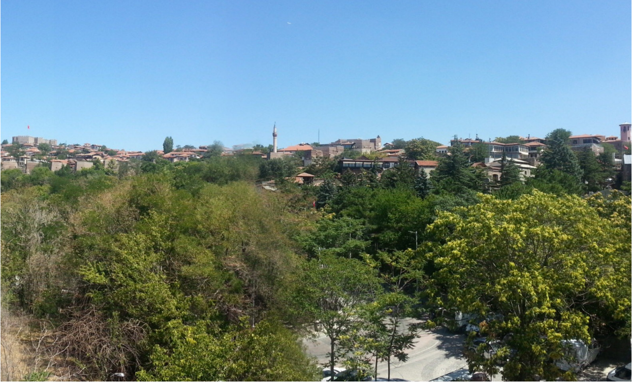
Resim 3- Ankara Kalesi