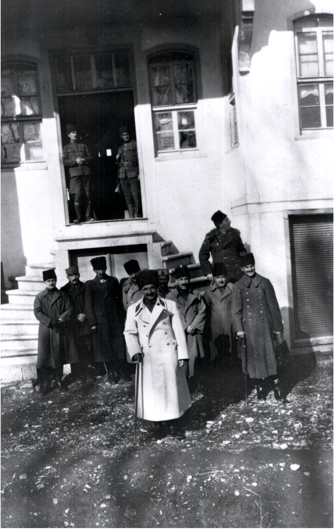
Batı Cephesi Komutanı İsmet Paşa Karargah Binası Önünde (1921)