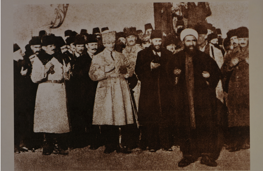
Temsil Heyeti üyeleri ile birlikte Hükümet Konağı önünde yapılan dua sırasında, Ankara, 27 Aralık 1919.