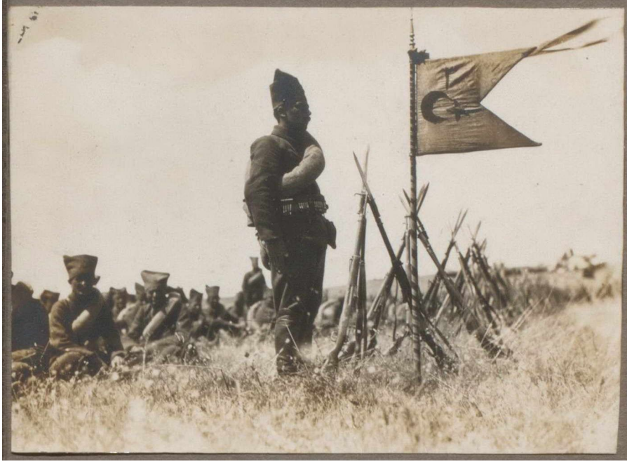
Sakarya Muharebelerinde Sıhhiyeciler Görev Başında (1921)