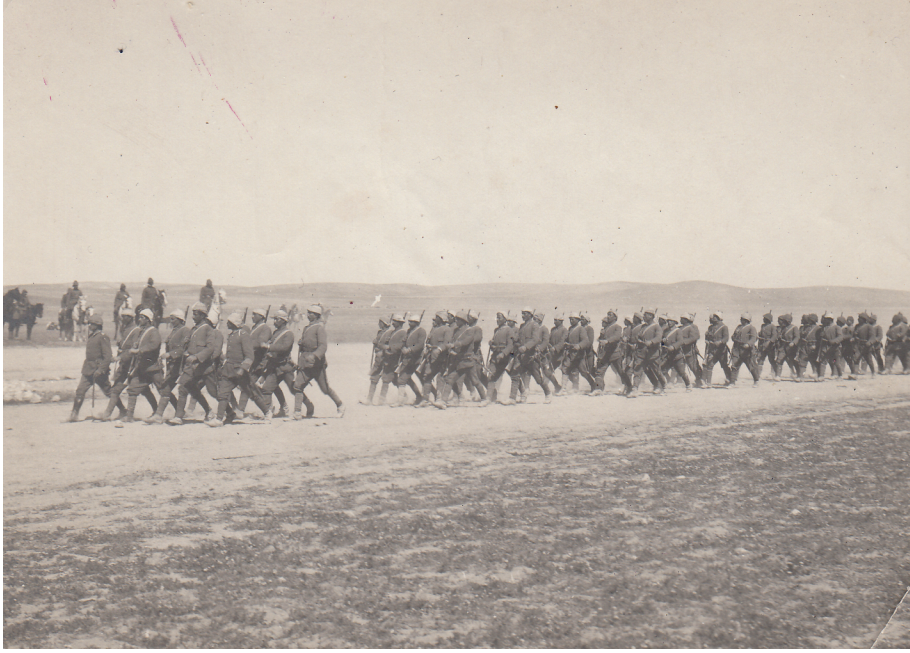
Milli Ordu Yeni Bir Yunan Taaruzu İçin Hazırlık Yapıyor (1921)