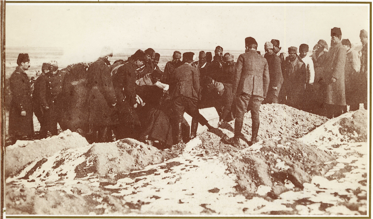
İnönü Savaşları Şehitlerinin Törenle Gömülmesi (1921)