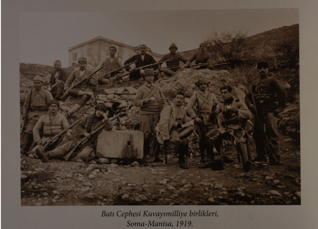
Batı Cephesi Kuvayımilliye birlikleri, Soma-Manisa, 1919.