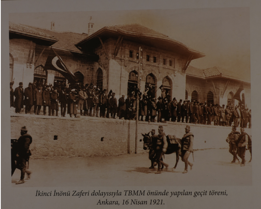
İkinci İnönü Zaferi dolayısıyla TBMM önünde yapılan geçit töreni, Ankara, 16 Nisan 1921.

(Kaynak: Milli Mücadele Albümü, Genelkurmay ATASE Daire Başkanlığı Yayınları, Ankara: 2016)