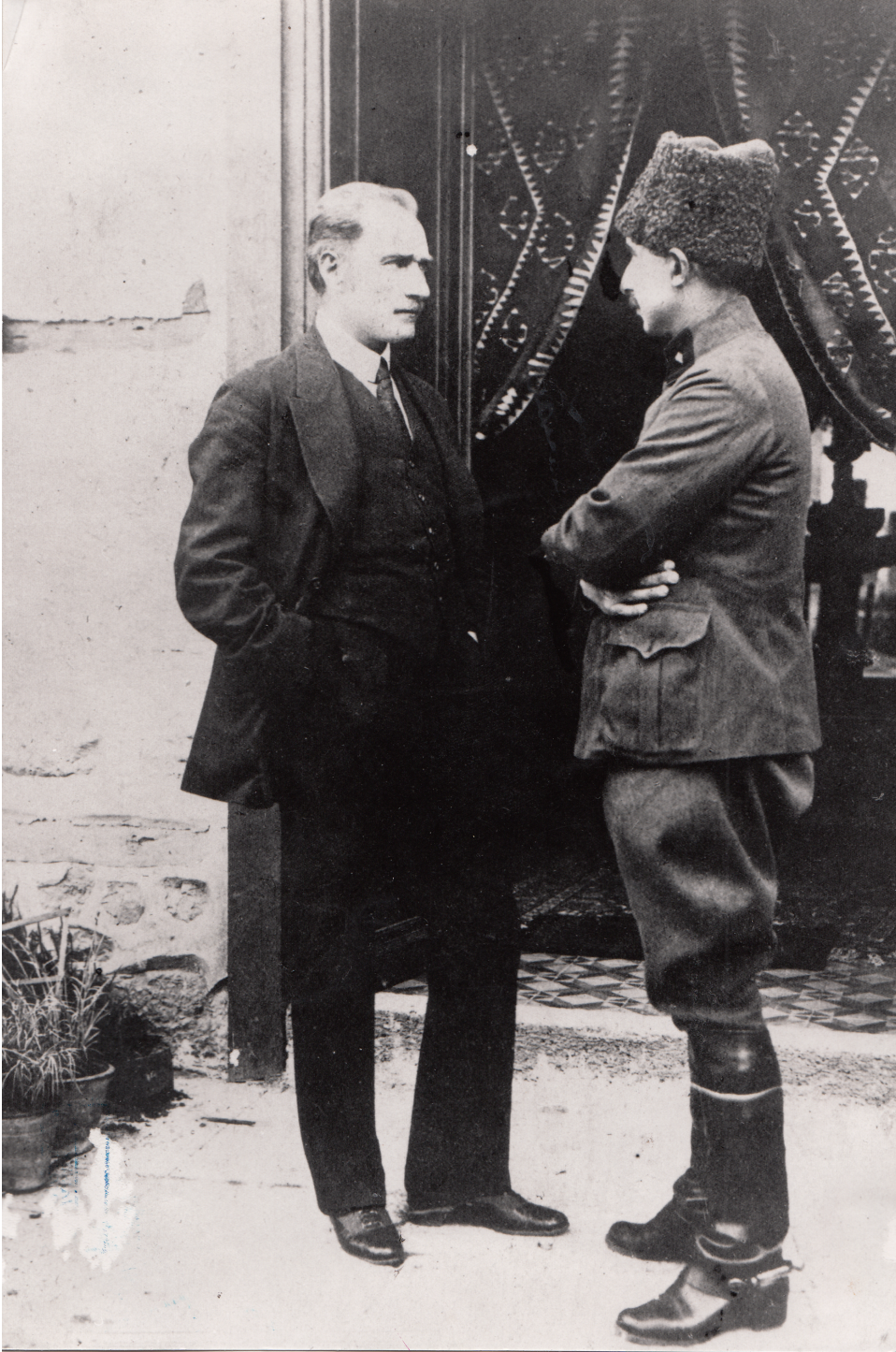
Büyük Millet Meclisi Başkanı Mustafa Kemal Paşa, I. ve II. İnönü Muharebelerinin Muzaffer Komutanı İsmet Paşa ile (1921)