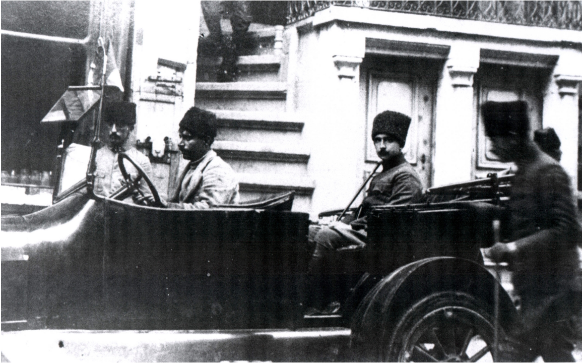
Batı Cephesi Komutanı İsmet Paşa Akşehir'de Karargah Binası Önünde (1921)