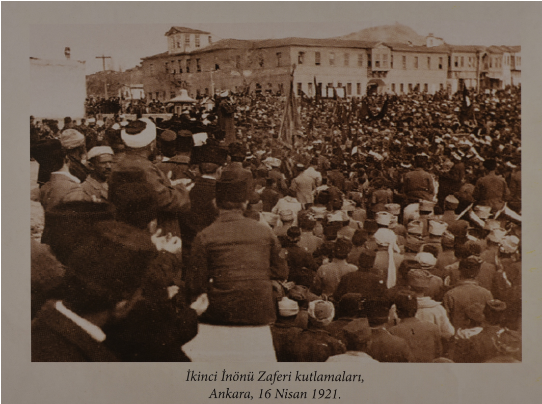
İkinci İnönü Zaferi kutlamaları, Ankara, 16 Nisan 1921.