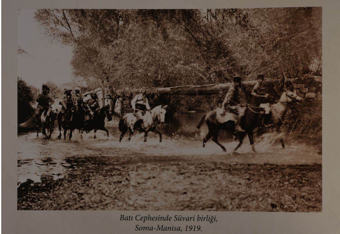
Batı Cephesinde Süvari birliği, Soma-Manisa, 1919.