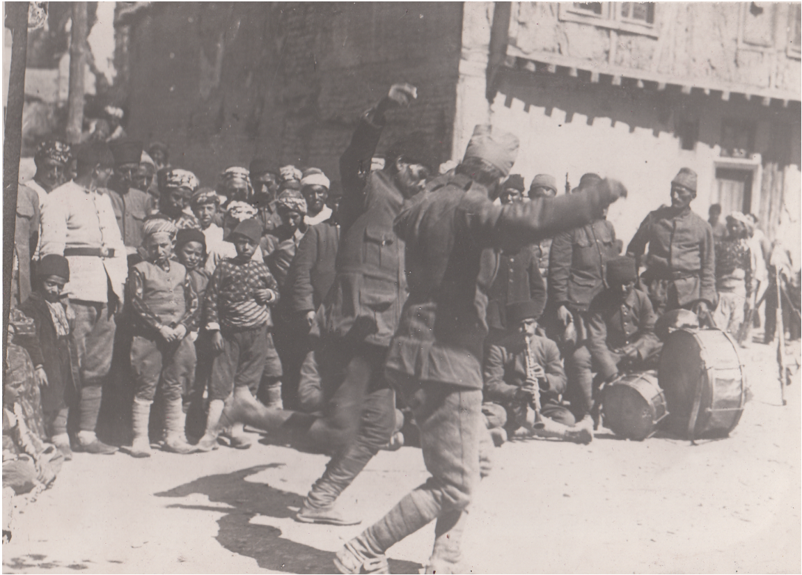
Sakarya Zaferinden Sonra Askerler ve Halk Nehir Kenarında Halay Çekiyor (1921)