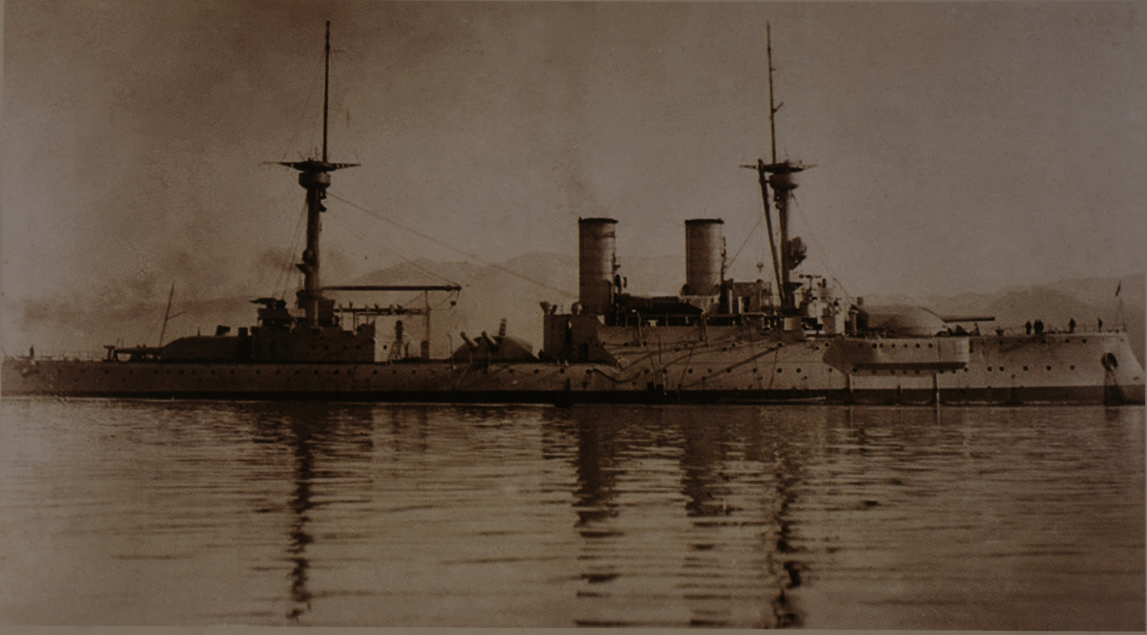
Mondros Ateşkes Antlaşması kararları gereğince Haliç'te bekletilen Turgut Reis zırhlısı, İstanbul, Ekim 1919.