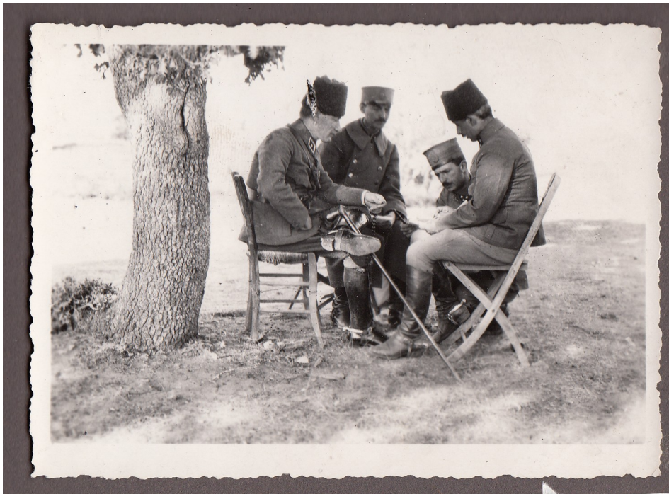
Büyük Taarruzdan Bir Gün Önce Başkomutan Mustafa Kemal Paşa, Batı Cephesi Komutanı İsmet Paşa ve Kur.Alb.Asım Gündüz Harekat Planını Gözden Geçiriyorlar (1922)