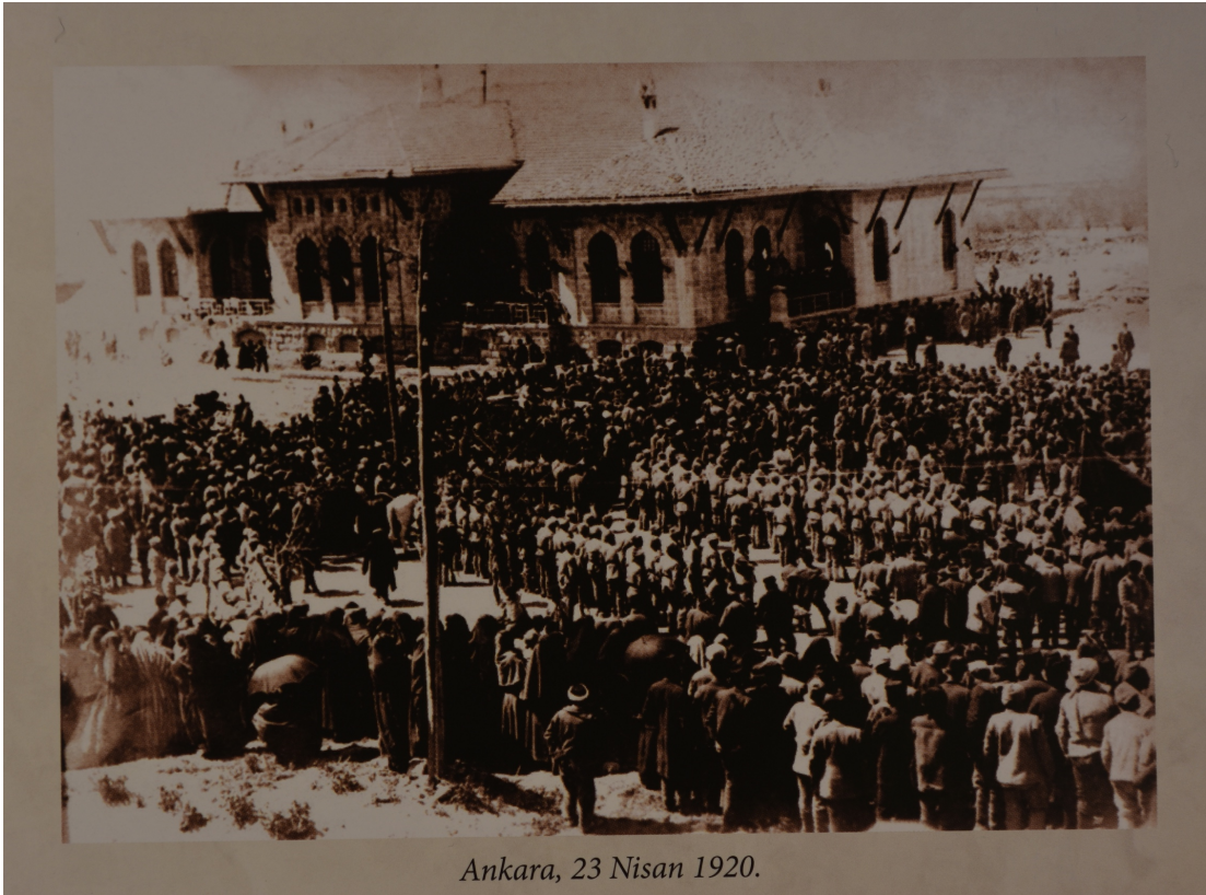
Ankara, 23 Nisan 1920.