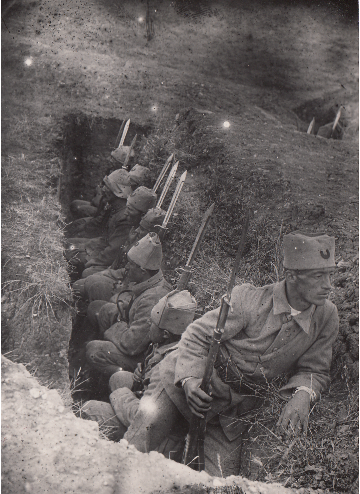
Sümgü Takmış Askerler Siperde Düşmanı Beklerken