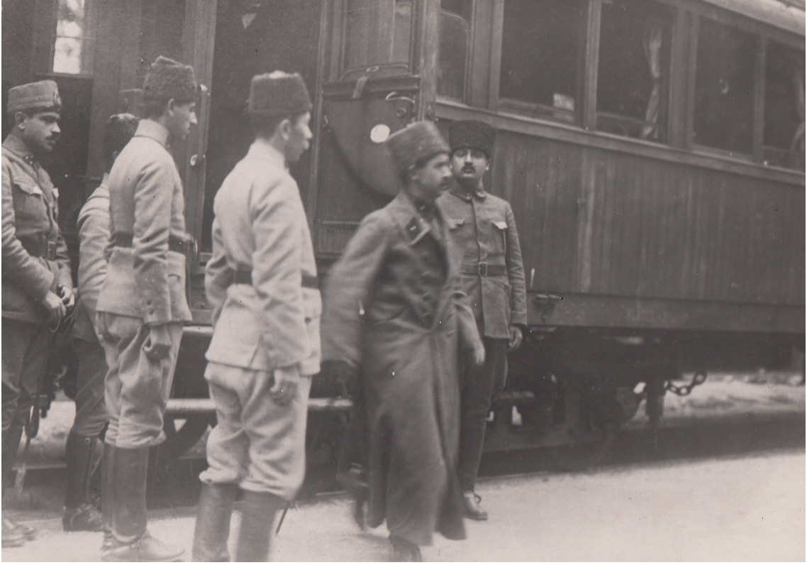
Batı Cephesi Komutanı İsmet Paşa Eskişehir İstasyonunda (1921)