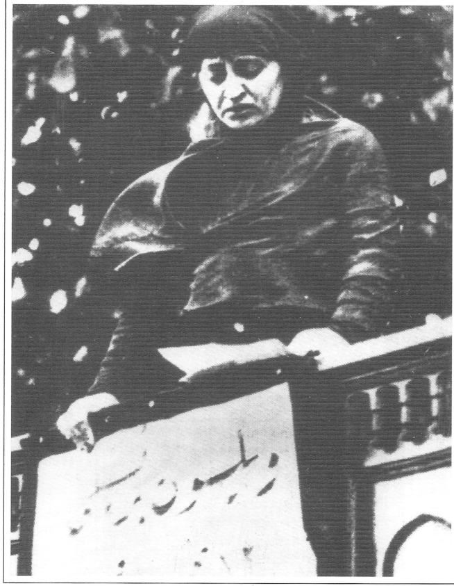
Romancı, yazar, Kurtuluş Savaşı'nın "Halide Onbaşı" sı Halide Edip (Adivar) Hanım Sultanahmet Meydanındaki mitingde İzmir'in işgalini protesto ediyor (23 Mayıs 1919). Kürsüde "Wilson 12. madde" yazılıdır.

(Kaynak: Milli Mücadele Albümü, Genelkurmay ATASE Daire Başkanlığı Yayınları, Ankara: 2016)