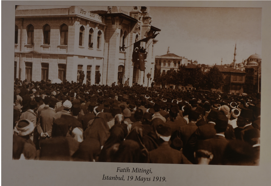
Fatih Mitingi, İstanbul, 19 Mayıs 1919.