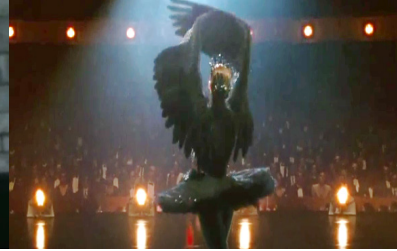
Resim 28. Siyah Kuğu Filmi (1:36:32)