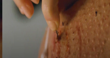
Resim 19. Siyah Kuğu Filmi (1:24:43)