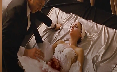
Resim 31. Siyah Kuğu Film (1:41:22)