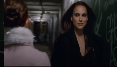
Resim 8. Siyah Kuğu Filmi (15:55-15:58)

Nina evine geldiğinde başarısız geçen seçimler için çok mutsuzdur. Odasına gider ve yatağına uzanır. Bu sahnede dikkat çeken Nina'nın odasının hala küçük bir kız çocuğunun odasına benzemesidir. Duvarlar pembe renkte ve her yer pelüş oyuncaklar ile doludur. Oda annesinin güvenli rahmine benzemektedir. Burada Nina'nın kişiliğinin gelişiminde etkili olan beş aşamada sorunlar yaşadığı anlaşılmaktadır. Nina'nın kişiliğinin "Genital Dönem"de çocukluktan erişkinliğe geçemediğini göstermektedir. Hala tıpkı küçük bir çocuk gibi davranmaktadır. Annesinin himayesi altında yaşamaktadır.