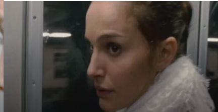
Resim 2. Siyah Kuğu Film (05:09-05:19)