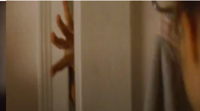
Resim 21. Siyah Kuğu Filmi (1:25:02)