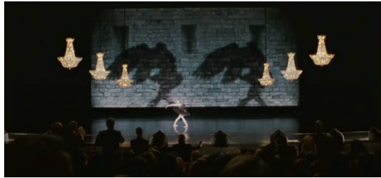
Resim 29. Siyah Kuğu Filmi (1:36:40)

Filmin sonuna doğru (1:38:24-1:42:37 dakikalar arasında), Nina aslında kendisini yaraladığını anlar. Bu şekilde sahneye çıkar. Nina, filmin son sahnesinde atlaması gereken platforma çıkar. Seyirciler arasında duran annesi ile göz göze gelir ve kendisini platformdan aşağıya bırakır. Nina rolünü başarılı bir şekilde yapmıştır. Bütün rol arkadaşları ve Thomas, Nina'yı tebrik etmek için kendisini aşağıya bıraktığı yere gelirler. Herkes Nina'nın yaralı olduğunu fark eder. Thomas kendisine ne yaptığını sorunca Nina hissettiğini ve mükemmel olduğunu söyler. Bu sahnede, Nina'nın küçüklük döneminde Anal Evre'de sıkıntılar yaşadığı görülmektedir. Birey, Anal Dönemde baskıcı ve cezalandırıcı bir tuvalet eğitimi görürse bu dönemde sıkıntılar yaşar. Birey ileride inatçı, kendisini denetim altında tutan bir bireye dönüşebilir. Nina'nın karakterine bakıldığında, kendisini denetim altında tutan ve mükemmelliği arayan bir kişilik görülür.