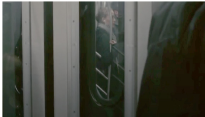
Resim 3. Siyah Kuğu Film (05:20-05:36)