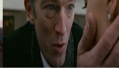
Resim 15. Siyah Kuğu Film (41:25-42:18)

Daha sonraki sahnede Lily, Nina'nın evine gider ve onu dışarı çıkmak için davet eder. Nina'nın annesi buna izin vermez fakat bundan rahatsız olan Nina annesine ilk kez karşı gelerek Lily ile dışarı çıkar. Nina annesinden uzaklaşmaya başlamış ve hatta onu hayatında bir engel olarak görmeye başlamıştır. Bu da Nina'nın hayatında başka bir önemli kırılma noktasıdır. Nina, artık içindeki diğer kötü tarafı ortaya çıkartmaya başlamıştır. Nina'daki İd, artık daha ağır basmaya başlamıştır.