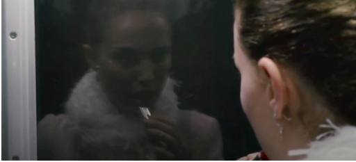
Resim 10. Siyah Kuğu Filmi (19: 07-19:18)

Filmde (19:07-21:47 dakikaları arasında) Nina yönetmen Thomas ile seçmeler hakkında konuşmak istemektedir. Nina metroda Beth'in odasından çaldığı kırmızı rujlu metronun camına bakarak sürmektedir. Lacan'ın ayna evresinde olduğu gibi Nina kendi benliğini bulmaya başlamaktadır. Metrodaki bu cam Nina için bir kırılma noktasıdır. Thomas'ın odasının önünde bekler ve Thomas gelince onu odasına davet eder. Nina seçmeler için konuşmaya başlar. Siyah kuşu oynayabileceğini söyler, fakat Thomas bunun için yeterli tutku ve hırsının olmadığını belirtir. Nina ısrar eder, ancak Thomas kabul etmez. Nina tam odadan çıkacakken Thomas onu öpmeye başlar, fakat Nina onun dudağını ısırır. Bu olay Nina için ayrı bir kırılma noktasıdır. İçindeki hırs ve tutku ortaya çıkmıştır. Bu sayede Nina rolü alır.