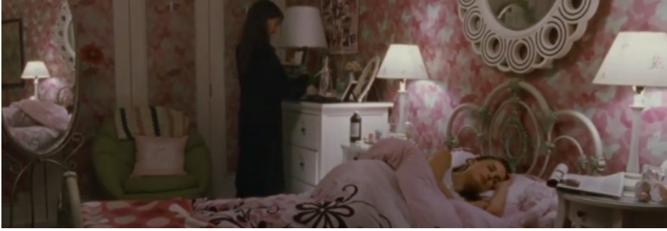
Resim 9. Siyah Kuğu Filmi (17: 42-19: 02)

Filmde (19:07-21:47 dakikaları arasında) Nina yönetmen Thomas ile seçmeler hakkında konuşmak istemektedir. Nina metroda Beth'in odasından çaldığı kırmızı rujlu metronun camına bakarak sürmektedir. Lacan'ın ayna evresinde olduğu gibi Nina kendi benliğini bulmaya başlamaktadır. Metrodaki bu cam Nina için bir kırılma noktasıdır. Thomas'ın odasının önünde bekler ve Thomas gelince onu odasına davet eder. Nina seçmeler için konuşmaya başlar. Siyah kuşu oynayabileceğini söyler, fakat Thomas bunun için yeterli tutku ve hırsının olmadığını belirtir. Nina ısrar eder, ancak Thomas kabul etmez. Nina tam odadan çıkacakken Thomas onu öpmeye başlar, fakat Nina onun dudağını ısırır. Bu olay Nina için ayrı bir kırılma noktasıdır. İçindeki hırs ve tutku ortaya çıkmıştır. Bu sayede Nina rolü alır.