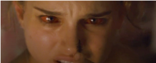
Resim 20. Siyah Kuğu Filmi (1:24:49)