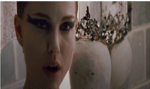
Resim 24. Siyah Kuğu Film (1:33:14)