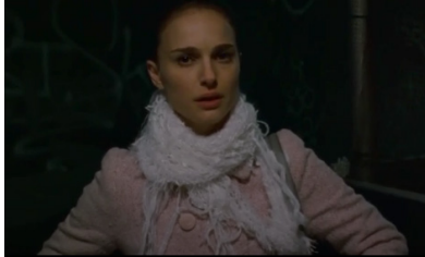
Resim 7. Siyah Kuğu Filmi (15:34-15:55)

Nina (15:34 ile 15:58 dakikaları arasında) eve giderken kendisine doğru yürüyen ve tıpkı kendisine benzeyen bir kadın görür. Bu noktada Nina yine alter egosu ile karşılaşmaktadır. Bu sefer gördüğü alter ego kendisine bire bir benzemektedir. Nina'nın kontrolden çıkmış olan bir alter egoya sahip olduğu görülmektedir. Bu da psikolojik bozukluk anlamına gelmektedir.