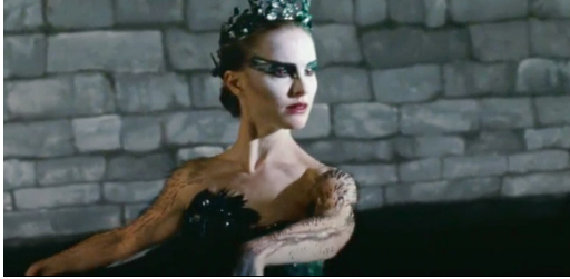
Resim 27. Siyah Kuğu Filmi (1:36:10)