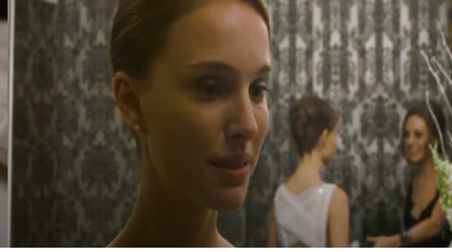
Resim 13. Siyah Kuğu Film (33:14-33:48)

Nina provalarda Thomas'ın onu öpmesi üzerine ertesi sabah yatağında kendine dokunmaya başlar. Bu noktada Nina'nın küçükken "Fallik Dönem"inde engellendiği anlaşılmaktadır. Bu nedenle, yetişkinlik döneminde cinsellikle ilgili sıkıntılar yaşamaktadır. Ayrıca Thomas'ın onu öpmesinden sonra ona karşı hisler duymaya başlamıştır. Nina, Odius Kompleksi ve Kastrasyon Kompleksi yaşamaktadır. Babasının yerine Thomas'ı koyup ona hayranlık benzeri hisler beslemektedir (Görsel 14,15).