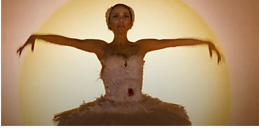
Resim 30. Siyah Kuğu Film (1:41:20)

Nina küçükken Anal Evrede sıkıntılar yaşadığı için yetişkinlik döneminde de sorunlarla karşılaşmaktadır. Ayrıca mükemmelliğe kavuşabilmek ve içindeki tutkuyu ortaya çıkartabilmek için kendisine zarar verebilecek kadar nevrotik bir davranış sergilemiştir.