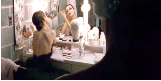
Resim 22. Siyah Kuğu Film (12:32:59)

Nina, gösteri sırasında Beyaz Kuğu'yu mükemmel bir şekilde canlandırır fakat, sonlara doğru sahnede küçük bir kaza yaşar. Partneri onu düşürür, Nina ağlayarak soyunma odasına gider. Nina (1:32:53- 1:36:40 dakikaları arasında) Siyah Kuğu kostümü içinde ayna karşısında makyaj yapan Lily'i görür. Lily ona Siyah Kuğu rolünü yapamayacağına dair sözler söyler. Nina'nın yerine kendisinin oynayabileceğini söyler. Bu sırada Lily'in yüzü kendi yüzüne dönüşür. Buna çok sinirlenen Nina, Lily'i odadaki aynaya doğru iter ve ayna kırılır. İkili arasında bir kavga başlar ve Nina yerde yatan Lily'i aynanın kırıkları ile yaralar. Nina bunu yaparken boynu bir kuğu gibi uzar ve gözleri kırmızı renge dönüşür. O sırada Lily'in yüzü tekrar kendi yüzüne döner. Bu sahneye bakıldığında, Nina aynayı kırarak kendi kişiliğinde tamamen bir kırılma noktası yaşamıştır. Ayna, Nina için hem yeniden doğuşa, hem de bir yıkıma neden olmuştur. Yeniden Alter Ego'suyla karşılaşmış ve ondan kaçmak yerine, aslında onunla bütünleşme yaşamıştır. Artık içindeki İd ortaya çıkmıştır. Nina, rolünü canlandırırken siyah kuğuya dönüşmeye başlar. Kollarında ve sırtında tüyler çıkar. Elleri kuğunun ayakları gibi siyah renge dönüşür. Sahnenin sonunda ise tamamen siyah kanatları çıkar. Nina, bu sahnede tamamen bir özdeşleşme yaşamaktadır. İçindeki kötü karakter ortaya çıkmıştır.