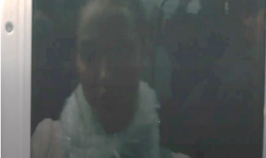
Resim 1. Siyah Kuğu Film (05:09-05:19)

Filmde (05:22-05:42 dakikaları arasında) Nina metronun kapısındaki camda kendi yansımasını görür. Kafasını çevirdiğinde ise insanların arasında duran ve tıpkı saçı, duruşu kendisine benzeyen bir kadın görür. Bu sahnede Nina kendi alter egosuyla karşılaşmaktadır. Tıpkı kendisi gibi duran ve kendisine benzeyen bu karakter bir alter egodur. Daha sonraki sahnede ise metroda gördüğü kişi bale okuluna gelir. Bu kişi Lily, yani yeni dansçıdır. Filmde Nina'nın alter egosu Lily'dir.