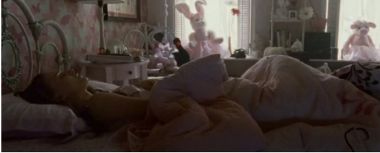
Resim 14. Siyah Kuğu Film (39:12-40:13)

Nina provalarda Thomas'ın onu öpmesi üzerine ertesi sabah yatağında kendine dokunmaya başlar. Bu noktada Nina'nın küçükken "Fallik Dönem"inde engellendiği anlaşılmaktadır. Bu nedenle, yetişkinlik döneminde cinsellikle ilgili sıkıntılar yaşamaktadır. Ayrıca Thomas'ın onu öpmesinden sonra ona karşı hisler duymaya başlamıştır. Nina, Odius Kompleksi ve Kastrasyon Kompleksi yaşamaktadır. Babasının yerine Thomas'ı koyup ona hayranlık benzeri hisler beslemektedir (Görsel 14,15).