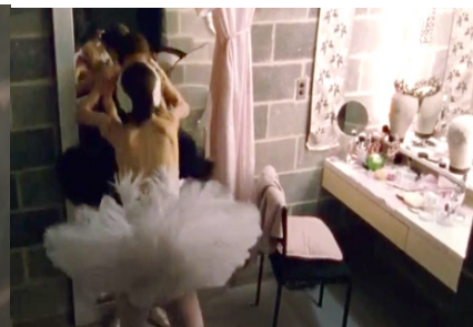
Resim 25. Siyah Kuğu Film (1:33:19)