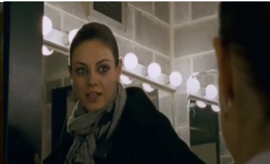
Resim 4. Siyah Kuğu Film (07:02)

Nina (12:06-12:52 dakikaları arasında) eski baş dansçı Beth'in soyunma odasına girer ve aynanın karşısına oturur. Makyaj masasında duran ve Beth'e ait olan