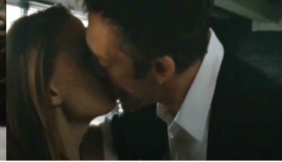
Resim 11. Siyah Kuğu Filmi (21: 23-21:47)

Nina (32:20-33:48 dakikaları arasında) Alter Egosu olan Lily ile ilk kez konuşma fırsatı bulur. Nina'nın seçilmesi ve baş dansçı Beth'in emekli olmasının şerefine düzenlenen partide Nina tuvalete gider. Elini yıkarken parmağındaki etin soyulduğu sanrısını görür. Nina'nın mükemmeliyetçiliği gittikçe baskı yaratmakta ve sanrılarının şiddetlenmesine yol açmaktadır. Daha sonra tuvaletin kapısı çalar ve Lily ile karşılaşır. Sahnede Lily'in hareketlerine bakıldığında Nina'nın tam tersi olduğu görülmektedir. Rahat, neşeli, sevimli ve özgür bir tavrı vardır. Ayrıca Nina'nın beyaz elbisesi ve Lily'in siyah elbisesi karşıtlıklarını yansıtmaktadır.