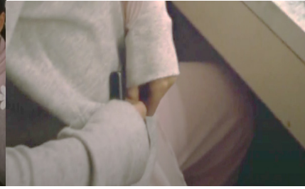
Resim 6. Siyah Kuğu Filmi (12:42-12:45)

Nina (15:34 ile 15:58 dakikaları arasında) eve giderken kendisine doğru yürüyen ve tıpkı kendisine benzeyen bir kadın görür. Bu noktada Nina yine alter egosu ile karşılaşmaktadır. Bu sefer gördüğü alter ego kendisine bire bir benzemektedir. Nina'nın kontrolden çıkmış olan bir alter egoya sahip olduğu görülmektedir. Bu da psikolojik bozukluk anlamına gelmektedir.