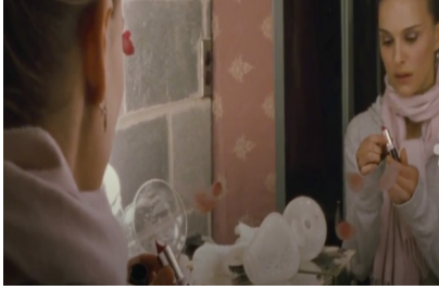
Resim 5. Siyah Kuğu Filmi (12:31-12:41)

ruju cebine koyarak odadan çıkar. Bu sahnede Nina, Beth ile bir özdeşleşme yaşamaktadır. Beth'e ait olan ruju çalarak onunla bir bütünleşme yaşamaya çalışmakta ve onun gibi olma arzusunu göstermektedir.