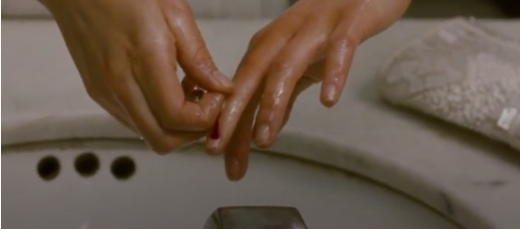
Resim 12. Siyah Kuğu Film (32:20-32:48)