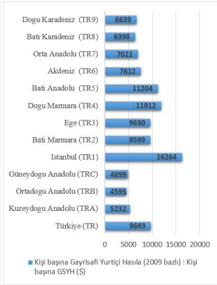
Grafik 3: Düzey 1 Bölgelerinde Kişi Başına GSYH (2018)