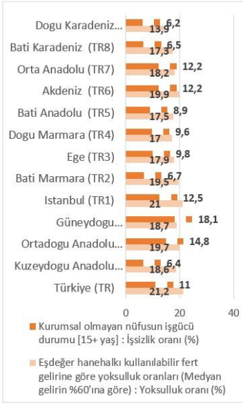
Grafik 2. Düzey 1 Bölgelerinde Yoksulluk ve İşsizlik Göstergeleri (2018)