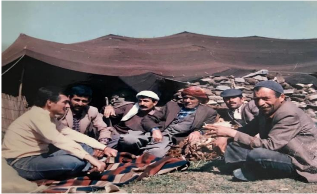
Doğu’da göçerler (Beritanlılar) alan çalışmasından (Bingöl,1986)

bir araştırmaya orada başladım. Asistanlık yıllarımda ilk iki yılında danışmanım Sedat Veyis Örnek gözetiminde başlamıştım. Onunla planlamıştık, geniş çaplı bir göçer aşiret monografisi olarak düşünüyorduk tezimizi. Ama ne yazık ki hocamın iki yıl sonra, 1980’de vefatıyla onun yerine Orhan Acıpayamlı Hocamın danışmanlığında tezimi tamamladım. O yıllar, o dönem, o coğrafyada böyle bir konuyu çalışmak bazı güçlükleri beraberinde getiriyordu elbette. Ama benim için Türkiye’deki halkbilim çalışmaları içinde gerçekten ilk denilebilecek, yani katılarak gözlemlenmiş, uzun süreli, alanda kalarak gerçekleştirilmiş bir araştırma önemliydi. Ben bu konuya nasıl başladığımı hikâyelendirirken sıklıkla şöyle bir cümle kurardım: “Doğusu Kayseri’de biten genç bir araştırmacının bir gün kendisini Tunceli-Erzincan il sınır üzerindeki Munzir Dağı’nda bir kara çadırın içinde bulunca dünyası değişti.” Bu da tezimin hikâyesinin başladığı noktadır.