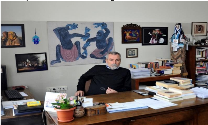
A.Ü. DTCF Halkbilimi Bölümü (1994-2019)

MMK: Ben teşekkür ederim, sizler de sağ olun.