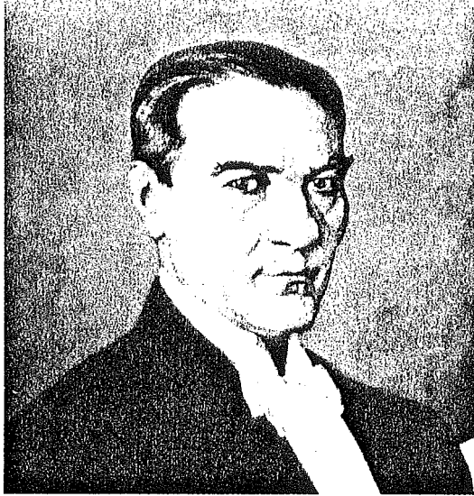
MUSTAFA KEMAL ATATÜRK IN BAD KREUZNACH