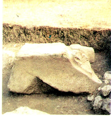
1.b - Aynı eserin günışığına çıkarıldıktan sonra kuzey yönden görünümü.