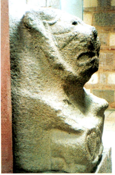
2.a - Alaca Höyük'te bulunmuş arslan tasviri (Anadolu Medeniyetleri Müzesi /Ankara).