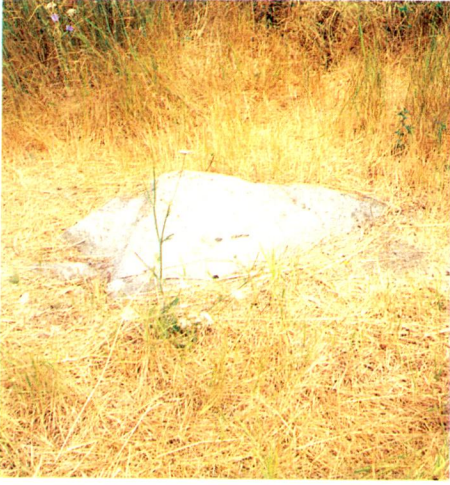
1.a - Çift başlı arslan protomunun açığa çıkartılmasından önceki durum (1993).