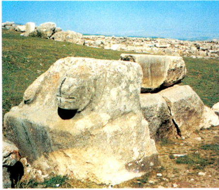
2.c - Arslanlı Tekne/Boğazköy.