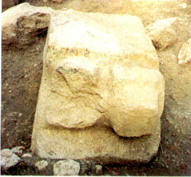
1.c - Aynı eserin Batı yönden görünümü.