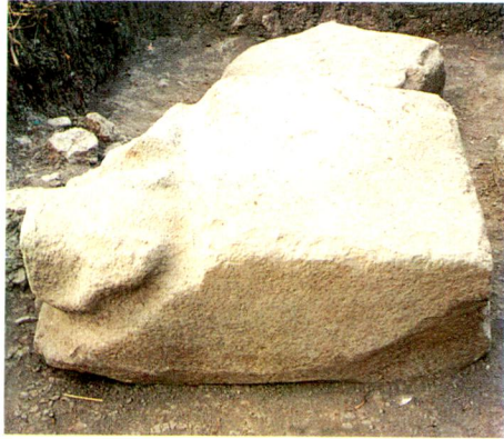
1.d - Aynı eserin güney yönden görünümü.