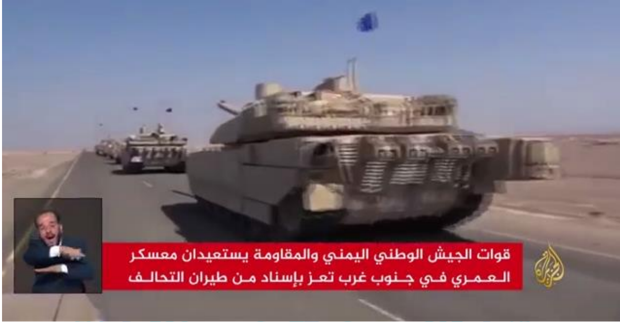
Resim 2. Yemen Milli Ordusu'nun Zaferlerinin ve Popüler Direnişin Arap İttifak Uçaklarının Desteğiyle Gösterimi