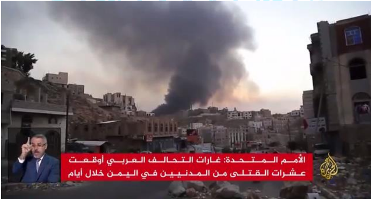
Resim 4. Arap Koalisyonu Hava Saldırıları ile İlgili Haber