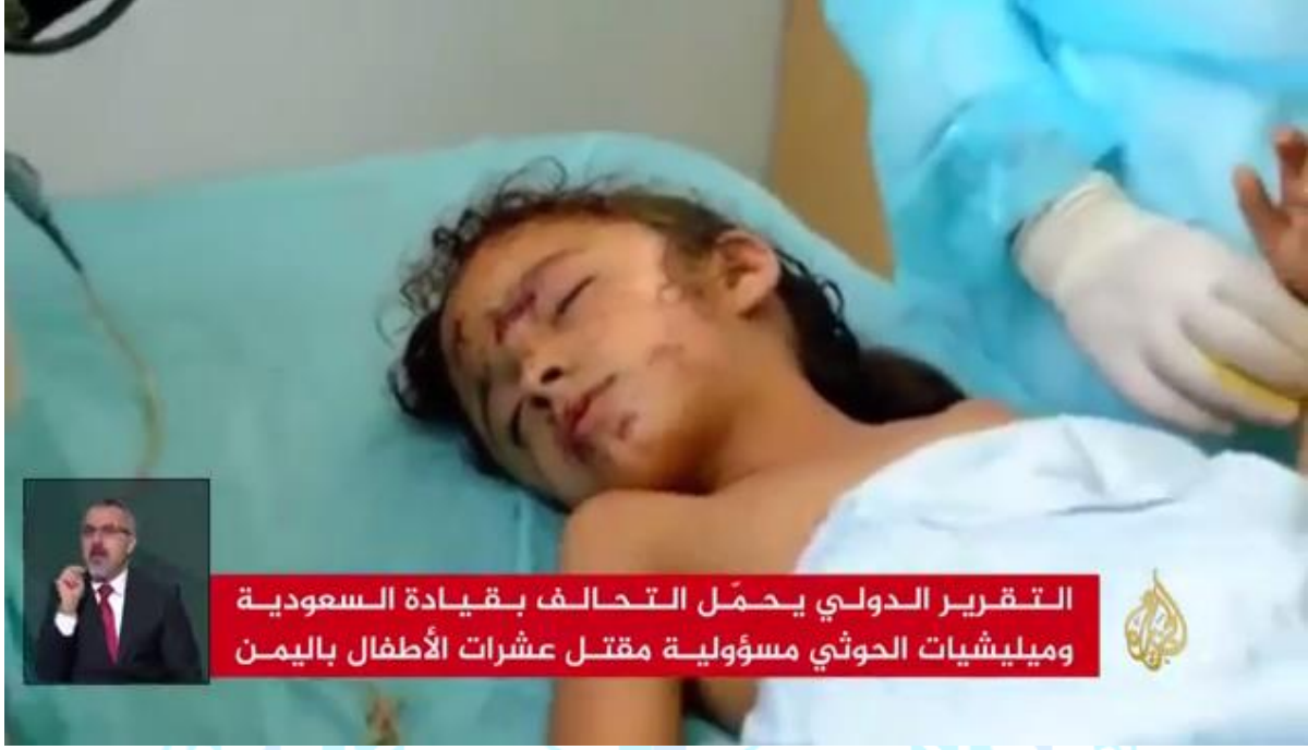
Resim 3. Yemen’de Çocuk Ölümleri ve Sakatlanmalarıyla İlgili Uluslararası Bir Haber